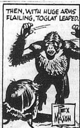
THEN, WITH HUGE ARMS FLAILING, TOGLAT LEAPED.

Пан нетрів відповів на це визнаючим малпачим криком. Тоді Тоглат кинувся, вимахуючи руками наче ціпами.