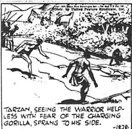
TARZAN, SEEING THE WARRIOR HELPLESS WITH FEAR OF THE CHARGING GORILLA, SPRANG TO HIS SIDE.

Коли Тарзан побачив, що воївник безпомічний зо страху перед напасником, він скочив на його рятунок.