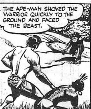
THE APE-MAN SHOVED THE WARRIOR QUICKLY TO THE GROUND AND FACED THE BEAST.

Коли Тарзан побачив, що воївник безпомічний зо страху перед напасником, він скочив на його рятунок.