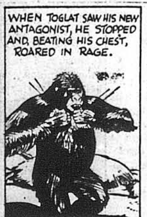
WHEN TOGLAT SAW HIS NEW ANTAGONIST, HE STOPPED AND, BEATING HIS CHEST, ROARED IN RAGE.

Малпочоловік повалив швидко воївника на землю, а самий зустрінувся зо звіркою.