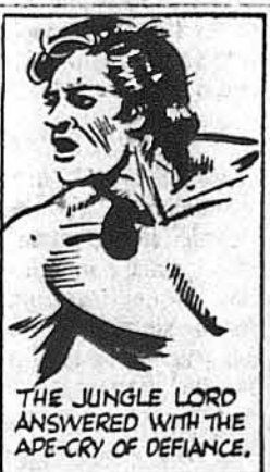
THE JUNGLE LORD ANSWERED WITH THE APE-CRY OF DEFIANCE.

Як лише Тоглат побачив свого нового противника, він пристанув і з люті почав бити себе в груди.