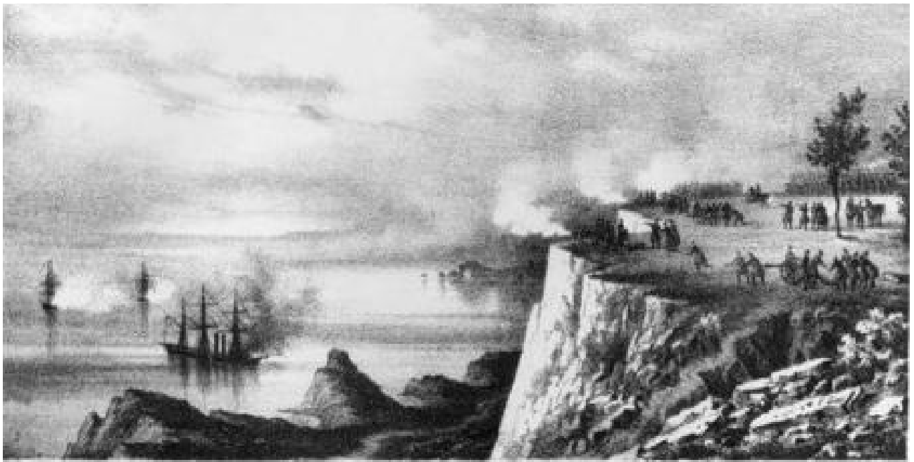
Рис. 2. «Отражение двух английских пароходов, пришедших на помощь к сдававшемуся пароходо-фрегату «Тигр», 30 апреля 1854 г.».