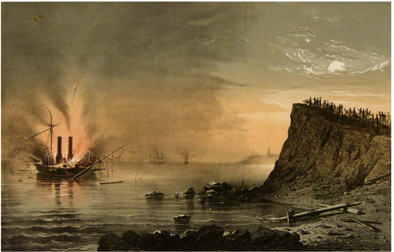
Рис. 3. «Взрыв сидящего на мели английского парохода-фрегата «Тигр» в виду других двух отбитых пароходов у хутора Кортаца, 30 апреля 1854 г.» (Літографія Ф.І. Гросса (1822 – 1897). Одеський краєзнавчий музей).

Слід зазначити, що дослідник М.І. Ленц спотворює початкові дії проти «Тигра» на користь командира 3-го піхотного корпусу генерал-ад'ютанта барона Д.Є. Остен-Сакена (24.04.1789 – 4.03.1881), переконуючи, що саме за наказом останнього непричетні до цього російські підрозділи прибули до «Тигра». Але це твердження спростовується принаймні двома фактами, а саме: тим, що Ф.І. Абакумов отримав догану від генерал-майора Є.І. Майделя (26.01.1837 – 20.03.1881) за те, що покинув Люстдорф без його дозволу, і тим, що серед усіх бойових російських підрозділів, які дислокувалися в Одесі, тільки дунайці 2-го козачого полку мали вишкіл до абордажного бою із судовими екіпажами ворога.