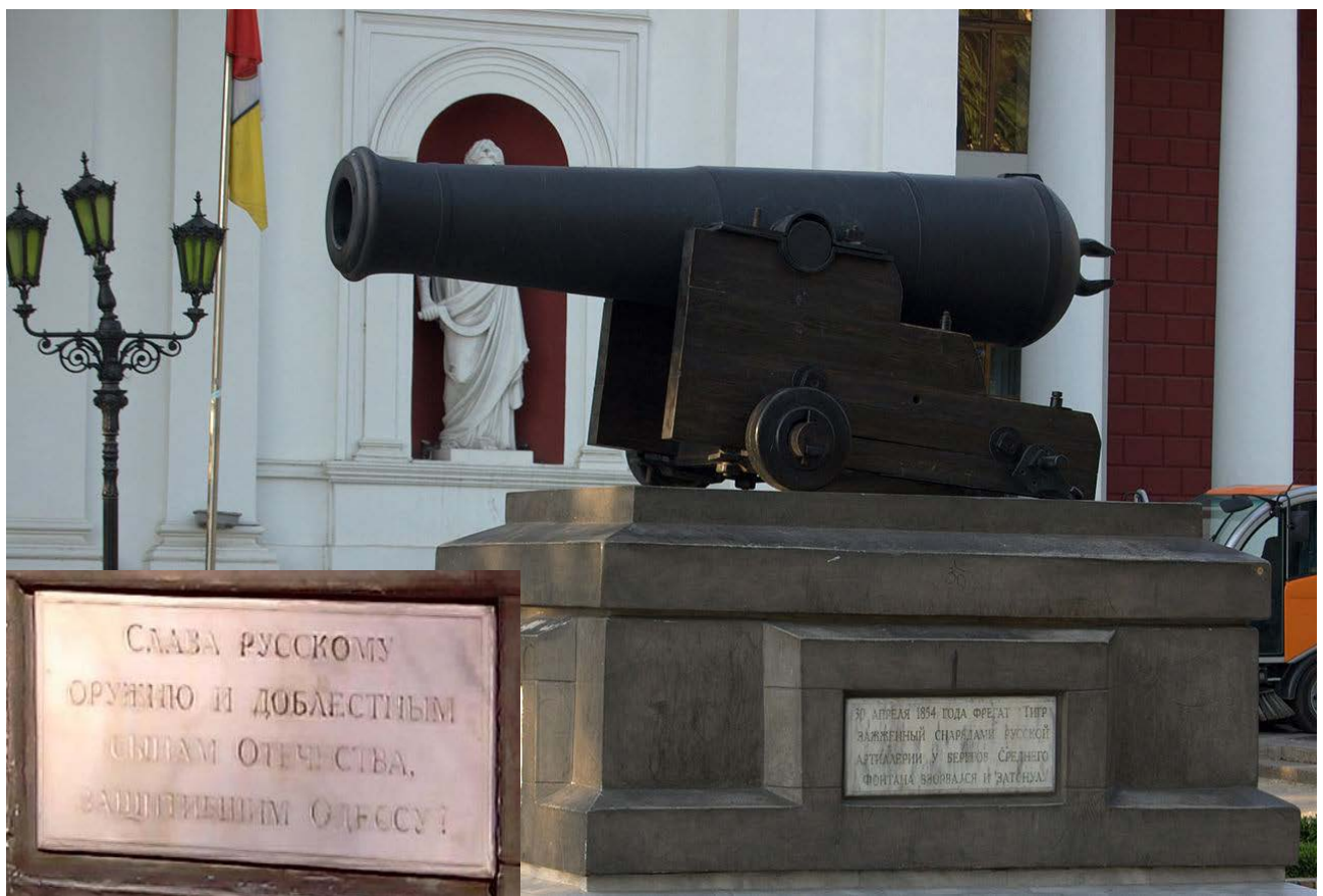
Рис. 5. Трофейна гармата з «Тигра» (Одеса, Думська площа).