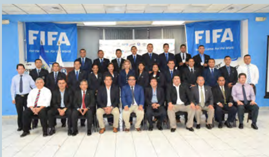
Entrega de Escarapelas FIFA año 2019

Autoridades de Concacaf, Comité Ejecutivo de la Federación Salvadoreña de Fútbol en coordinación con la Comisión de Árbitros, entregaron el 28 de enero del 2019 las escarapelas FIFA para los árbitros, árbitros asistentes, árbitras, árbitras asistentes, árbitros de fútbol sala y fútbol playa, correspondientes al año 2019.