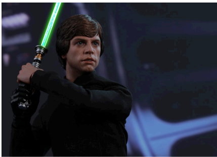
Star Wars: Luke Skywalker