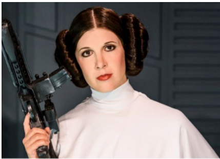
Star Wars: Princess Leia