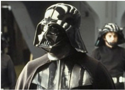
Star Wars: Darth Vader