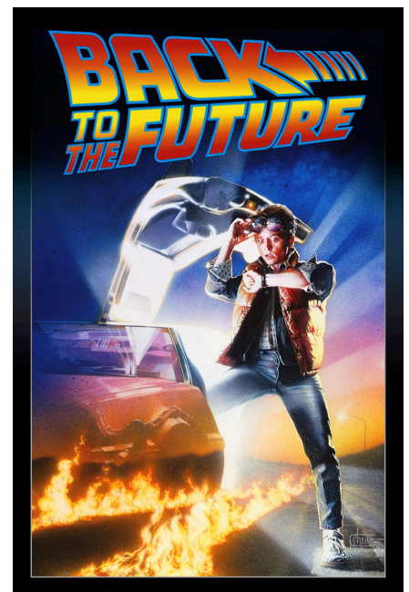
Back to the Future