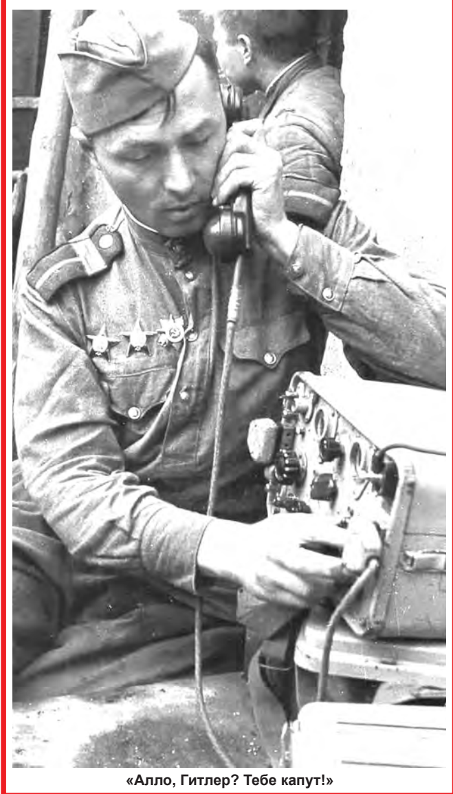
«Алло, Гитлер? Тебе капут!»