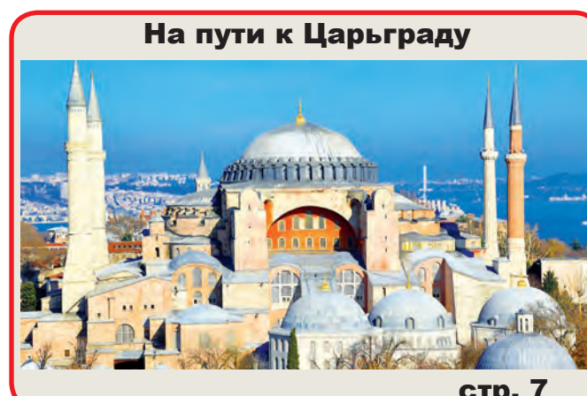
На пути к Царьграду