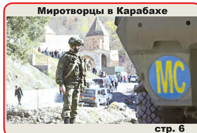
Миротворцы в Карабахе