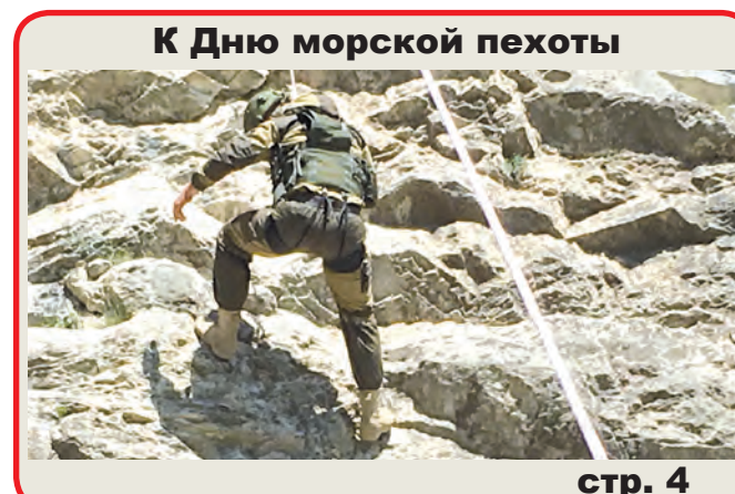
К Дню морской пехоты