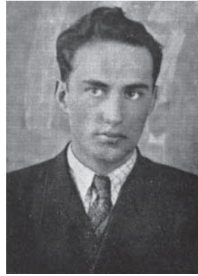
Осип Дяків (“Горновий”, “Гончарук”), сотн. УПА, нар. 21.VI.1921 в с. Олесин на Бережанщині, член Проводу ОУН та пров. Львівського краю від 1949, заст. голови ГС УГВР від 1950, автор брошур і статей; загинув у бою з МГБ 28.XI.1950 у Великополі Львівської обл.