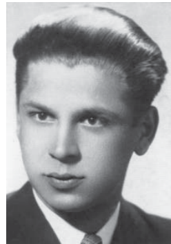
Петро Федун (“П. Полтава”, “Волянський”), май. УПА, нар. 23.II.1919 в с. Шнирів пов. Броди, провідний підпільний публіцист, шеф політично-виховного відділу КВШ УПА-Захід у 1944-46, ГВШ – від 1947, член Проводу ОУН від 1948, заступник голови ГС УГВР – від 1950; загинув у бою з МГБ 23.XII.1951 в с. Новосин Жидачівського р-ну Львівській обл.