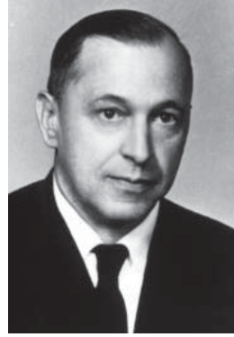
Іван Гриньох, отець, д-р, нар. 28.XII.1907 в с. Павлів Радехівського пов. на Львівщині. Співробітник РЗЗ при Проводі ОУН у 1943-44, другий віцепрезидент УГВР від 1944, голова ЗП УГВР, автор праць про УПА; помер 18.IX.1994 в м. Нарінг біля Мюнхену, Німеччина.