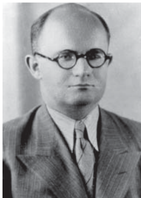
Павло Шумовський, нар. 18.VIII.1899 в с. Мирогоща Дубенського р-ну на Рівненщині. Викладач Варшавського у-ту 1927-38 та Львівської політехніки 1939-44, учасник ПВЗ УГВР; на еміграції викладач у Державній школі ветеринарії у Мейзон-Альфорті 1945-65, науковець; помер 27.I.1983 в Парижі, Франція.