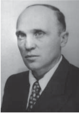
Микола Лебець (“Максим Рубан”), нар. 11.XII.1909 в с. Нові Стрелища на Львівщині. Урядуючий провідник ОУН/ОУН СД у 1941-43, керівник РЗЗ при Проводі ОУН у 1943-44, генеральний секретар ГСЗС УГВР від 1944, автор книг і статей про УПА; помер 18.VII.1998 в Пітсбурзі, США.