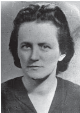
Дарія Ребет, нар. 26.II.1913 в Кіцмані на Буковині. Член Проводу ОУН 1941-45, член Ініціативного комітету для утворення УГВР, член Президії УГВР і ЗП УГВР від 1944, голова ПР ОУН від 1979, автор статей і діяч жіночого руху; померла 5.I.1992 в Мюнхені, Німеччина.