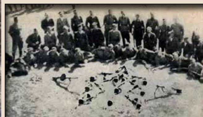
Чота УПА сотні «Полісся» при знигці. Із «фінок» (большевицька автоматична зброя) уложений тризуб