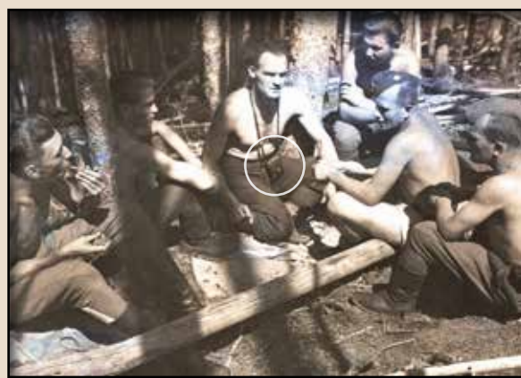
Фотоапарат – як і зброя – завжди з ним!