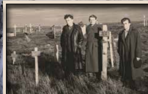
Інта. На поклін до померлих і заритих у вічній мерзлоті