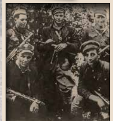
Неідентифіковані повстанці з Закерзоння