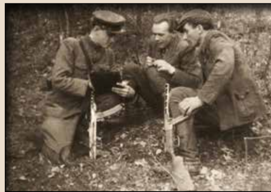
Неідентифіковані повстанці. Львівщина