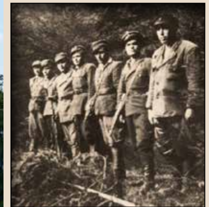
Неідентифіковані повстанці. Сколівщина