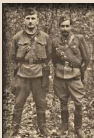
Головний командир УПА Роман Шухевич-«Тарас Чупринка» (зліва) та член Головного осередку пропаганди при Проводі ОУНР Осип Дяків-«Горновий»