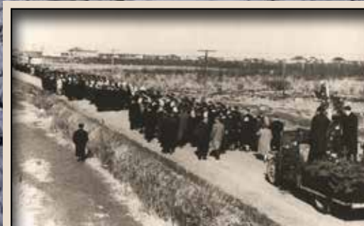
Інта. Похорон померлого побратима