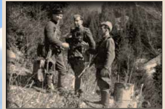
Зліва праворуч: сотенний «Грузин», чотовий «Верховинець», бунчужний «Гамалія». Весна 1947 р., с. Ялинкувате, Сколівщина