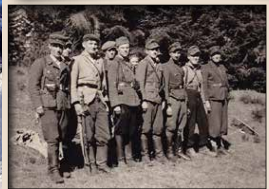
Група вояків УПА із Закерзоння