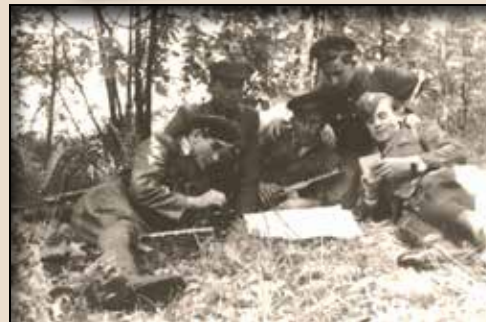
Неідентифіковані повстанці. Львівщина