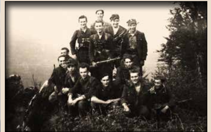
Рейдуюча група Могеста Ріпецького-«Горислава» покидає територію Лемківщини