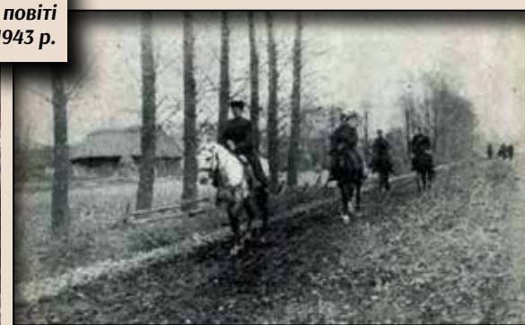
Кінна стежа маршуючого в глибині відділу УПА через с. Вовковию в Дубенському повіті на Волині (тепер Млинівський район Рівенської області)