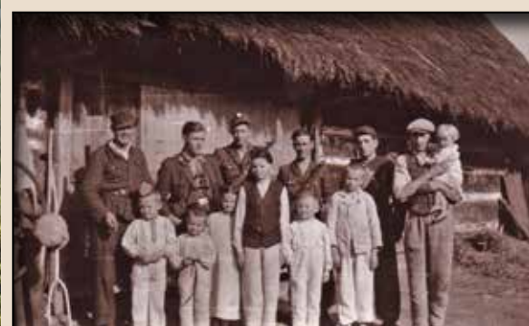
Другий зліва направо пров. ОУН Лемківщини «Мар» зі своєю охороною серед лемківської родини