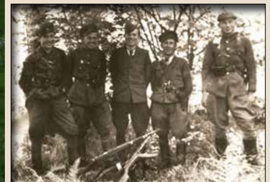
Неідентифіковані повстанці. Львівщина