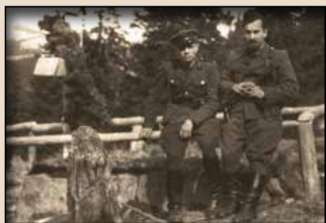
Неідентифіковані повстанці. Публікується вперше