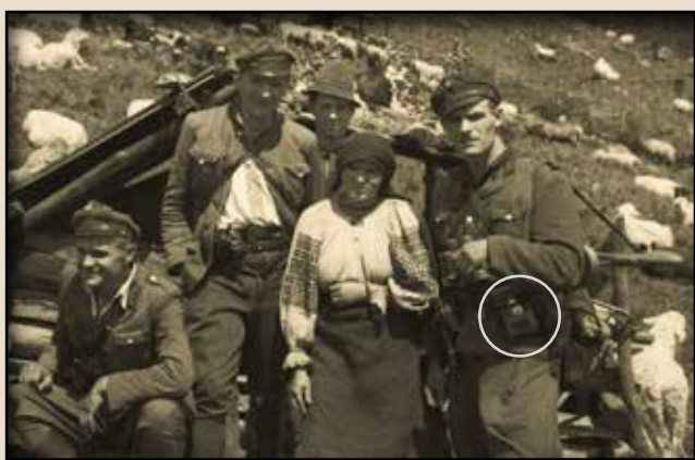
Румунія, червень–липень 1949 р.