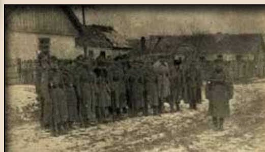
УПА-Північ: Відділ узбеків, що входив у склад УПА