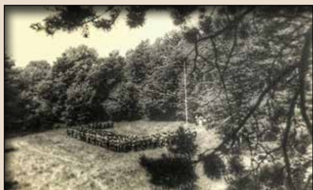
УПА-Захід. На святі присяги вояків старшинської школи «Олені» (21.09.1944)