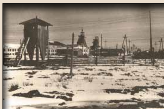
Інтинський табір політв'язнів – загальний вигляд.