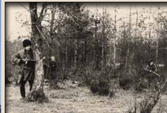
Повстанці в Суразьких лісах, 1943 р.