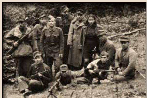
Повстанці з Лемківщини, 16.8.1947 р.