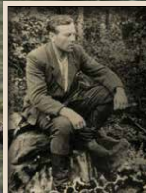
Курінний ТВ-22 Лука Гринішак-«Довбуш» від 1948 р. – референт СБ Надвірнянського надрайону