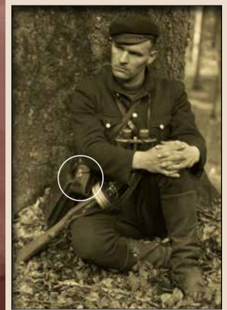
Фотоапарат Zeiss Ikon Nettar 515/2