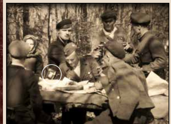
Великдень – 09.04.1950 р.