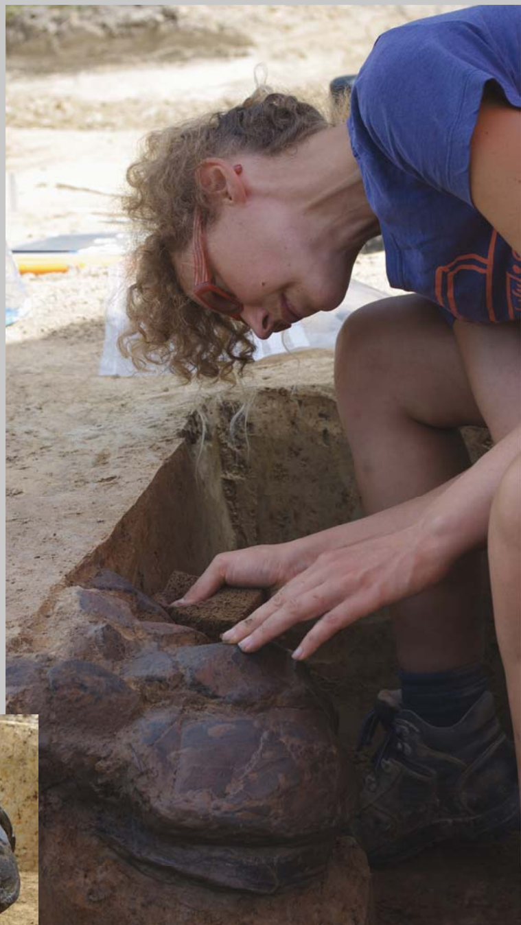
Foto boven : In één van de gebouwen troffen de archeologen een verlatingsoffer aan, in de vorm van verschillende intacte potten die omgekeerd opeengestapeld lagen.

De nederzetting was gelegen op de flank van de Mijlbeek op een vrij hooggelegen plaats in het landschap. Op vijf verschillende plaatsen vonden de archeologen de sporen terug van waar ooit houten woonhuizen waren opgetrokken. In de onmiddellijke omgeving van deze woonhuizen troffen ze ook voorraadkuilen ('silo's') aan en kleine houten gebouwtjes voor de opslag van goederen ('spiekers').