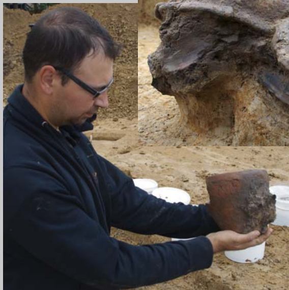
Links : sommige kuilen bevatten nog mooie fragmenten aardewerk zoals deze volledige pot.