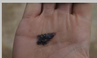
Links : prehistorische werktuigen uit vuursteen getuigen van nog oudere menselijke activiteiten op de plaats voorafgaand aan de bewoning.