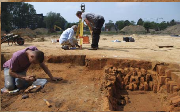
Achtergrondfoto : Middeleeuwse baksteenoven voor de bouw van het klooster. Insteek : Een team van het KMI neemt stalen voor archeomagnetische dateringen.

Tijdens de opgraving kwamen er maar liefst drie baksteenovens aan het licht. Twee van de drie daarvan hebben gediend bij de bouw van de abdij in de late middeleeuwen. De derde oven staat wellicht in verband met de heropbouw van het klooster. Door hun zéér goede bewaring zullen de ovens veel informatie opleveren over de baksteenproductie die hier heeft plaats gevonden (brandstof, grondstof voor de bakstenen, type baksteen, oventypes, stapelmethoden, ...).