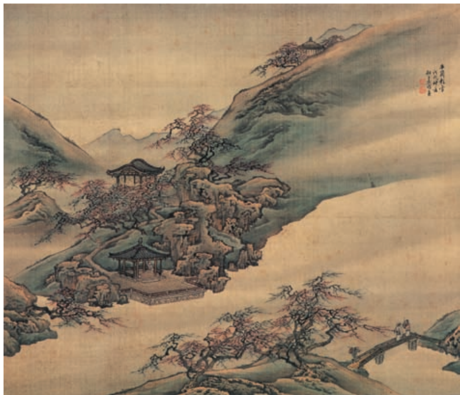
袁耀 扬州四景图册