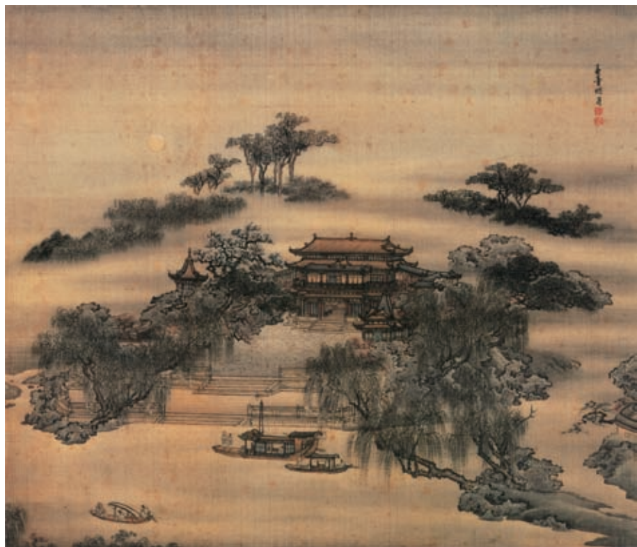
袁耀 扬州四景图册