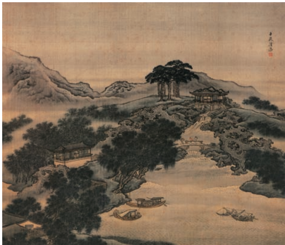
袁耀 扬州四景图册