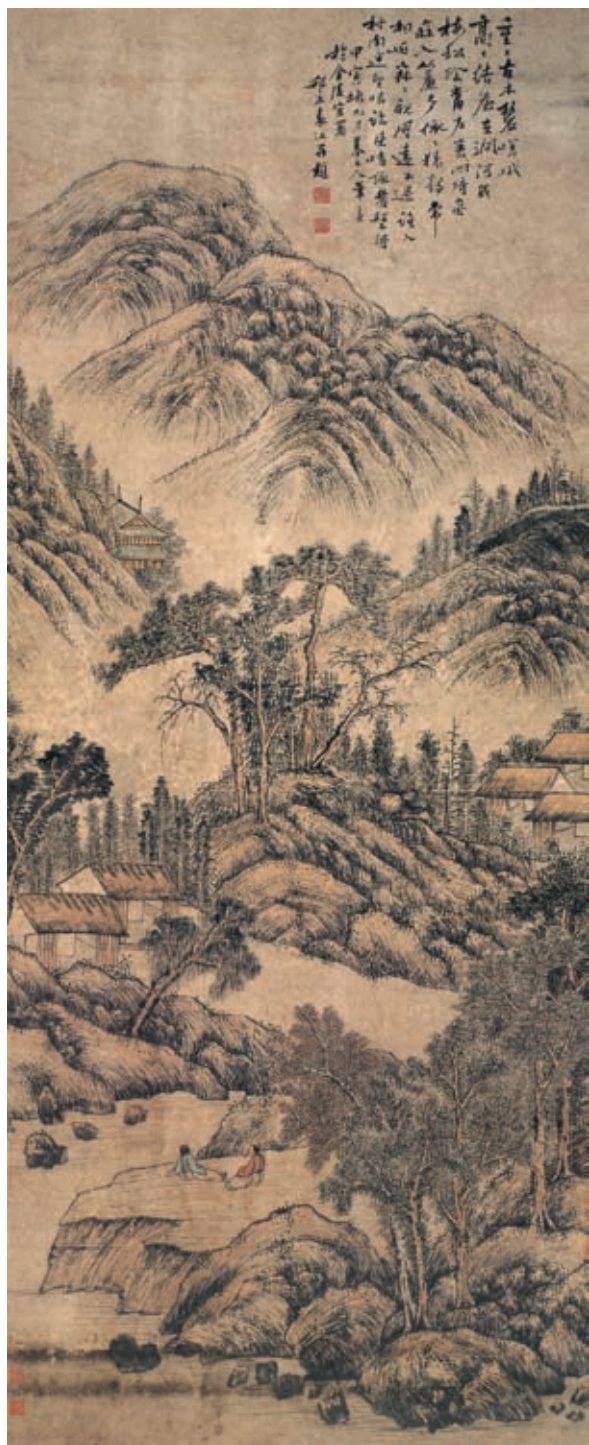
袁江 摹元人笔意山水