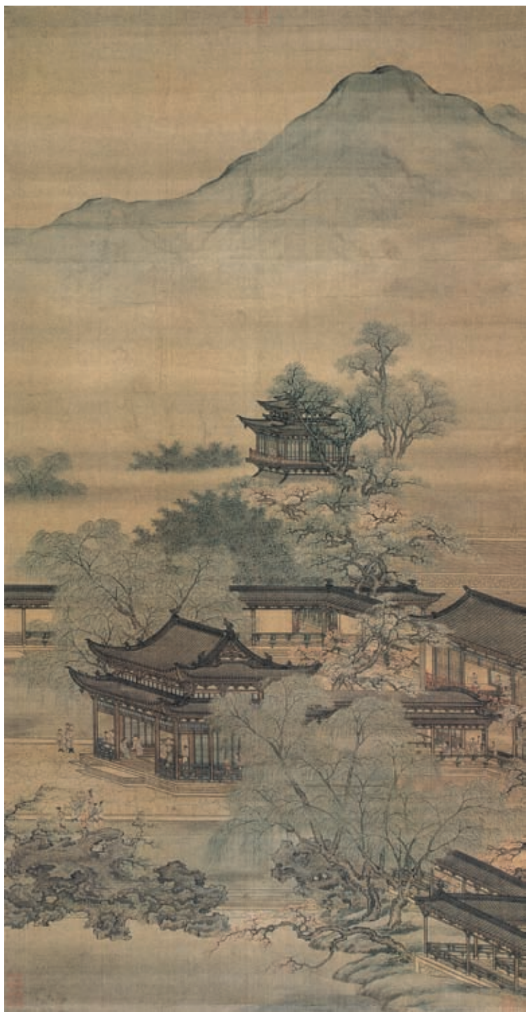
袁江 郭汾阳富贵寿考图