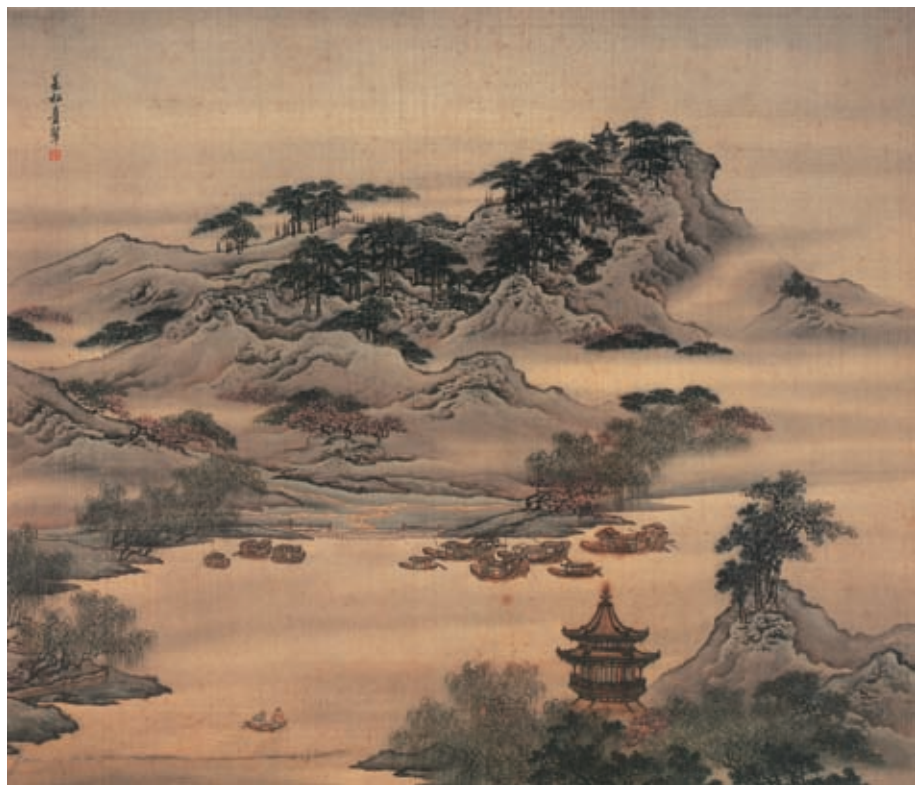
袁耀 扬州四景图册