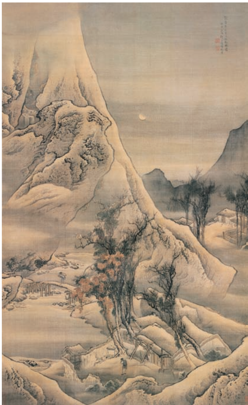
袁耀 温庭筠诗意图