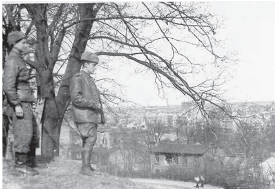
Воины 326-й стрелковой дивизии после взятия г. Данцига (Гданьск). Март 1945 г.