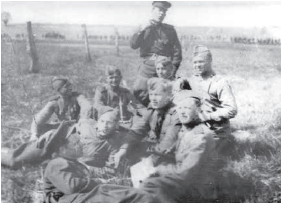
Группа разведчиков 326 сд.

пленного. Обнаруженная и обстрелянная пулеметным огнем пр[отивни]ка, отошла на исходное положение. Развед[ывательная] группа от 1097 сп вела разведку наблюдением в направлении Селюгино. Установлено: пр[отивни]к от Селюгино к Крапивинка ведет отрывку траншей и усиливает проволочное заграждение.