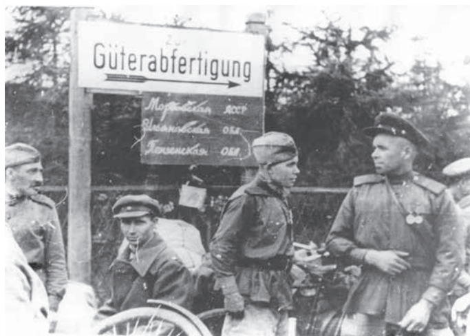
Солдаты дивизии из Мордовской АССР, Ульяновской и Пензенской областей перед отъездом на родину на погрузочной площадке для солдат. 1945 г. Германия. ММВТП