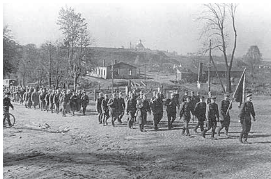
1099-й стрелковый полк под командованием майора Б. И. Елизарова вступает в г. Рославль

Войска Западного фронта, продолжая успешное наступление, форсировали реку Днепр и после упорных боев сегодня, 25 сентября, штурмом овладели крупным областным центром — городом Смоленск — важнейшим стратегическим узлом обороны немцев на Западном направлении.