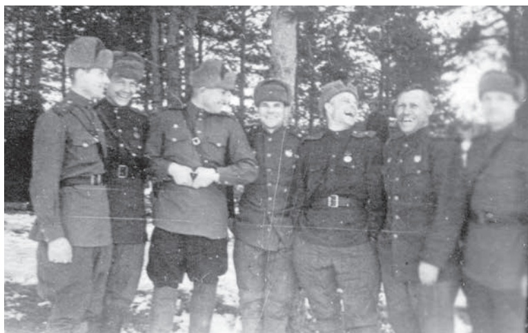
Офицеры 888-го артиллерийского полка. 1944 г.

2. Пр[отивни]к в течение суток вел руж[ейно]-пул[еметный] огонь по переднему краю нашей обороны и обстреливал боевые порядки частей методическим арт[иллерийским] огнем и ко-