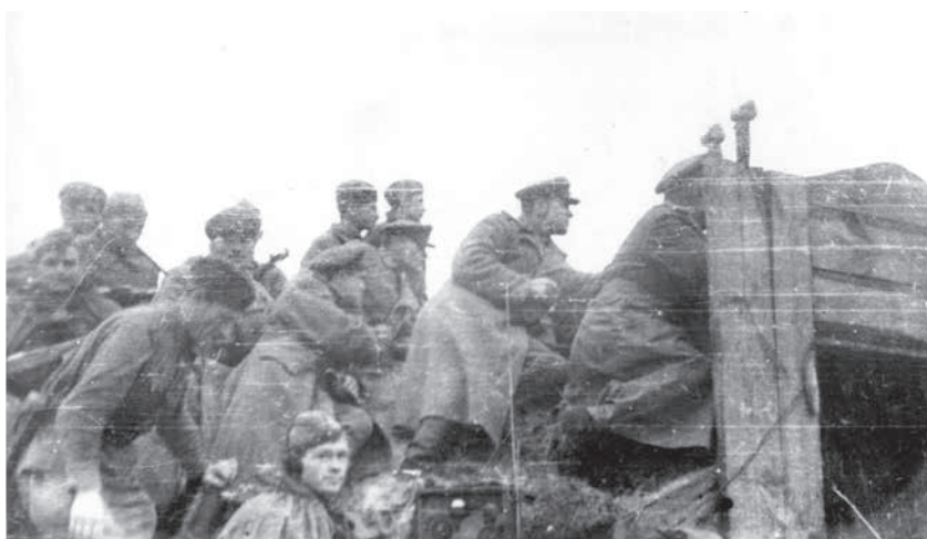
Воины 326-й Рославльской стрелковой дивизии под Псковом на командном пункте одного из стрелковых полков.

39-й о[тдельный] п[улеметно]-а[ртиллерийский] б[атальон] в р[айо]не своего расположения — Сухлово.