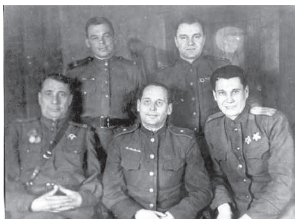
Командный состав 326-й Рославльской Краснознаменной стрелковой дивизии.

ЦАМО. Ф. 1639. Оп. 1. Д. 35. Л. 163 — 164. Рукопись. Подлинник.