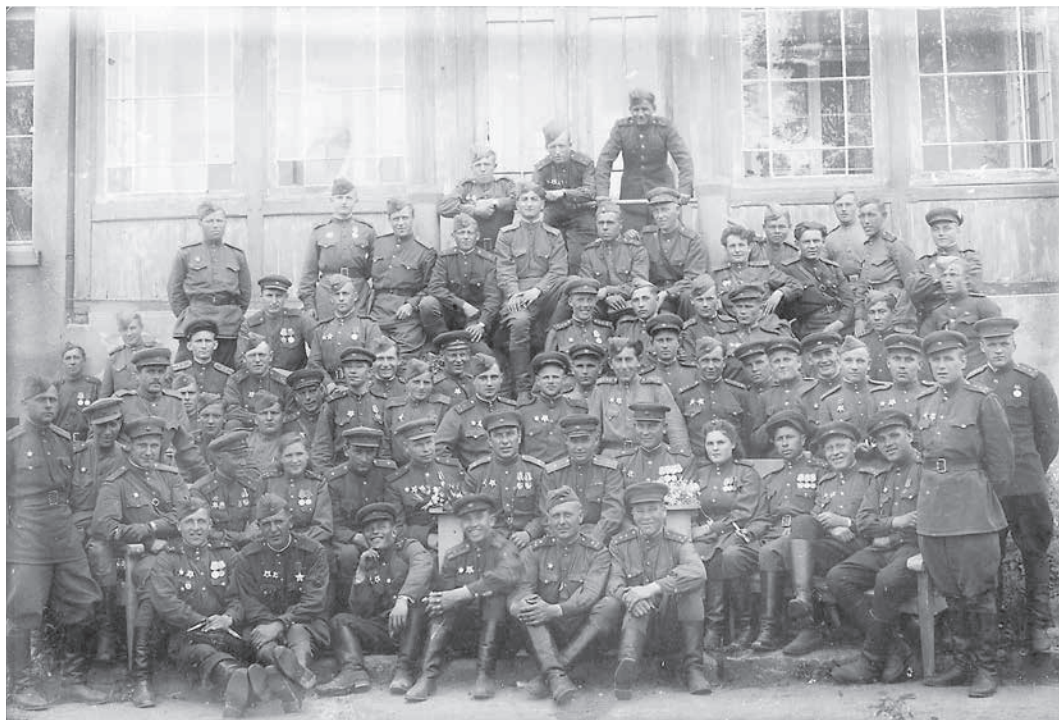
Офицеры и бойцы 326-й стрелковой дивизии. 1945 г. ММВТП

ЦАМО. Ф. 1008. Оп. 1. Д. 642. Л. 88. Подлинник.