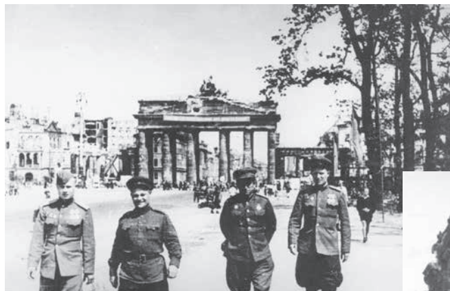
Офицеры дивизии после Победы в Берлине у Бранденбургских ворот. 1945 г. ММВТП