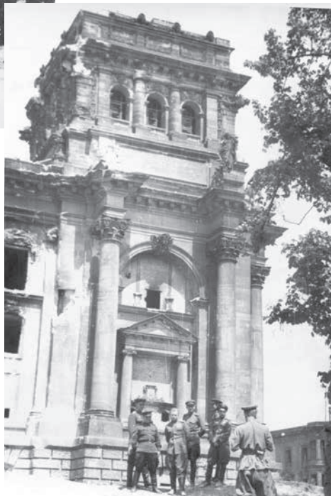
Офицеры дивизии в Берлине у Рейхстага. 1945 г. ММВТП