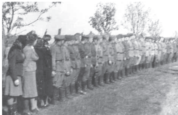
Торжественное построение личногo состава одного из подразделений 326 сд. Эстония. Тарту.

1. Части дивизии, выполняя поставленную задачу, вели наступательные действия, в ходе которых разбили группировку пр[отивни]ка СС «Гросс» в р[айоне] Эльва, овладели мес[течко] Эльва, с боями продвигались вперед и к исходу дня достигли: