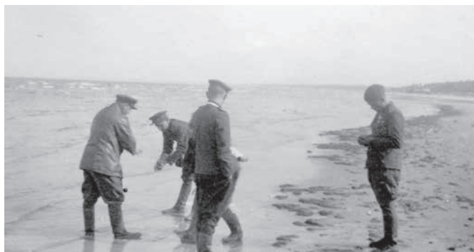
Бойцы и офицеры дивизии на берегу Балтийского моря. 1945 г.

8. Командирам частей на рубежах прикрытия организовать систему огня, обеспечивающую невозможность высадки десантов противником, и иметь постоянное офицерское наблюдение