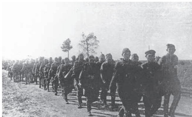
Стрелковый полк 326-й стрелковой дивизии после освобождения г. Рославля. 1943 г.

Части дивизии, достигнув рубежа р. Остер 20.09, встретили серьезное сопротивление противника. Но благодаря умелым действиям командиров, смелости и отваге бойцов, хорошо организованному взаимодействию пехоты и артиллерии, сопротивление противника 23.09