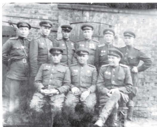
Командный состав 888-го артиллерийского полка. 1945 г. ММВТП