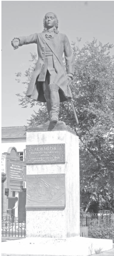
Памятник основателю крепости Кизляр генерал-аншефу В.Я. Левашову