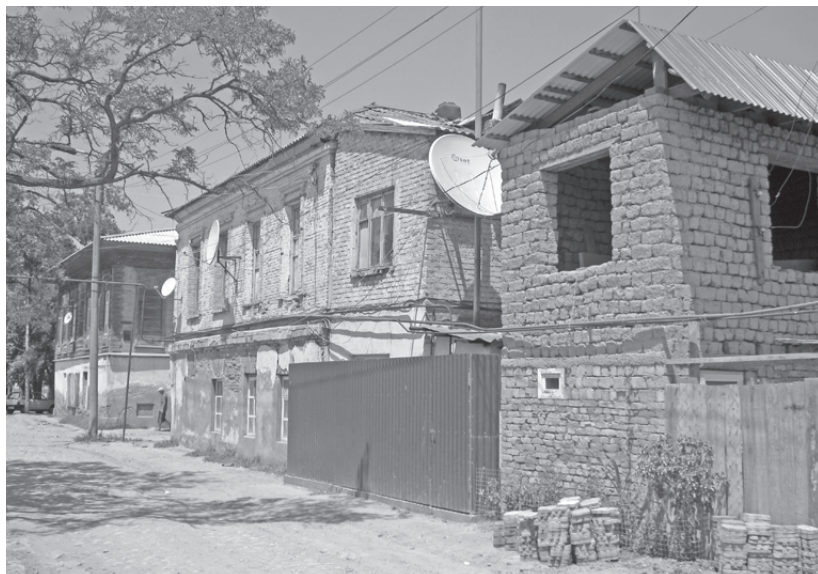
Улица старого Кизляра