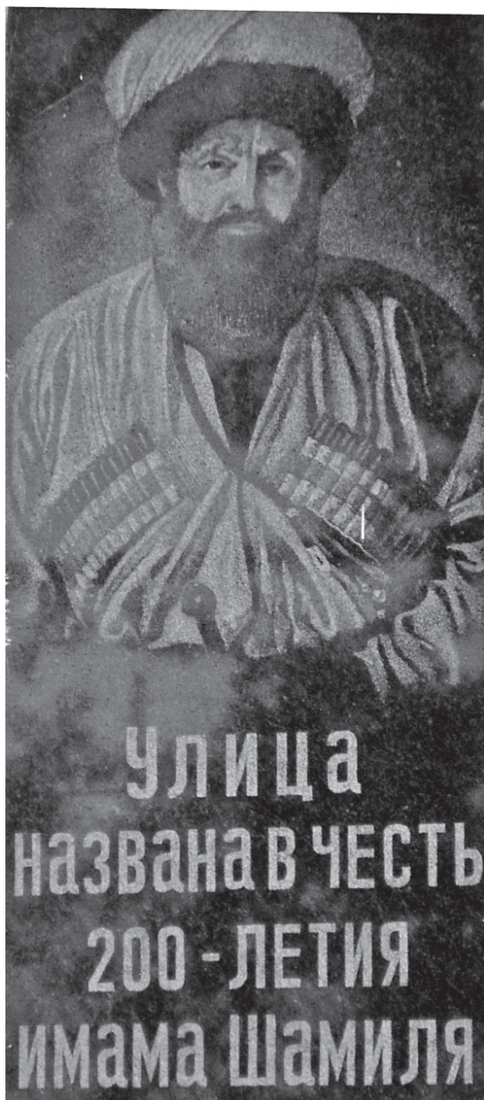
Мемориальная доска возле Джума-мечети