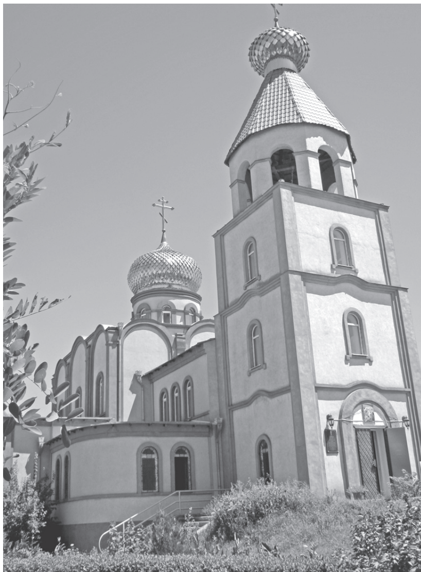
Церковь. Св. Георгия Победоносца