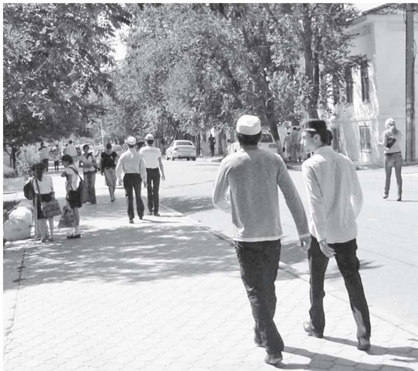
На главной улице города