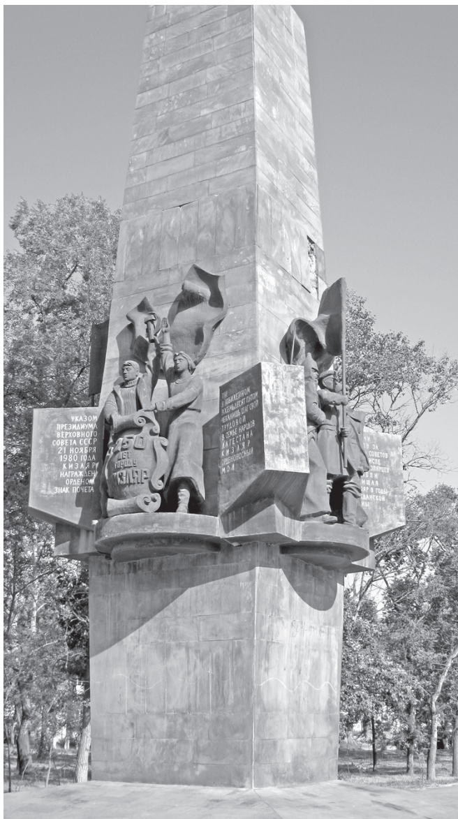
Памятник боевым и трудовым победам кизлярцев, сооруженный в честь его 250-летнего юбилея