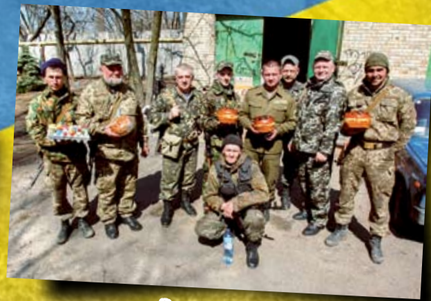
Закарпатські військові. Великдень 2015 р.