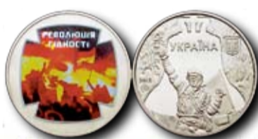
Монета "Революція гідності" присвячена громадянській мужності і патріотизму, які виявили громадяни України всіх національностей, прагнучи розвинути та зміцнювати демократичну державу, конституційні засади демократії, права і свободи людини.