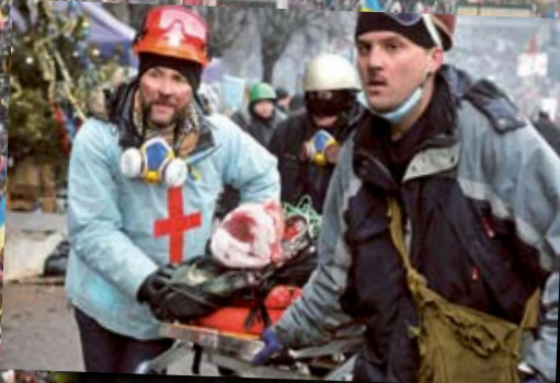
Медики-волонтери на Майдані, 2014 р.