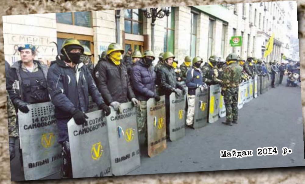
Майдан 2014 р.