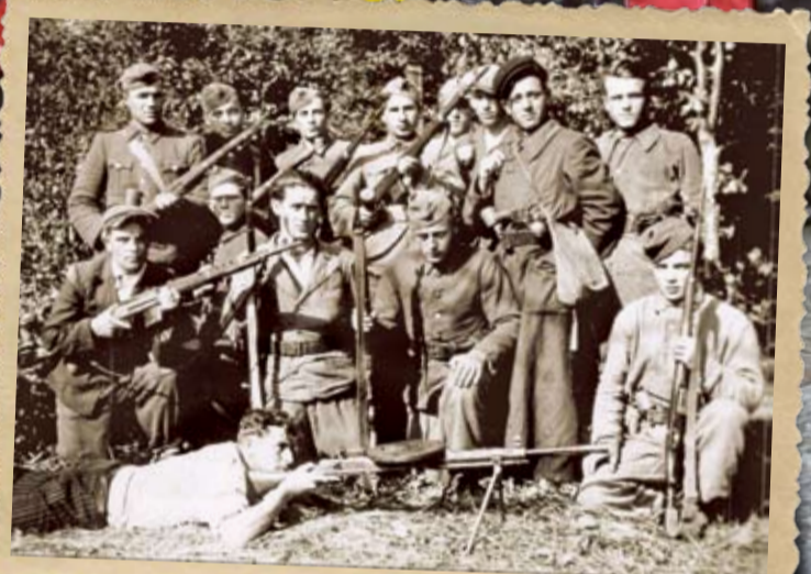
Новобранці сотні «Орли».