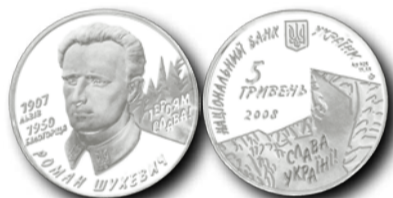
Монета "Роман Шухевич" срібна пропам'ятна монета серії «Видатні особистості України», випущена Національним банком України в 2008 році.