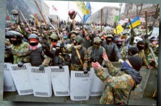
Майдан 2014 р.