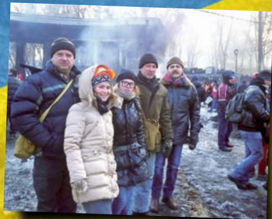
Майдан. 2014 р.