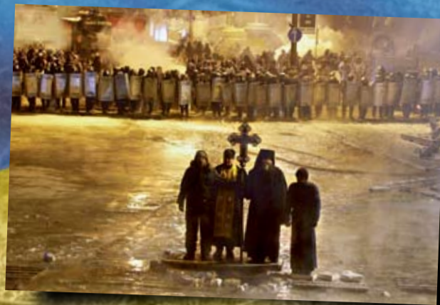
Майдан 2014 р.