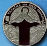
Монета "День захисника України" Лицева сторона