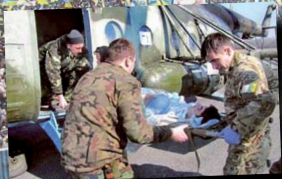
Лікарі 66-го військового мобільного шпиталю, 2015 р.