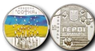
Монета "Небесна сотня" присвячена пам'яті героїв, які стали символом гідності, кожен з яких вчинив подвиг, повставши проти насилля та несправедливості, віддавши життя за нову, відроджену Україну.