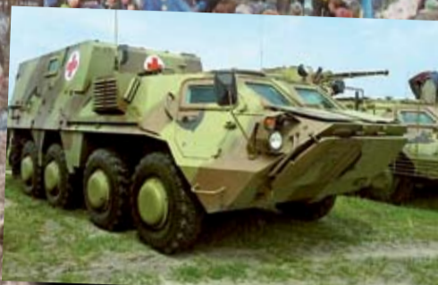
Броньована медична машина БММ-4С 8x8, створена на основі БТР-4