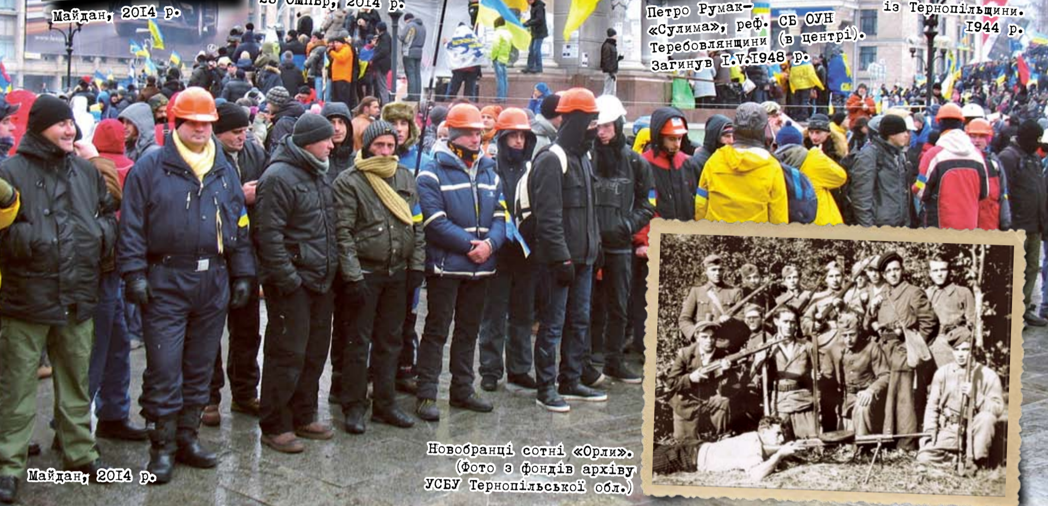
Майдан, 2014 р.