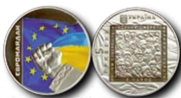
Монета "Євромайдан" випущена у пам'ять про протестні акції, що відбулися в Україні протягом листопада 2013 року - лютого 2014 року.