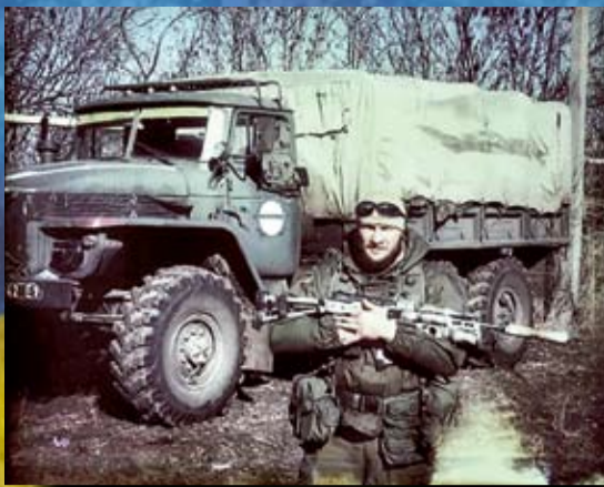
Спецпризначенець «Шаміль». 2014 р.