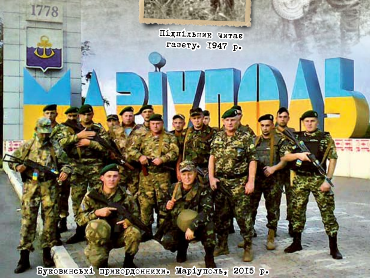
Буковинські прикордонники. Маріуполь, 2015 р.