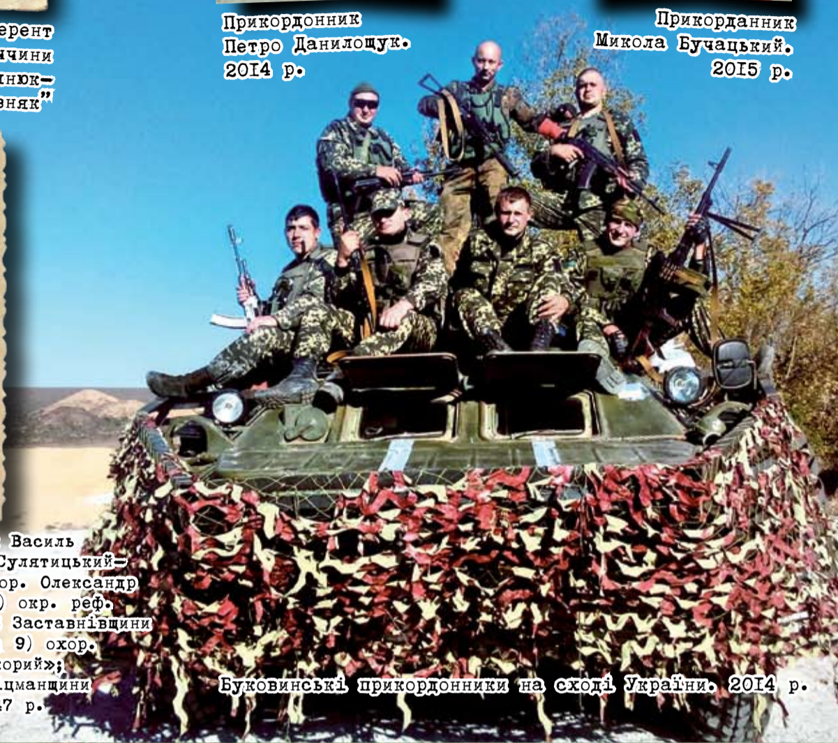
Буковинські прикордонники на сході України. 2014 р.