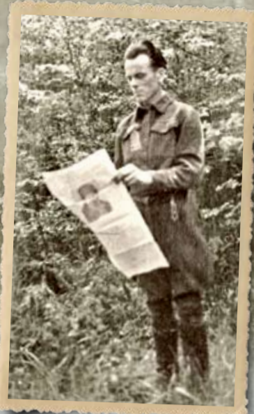
Підпільник читає газету. 1947 р.