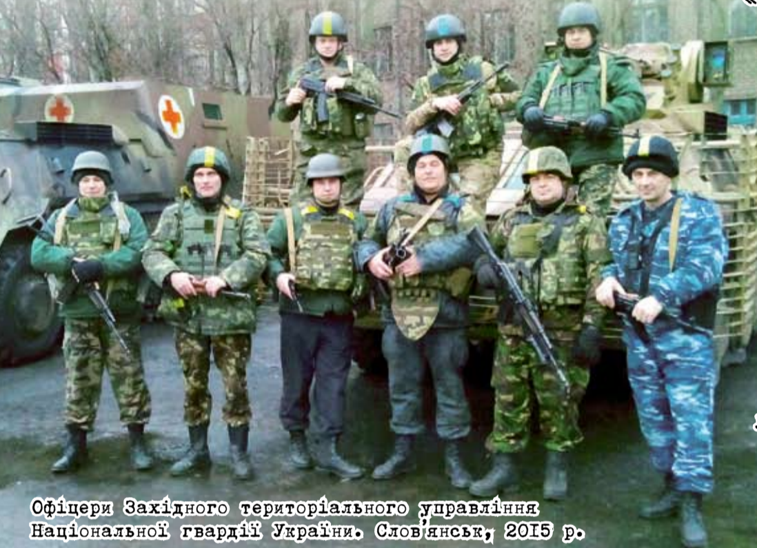
Офіцери Західного територіального управління Національної гвардії України. Слов'янськ, 2015 р.