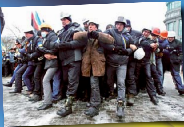
Майдан 2014 р.