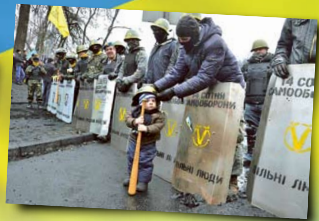
Майдан 2014 р.