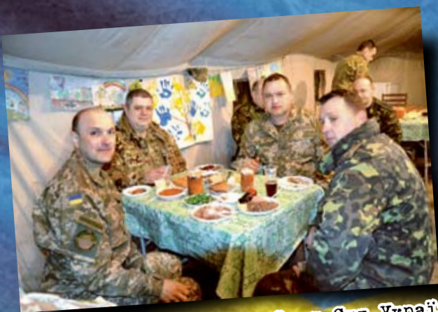
Військовослужбовці Збройних Сил України святкують Великдень. 12 квітня 2015 р.