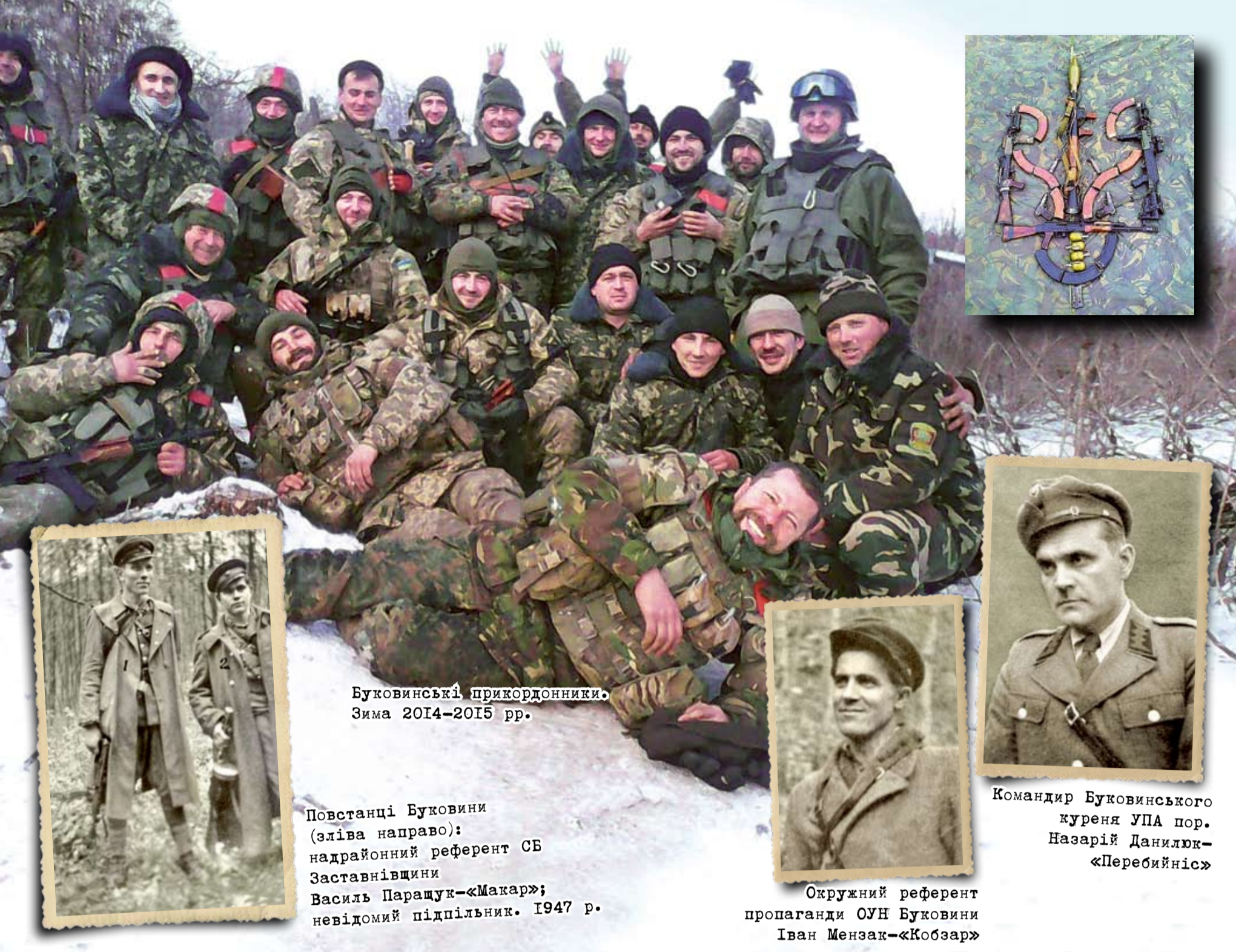
Буковинські прикордонники. Зима 2014-2015 рр.