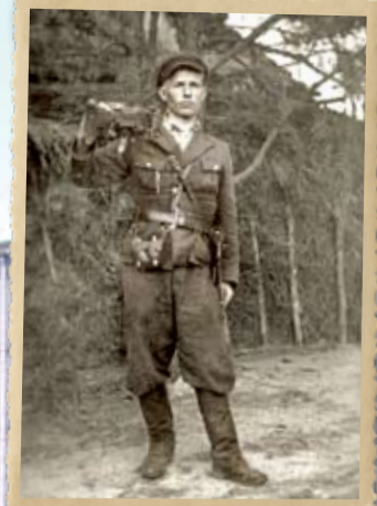
Повсталець-кулеметник із Тернопільщини. 1944 р.