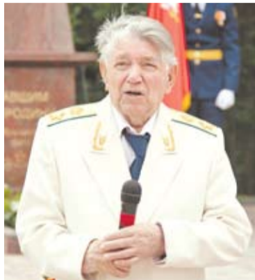
Выступает генерал армии Александр Сухарев

Торжественно открыть воинский памятник после реставрации было предложено трем ветеранам Великой Отечественной войны, среди которых был и звенигородец Б.И. Степанов.