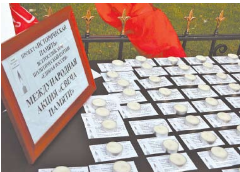
Каждый желающий мог взять свечу и принять участие в акции