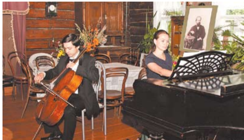
Конференция открылась произведениями учителя Танеева — Петра Ильича Чайковского