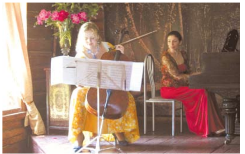
Лауреаты международных конкурсов на сцене Дома музыки в Музее С.И. Танеева

После стартового фотографирования туристы зашли в лес и по проторенным просекам, проптаным тропкам и заросшим тропинкам, по уже знакомому и хоженному не раз маршруту дошли до Дютькова, где в музее Сергея Ивановича Танеева должен был