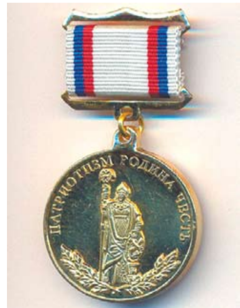
Медаль «Патриот России» Российского Государственного военного историко-культурного центра при Правительстве Российской Федерации.

— Как-то в нашей газете была заметка о том, что вы в один день дважды успели поучаствовать во встречах с ребятами.