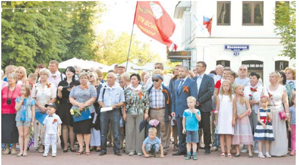
Почтить память павших воинов пришли звенигородцы всех возрастов