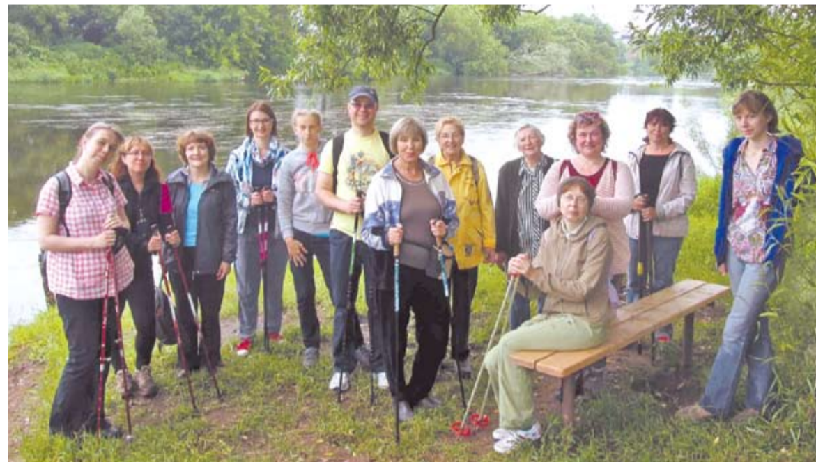
Привал на берегу реки Москвы

Миновав Игнатьевский мост и продолжая двигаться вдоль берега, туристы вышли к частной мини-ферме, где увидели живых павлинов (да-да, самых настоящих!), гусей, индюков, голубятню, пасущихся лошадей