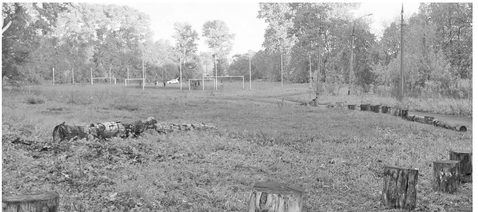
Экспертная комиссия должна будет определить, возможно ли построить на месте бывшего «Спартака» новый стадион

средства — кто сколько сможет. Итогом же ожесточенной полемики стало решение потребовать перенести дату аукциона и создать независимую экспертную комиссию, которая должна будет определить, возможно ли хотя бы теоретически построить на месте бывшего «Спартака» новый стадион.