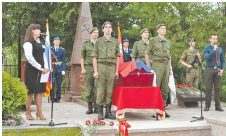
Церемония торжественного перезахоронения останков солдат, павших в боях под Звенигородом

20 июня звенигородские ветераны приняли участие в торжественной церемонии захоронения восьми неизвестных солдат Великой Отечественной войны, которая состоялась в селе Михайловское, расположенном неподалёку от села Каринское. В 1941 году здесь проходили ожесточенные бои на пути немцев к Звенигороду и Москве. Останки бойцов Красной Армии были обнаружены одиночным поисковым отрядом «Китеж».