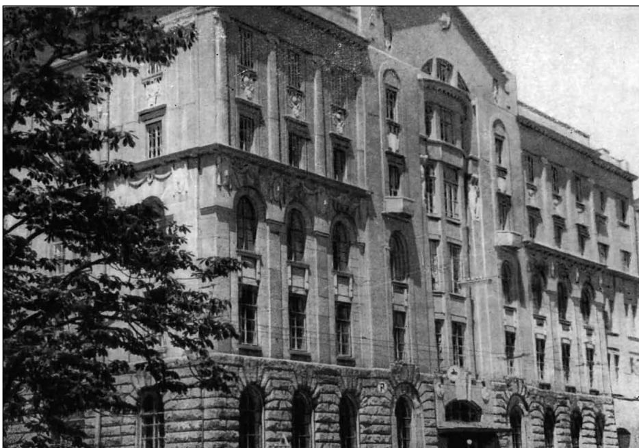
Первое здание Женского медицинского института (ул. Сумская, 1)

Сложными оказались переговоры об использовании городских больниц. Достигнутое к концу мая 1911 г. соглашение между городом и ХМО о допущении слушательниц ЖМИ в городские больницы для клинических занятий было приостановлено губернским начальством, поэтому ХМО было вынуждено заняться созданием собственных клиник. Взяли в аренду помещение для акушер-