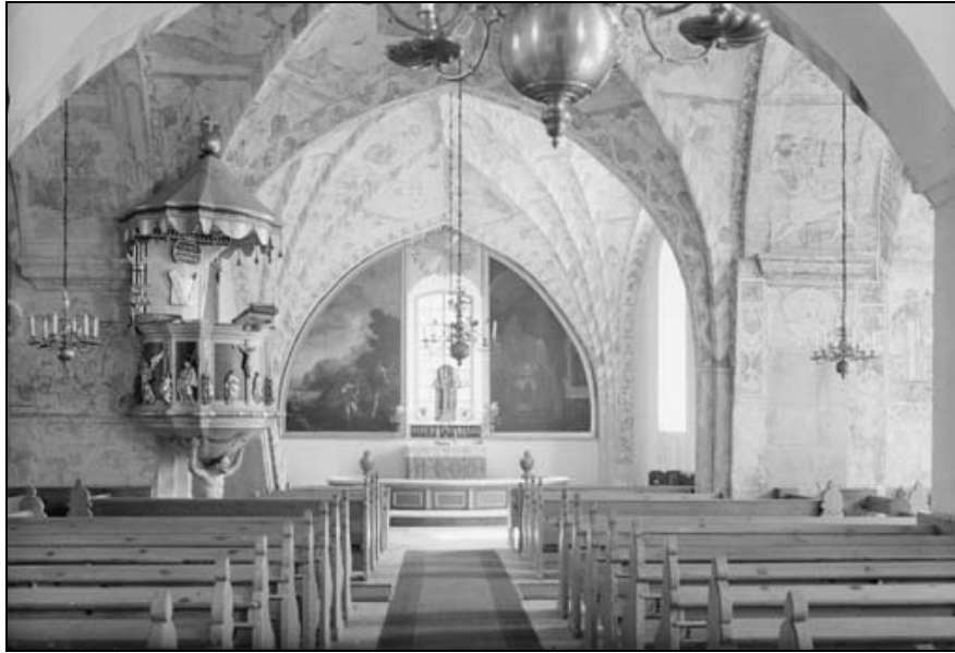
Vårdsbergs kyrka 1956.