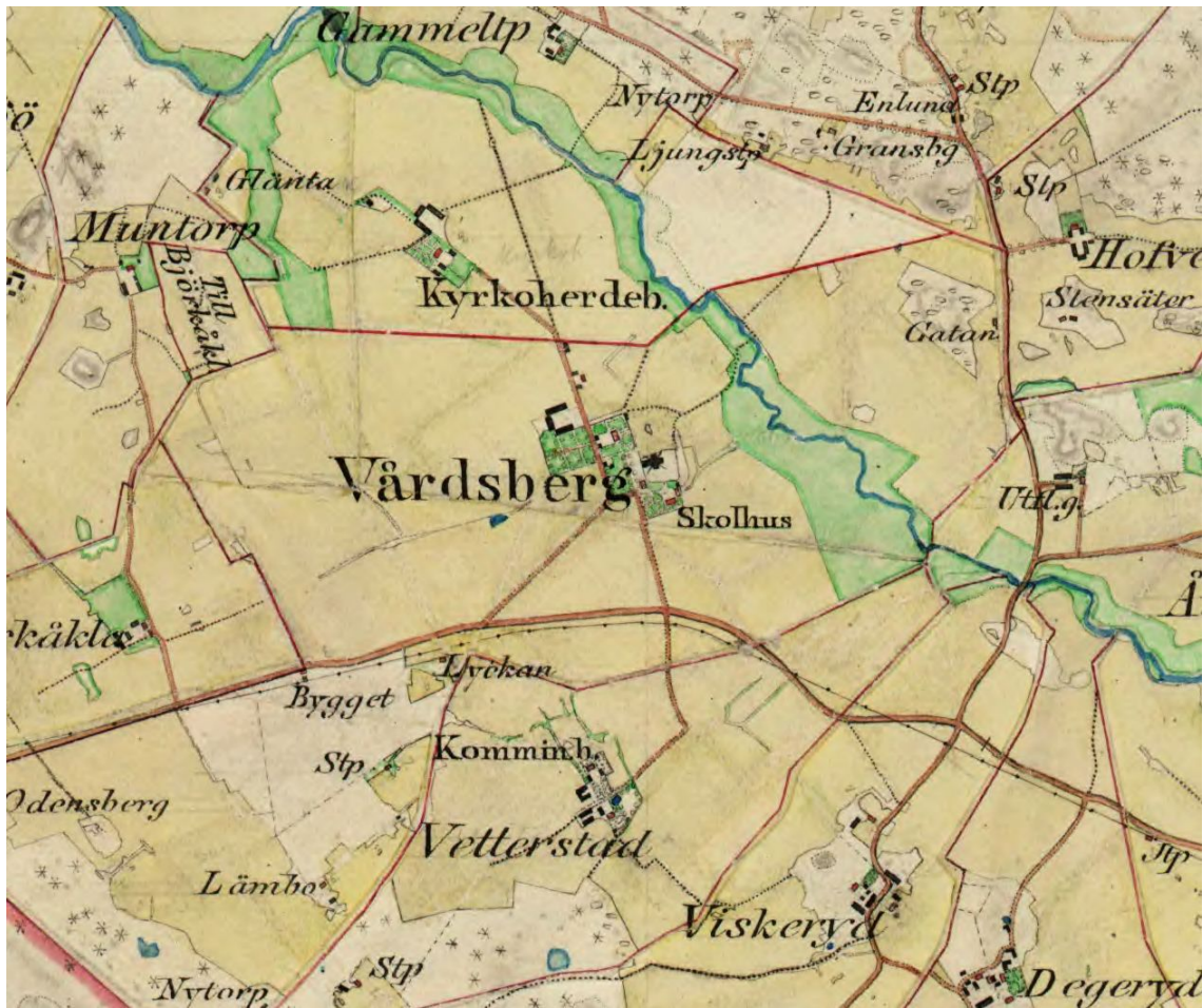
Vårdsberg på häradskartan från 1870-talet.