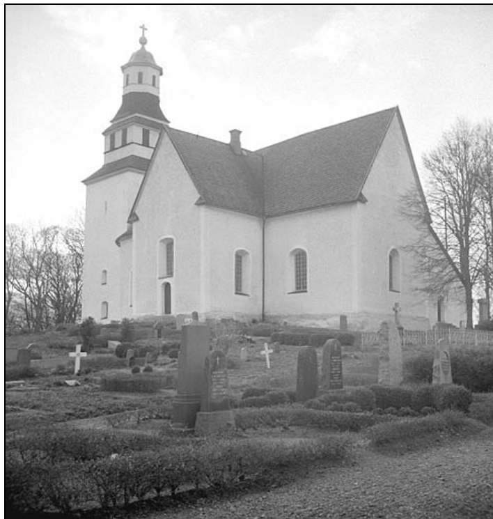
Vårdsbergs kyrka 1938

Den första kända kyrkan på platsen var sannolikt en träkyrka, vilket förekomsten av delar till tidigkristna gravmonument tyder på. Dessa tidiga kristna gravmonument består i sin mest utvecklade form av fem hällar – sidohällar, gavelhällar samt en lockhäll. De har framför allt förekommit i den västra delen av Östergötland, som faktiskt har den största koncentrationen i landet. Gravmonumenten med vikingatida ornamentik har satts i samband med kungs- och stormansgårdar. Sannolikt har de tidigmedeltida kungarna och deras närmaste män uppfört egna kyrkor och kyrkogårdar i anslutning till sina gods och gårdar.