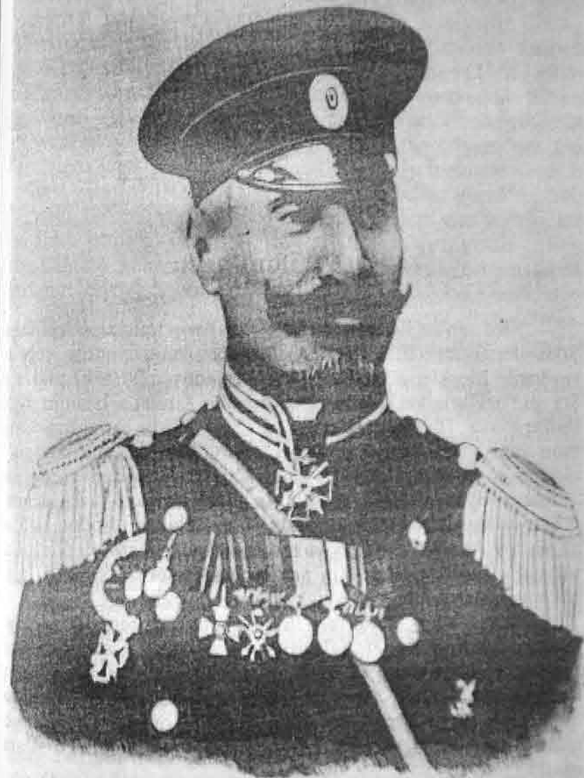
Кенерал-лейтенант Джигал Шихлински.