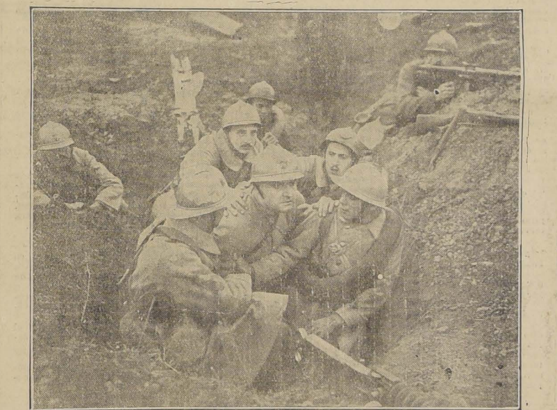
Cómo maté a mi hijo, está llamada. La obra se presentará con un pro-los teatros Setiembre y O'Higgins da por todo esto a un éxito resograma musical especialmente adaptado de la acreditada empresa chilena de teatro en las funciones del Martes, en Valenzuela Basterica.

La Casa Max Glücksmann, tras la serie brillante de sus estrenos de este año y después del gran número de éxitos obtenidos presentará muy en breve al público de Santiago su segundo acontecimiento del año 1926 en su sala principal del Splendid. Nos referimos a la obra "Para amar y honrar", un argumento insuperable del romance y la aventura que en muchos aspectos iguala y en otros tantos sobrepasa al inolvidable "Halcón de los mares". La bella muchacha y notabilísima actriz Betty Compson, al viril e intenso galán Bert Lytell y el simpático y arrogante Theodore Kosloff interpretan en este film grandioso los roles históricos de Lady Julia Leigh y Stuardo, Princesa de la Sangre en la corte real de Jaime I de Inglaterra, sir William Percy, ex-capitán de los soldados del Rey y famoso colono de la salvaje Virginia y el Lord Duque de Carmal, favorito del Rey y señor de los destinos de la Corte.