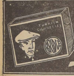
L. M. FIGARI & Cia. — ROSAS 1022.

En la mañana de ayer fundó en Valparaíso el buque-escuela "General Baquedano" que procede de Quintero, a donde llegó hace algunos días, poniendo término al viaje de instrucción del último curso de guardiamarinas.