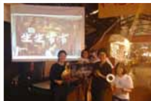
《生生市市》紀錄片快閃放映 會，鑼和鈸上陣。