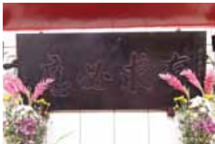
「有求必應」匾額，被視作有應公廟主要特徵。該匾上頭年代記庚申年。