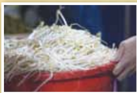
採收的豆芽菜裝桶準備進入