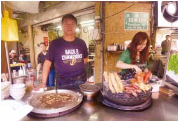
前前後後招呼客人，夫妻聯手顧事業。