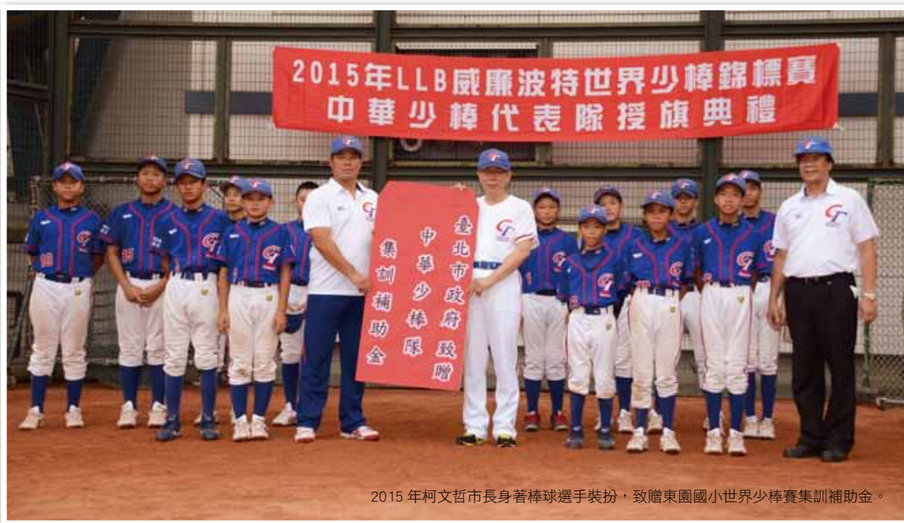
2015年柯文哲市長身著棒球選手裝扮，致贈東園國小世界少棒賽集訓補助金。