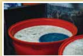
文芽的清洗過程（銀芽為去頭去尾的豆芽菜，需與一般豆芽菜分開，由人工清洗）。