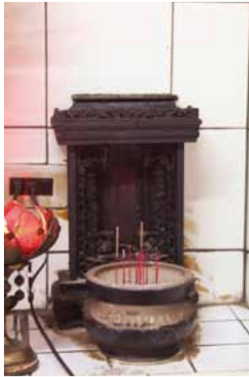
旁祀一般家中可見之祖先牌位，成為東園有應公廟裡的特徵之一。