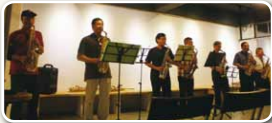
艋舺音樂祭；社區學習 - 記憶與回憶 - 老歌不老是懷念

常聽到有人說：我們的「教育失敗」。然而我們是不是也需要問一問：什麼是「教育成功」呢？我們社區大學目前的教育成功嗎？