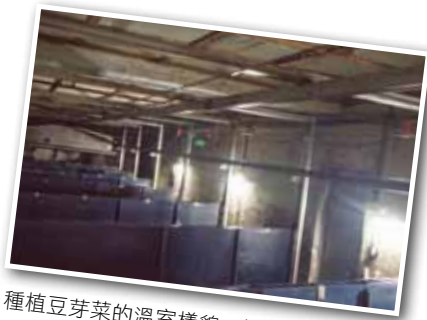
種植豆芽菜的溫室樣貌，以一天一隔間為單位做生產

豆芽菜常見於日常生活中，舉凡路邊的陽春麵、鐵板燒的配菜、潤餅的餡料都看得到豆芽菜的蹤跡。從整體市場需求來看，因為潤餅在傳統習俗上是一個重要角色，所以在1年之中，豆芽菜在清明與尾牙時期的需求最大，因此豆芽菜也有較大的交易量。而不同於其他需要種植於室外接受日照的蔬果，颱風時期的豆芽菜是少數免於災害的作物之