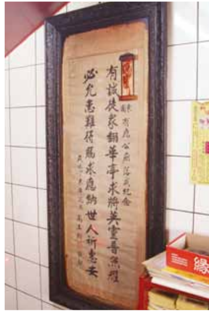
落成紀念文寫「有誠徒眾翻華亭，求將英靈普照耀。必允患難得賜求，應那世人祈惠安。」又記歲次為丁未年。