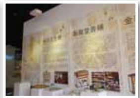
由在地「曉劇團」策劃的「艋舺人文地圖－漫步東園街」展覽。