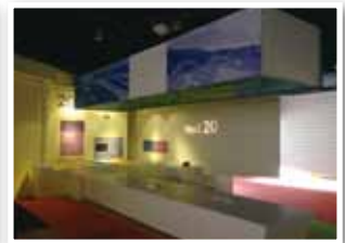
展場一（1946～1966）、二（1966～1986）、三（1986～2006）、四（2006～2026）。