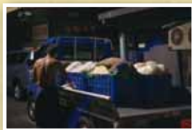
將洗淨的豆芽菜集中上車準備運往菜市場販售。