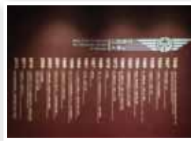
入口處的大事紀代表了情勢的轉折，變化即將發生。