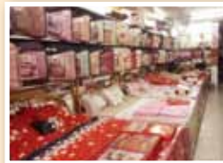
店內左右兩側商品擺設。