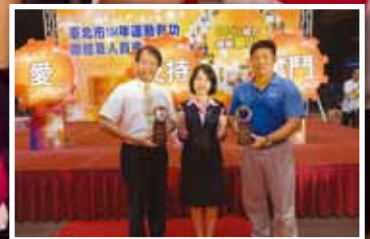
東園國小是唯一獲頒合北市體育特殊貢獻獎，這份榮耀實至名歸。