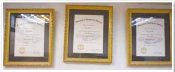
GIA A.J.P 專業珠寶家證書、香港珠寶學院翡翠鑒定高級證書

你若來到東園街，你若好奇問銀樓裡有什麼歷史性的見證，抬頭仰望，你就能看見那份光彩！