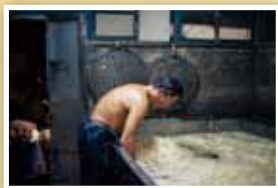
進行最後清洗動作的大池。

從豆芽這個看似不起眼的產業，連結至百業進發的現代，這不僅也透露著匆忙的生活步調，早已讓我們忘懷箇中的滋味與溫度，必須刻意停下腳步，才能覺察的微小改變，包含你的周遭鄰舍、社區裡、附近環境的更迭，你都留心了嗎？