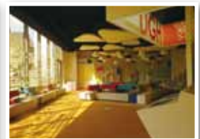
閱讀暨休憩區寬敞舒適。