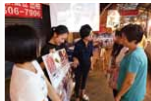
放映會上與居民互動。