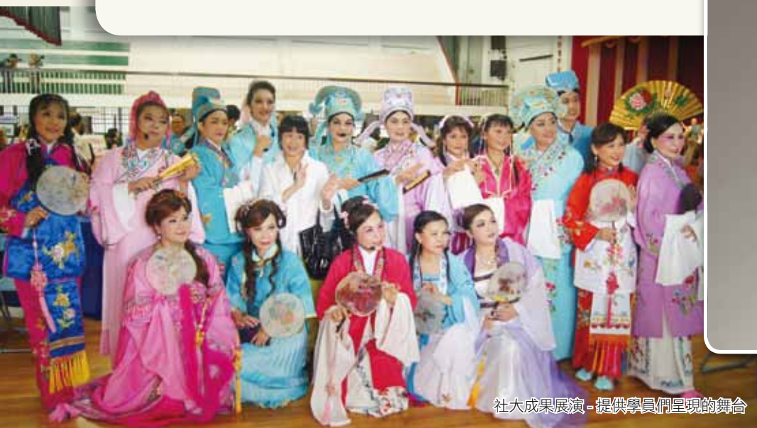
社大成果展演 - 提供學員們呈現的舞台