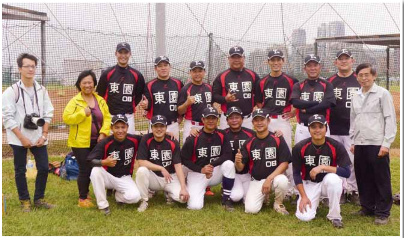
觀山棒球場完賽後，東園 OB 隊與萬華社大編輯採訪社學員合影。

有人會問後悔打棒隊嗎？我回答『永不後悔』！棒球是有趣的、迷人的運動，有時候會因一點突發性小事就讓比賽的流向改變。如果人生可以重新來過，我還是喜歡棒球。棒球運動可帶給我生理和心理正向的能量，除了增加肢體的靈活度，面對周遭各種