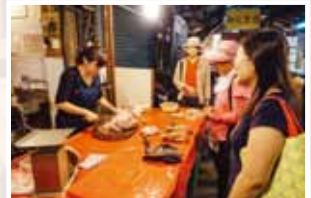
至傳統市場購買食材，與商家及 雞肉面對面。