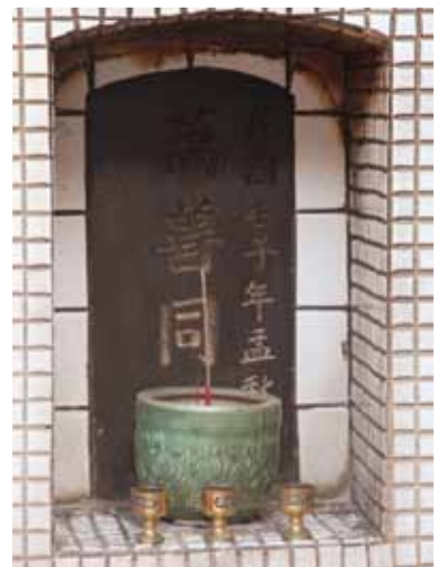
墓塚石碑牌位寫「萬善同歸」，記為「民國壬子年孟秋」。其廟裡奉看似更老舊的石碑，可推斷此應是後來所置。

知從何而來。據當地人說法，可能是家中無法祭拜因此將祖先請來安置，盼能持續接受香火，而大眾公廟本就具收容性質，造就廟裡特殊的祭拜景象。