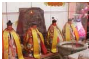
在舊有的石碑牌位前奉四尊有應公神像，即是對有應公進行形象化、神格化。