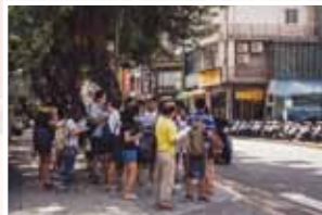
為「照護住居與社區」課程學生 導覽保德社區。