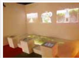
台灣島模型與光雕投影結合，介紹特色公路。