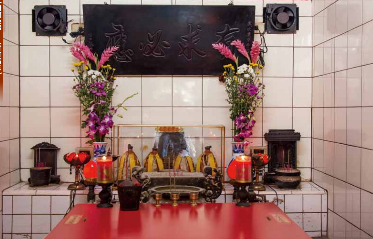
東園有應公廟內正面之景。