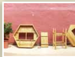
大桌的設計有緣由。