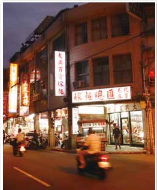
入夜後的大興嫁妝百貨行。

老闆娘回憶道，不論是三家電影院散場的人潮或是一天工作結束的傍晚，舊時店門前街道上總是人聲鼎沸、吆喝聚會的場景已不復見；電視機、錄放影機帶走了戲院觀眾，而萬大路、西園路與寶興街的拓寬開通將東園街原本熙攘穿梭的車流截斷而逐漸落寞。車流人潮不再，生意大不如前，更完全不敵於新興的網路與媒體廣告力量，只能靠老顧客的世代關照與口碑推薦維持。老闆娘感慨地說著，年輕一代沒有接手的意願，在可以持家及邊做生意有點收入的效益考量下，期盼著都市更新能夠再度風華聚榮，若無法兼顧時，老夫婦倆到最後也只能打算著停止營業店面轉租。