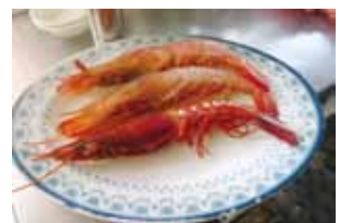
胭脂蝦、甜蝦，豔紅喜氣。