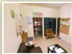
室內擺設簡單溫馨。