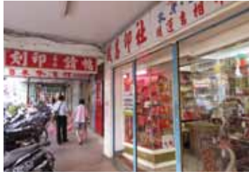
東園街的騎樓一景。