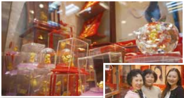
玲瓏滿目的金飾禮品 閃亮地點綴著店內