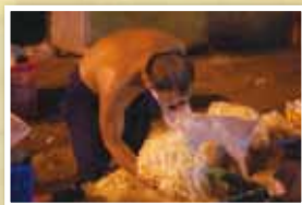
凌晨三點的市場販售。