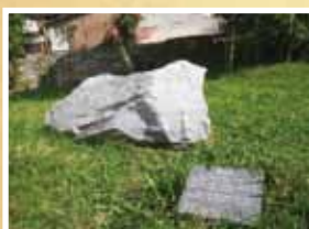
戶外的貫通石來自於觀音隧道，相傳會帶來好運。