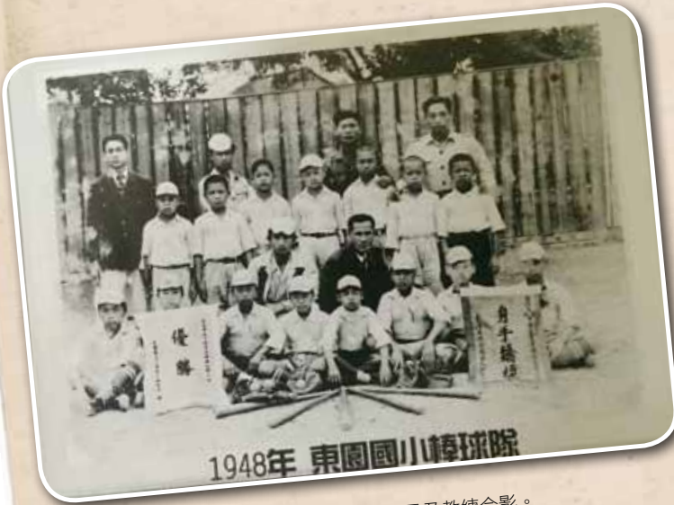
民國 37 年東園國小棒球隊的球員及教練合影。

黃先生於民國 76 年因病過世，後其夫人婉拒親友為她慶祝 80 大壽的美意，把節省下來的祝壽金捐出，希望以黃先生的名義為基層少棒盡點心力，我就建議主辦『勝求盃』少棒邀請賽，緬懷對黃先生的敬意。民國 96 年 8 月由東園國小來主辦第一屆，當時因為時間比賽匆促，來不及運作邀請更多的隊伍，將東園國小棒球隊分成紅、白隊兩隊，共有 30 位球員，總教練都是由我擔任。」