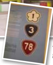
你認識道路編號嗎？