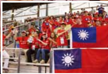
後援會及旅美僑胞齊聚威廉波特揮舞國旗，為中華隊小將加油打氣。