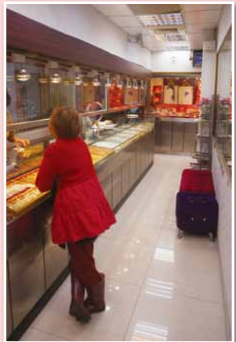
有別於一般銀樓，金華山在顧客區特地放了椅子

老闆在談笑間講到過去的案件時，似乎已經把它視為店面過去印象深刻的「回憶」了，而在這事件過後，老闆反而更希望未來客人們能直接進來店裡多坐坐，坐著聊、坐著找需要的飾品或珠寶，希望把人與人的關係從店家與客人的冷漠買賣轉變成彼此溫暖的朋友，就好像「距離不是美感，而是詮釋不堪一擊的信任」，老闆衷心的認為，人對人的熱情才是美感的來源，就好像東園街上傳統老店之間共同都有的溫度——熱情！