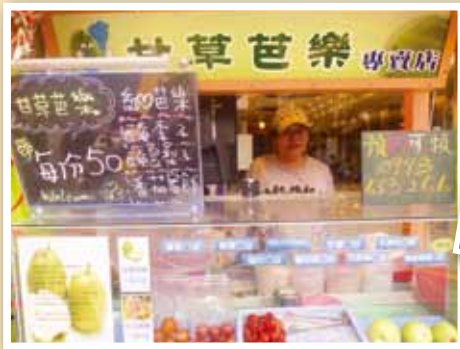
楊媽媽在復興口亭仔腳開設芭樂、番茄專賣店。