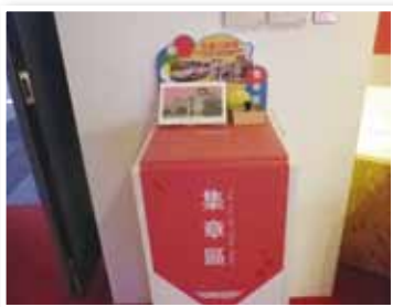
別忘了在館方提供的明信片上蓋上紀念章。

由於地形阻隔，花蓮向被稱為後山，1874 年羅大春領兵闢建的蘇花古道，隨地勢起伏，寬不及一公尺。1932 年改建臨海公路，長 100.5 公里，長期單線行車，向有死亡公路之稱。63 年開始分段拓寬，工期長達 16 年，之前路面只有兩條 40 公分寬的混凝土石板路，行駛其上既費時又危險。清水斷崖上壯闊的景色舉世無雙，很多人都有在管制站等候的經驗，金馬號客車擔任蘇花公路領頭羊的任務也為人樂道。在花蓮人「給我一條回家的路」的呼聲中，山區道路改善工程（簡稱蘇花改）正在進行，但面對漢本遺址的發現，工期勢必延長，見證了一百多年來對待軍事、經濟、環境乃至歷史的態度轉變歷程。