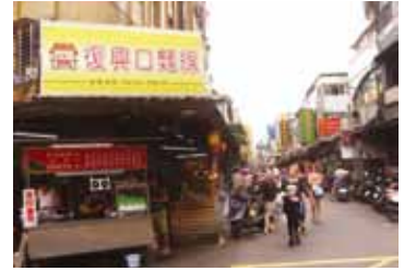
「復興口」是東園街著名的小吃巷。