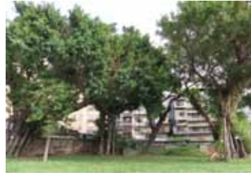
東園街上公路總局的老樹與防空洞。