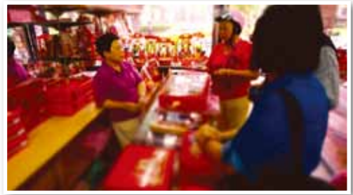
老闆娘與兩位「媽媽」、「婆婆」遠朋近鄰顧客閒話家常。

楊老闆一家原在當時一片麻竹筍田的寶興街楊聖廟附近從事農作，於民國 54 年因繁榮的東園街「店仔口」聚集人潮，才喬遷至現址經營嫁妝百貨總匯，親自服務遠朋近鄰嫁娶事宜。店內明亮深長的空間，商品擺設井然有序，各種婚嫁禮俗、彌月慶賀禮品、添妝用的居家寢具床組被套等家飾精品，與男士襯衫領帶皮夾用品皆一應俱全。老闆娘自信地說販賣的商品不僅少了百貨公司的上架費用，更多了品質口碑，親自來店比較後，絕對物美價廉不怕貨比三家。