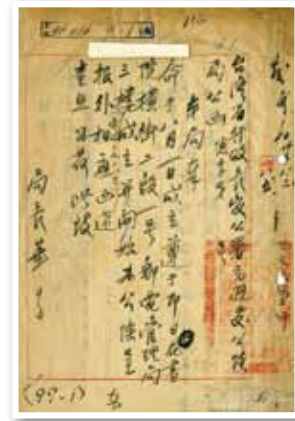
一紙公文等同出生紙。（◎公路總局，檔案日期 35 年 8 月 3 日，檔號 003516/9/3/001）

今日隸屬於交通部的公路總局，在 35 年成立之初稱作公路局，落腳在書院橫街 2 段 1 號（今長沙街），後遷往中正西路（今忠孝西路），土地是國有財產局向仁濟院租用的，一直沒有自己的家。因緣際會，終於選在結緣一甲子之久的東園街上入籍。