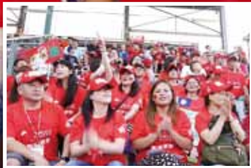
2015年獲得世界少棒亞太區代表權，前進美國威廉波特挑戰世界冠軍。