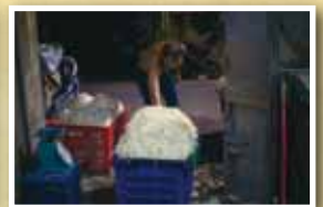
將清洗完的豆芽菜裝籃準備上車出貨。