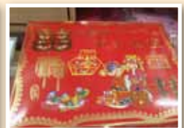
文定總禮盒與店家手寫訂婚用品明細表。