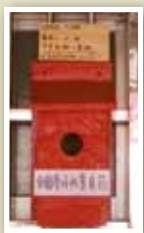
工作室的信箱是重要的溝通載具。

從保德公園旁，穿過短短的巷道，看到東園街社區規劃師工作室掛牌。房舍陳舊卻乾淨，小小的院落裡安置了六角形桌面的大桌，設計上取漢人入墾的6大庄頭作象徵，彷彿時時在等候客人來坐。加上壁面上香草瓶植栽及農具分享牆，充分表達了舊稱加蚋仔的南萬華曾是過去重要農業聚落的意象。