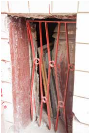
由墓塚旁可見存放之骨罐，又隱隱可見內有幾幀照片之相框。