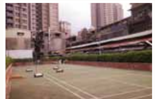
老市場基地在「臺北好好看」計 畫下改裝為簡易羽球場。