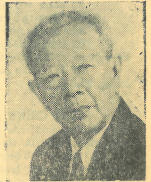
ỨNG CỬ VIÊN PHÓ TỔNG THỐNG Nhân Sĩ LIÊU-QUANG-KHÌNH

Ứng cử viên TỔNG THỐNG và PHÓ TỔNG THỐNG Việt-Nam Cộng-Hòa Pháp nhiệm I