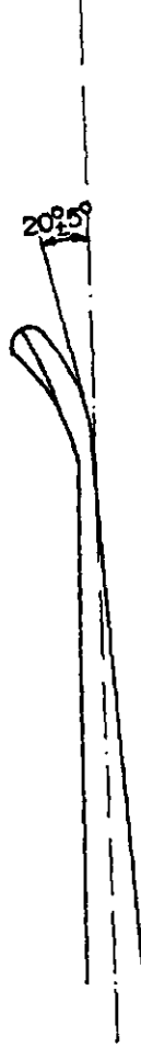
ŞEKİL 2 - Fonksiyonel Uç İle Boyun Arası Açısı