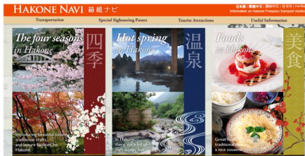
【箱根ナビ外国語版（現行）】