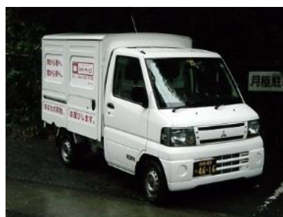
【箱根キャリアサービス運搬車両】