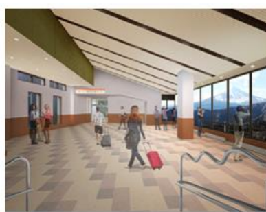
【箱根ロープウェイ 大涌谷駅待合室イメージ】