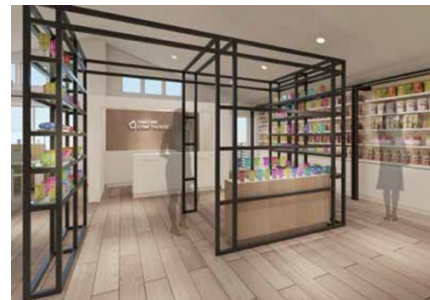
【お土産スポット イメージ】