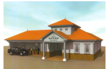
【箱根板橋駅イメージ】