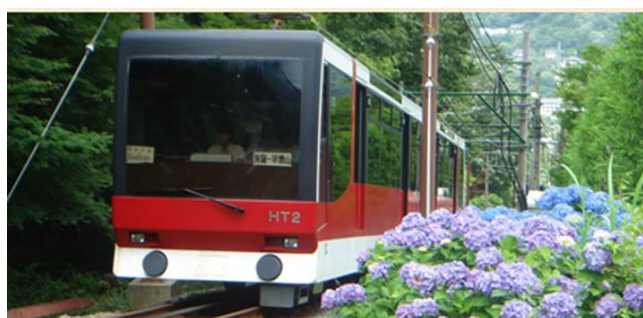
【箱根登山ケーブルカー】(現行車両)