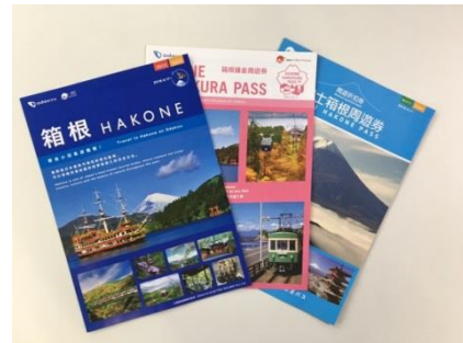
【各種多言語パンフレット（現行）】