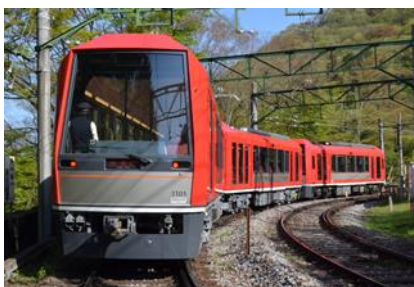
【箱根登山電車 アレグラ号】