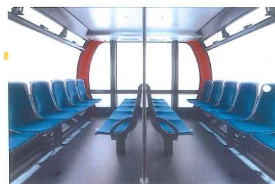
【箱根ロープウェイ 新型ゴンドライメージ】