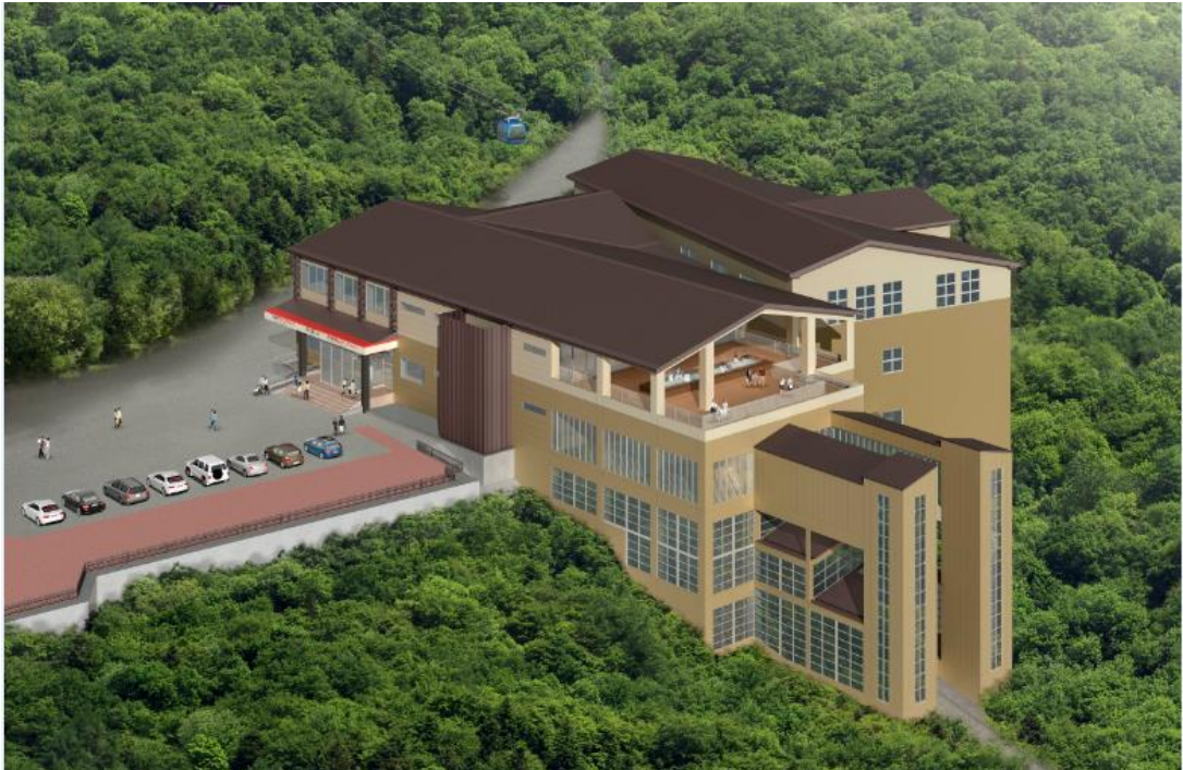
【早雲山 新駅舎イメージ】