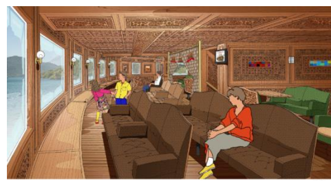
【箱根観光船 新型海賊船イメージ】