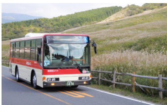
【箱根登山バス】現行車両