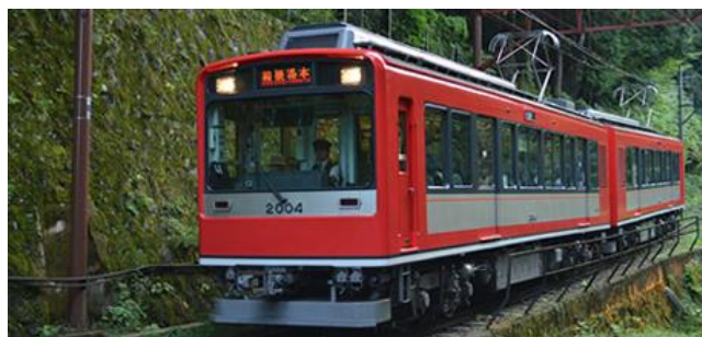
【箱根登山電車 2000形】(現行車両)