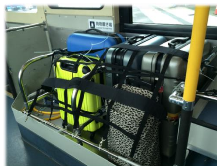
ラゲージスペース(イメージ)