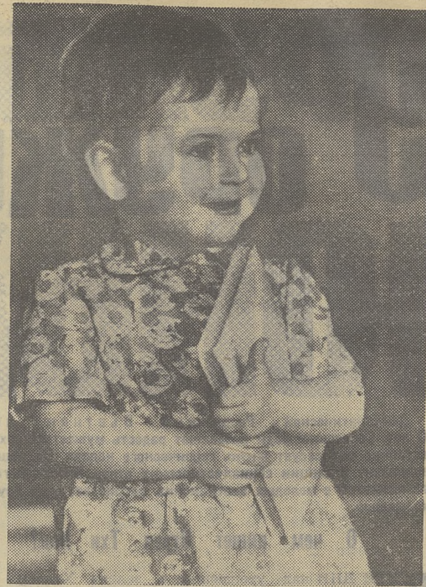
ТОЛЬКО НА ПЯТЕРКИ.