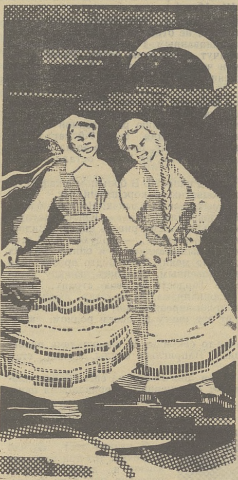
ЧАСТУШКИ. Рис. В. Марьина.