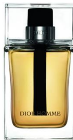
DIOR Dior Homme