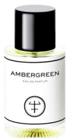
OLIVER & CO. Ambergreen