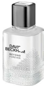
DAVID BECKHAM Beyond Forever