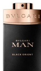
BVLGARI Bvlgari Man Black Orient