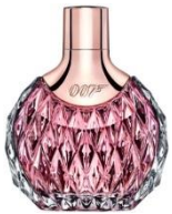
JAMES BOND 007 for Women II