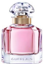
GUERLAIN Mon Guerlain