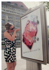
CHANEL Coco Mademoiselle