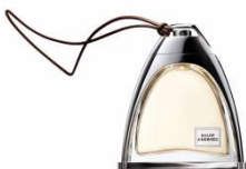
HERMÈS PARFUMS Galop d'Hermès