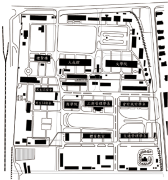
圖 1 1967 年光復校區平面圖。

理就這樣被壓印於校園之中。事實上1970年代初期學校怎麼使用光復校區，基本上也就決定了今日光復校區的空間分佈，包括體育空間、管理學院、規劃與設計學院、文學院、行政中心、學生宿舍等等（圖1、圖2）。