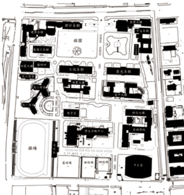
圖 2 當代光復校區平面圖。

是的，今日的成大光復校區，就是建立在日軍臺灣步兵第二聯隊的原有營區中。1966年，在那個資源不如今日的時代，所有房產都是物盡其用。而成大畢業紀念冊中老早就出現大成館（今工設系館）、文學院（今歷史系館）、榕園的照片，是師生們喜歡的空間（照片3）。當時的師生們或許不那麼清楚光復校區的歷史，但一知半解之間，反而為光復校區帶來許多鄉野傳說的樂趣。總是會聽到學長姐們傳言校區內哪裡不乾淨，哪裡有靈異事件發生。把原有空間一一釐清之後，這些樂趣倒是就消失不見了。而意識形態問題，原本就不是什麼太重要的問題，根本乏人討論。