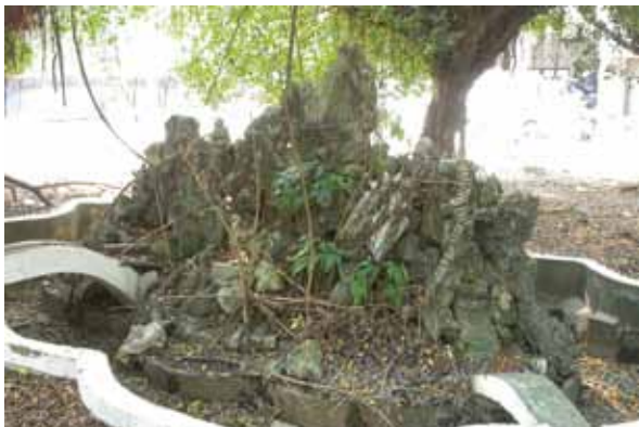
照片 4 已遭拆除的力行校區 804 醫院時期的毋忘在莒水池。