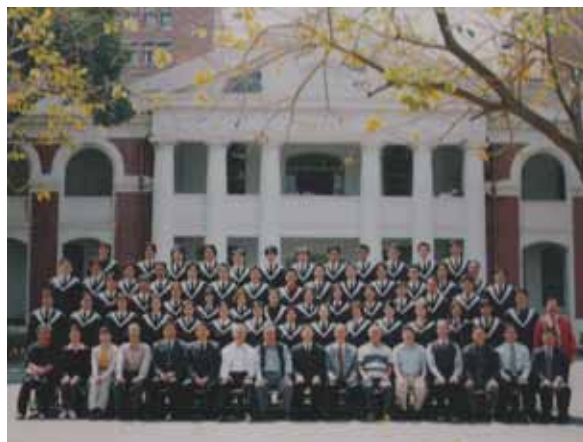
照片 7 91 級建築系在大成館前拍攝畢業合影。

因過去人的建設、保存，當代人才得以繼承、使用這些空間、場所。《成功大學光復與力行校區前身：原日軍臺灣步兵第二聯隊營舍及臺南衛戍病院》一書，只是盡可能整理兩校區的前身在日本時代的發展脈絡，以及古蹟群的建築特徵。期待對於兩古蹟群有興趣的人，可以從中得知部份建築往事以及建築特色。