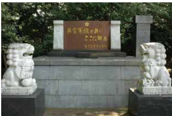
照片1 位於熊本護國神社的臺灣步兵第二聯隊軍旗碑。

從建築技術史的角度，兩個古蹟建築群無疑具備時代性的文化資產價值，是日軍因應臺灣氣候條件所完成的建築創作。因此，純粹從建築技術史的觀點，基本上可完全避開那些剪不斷理還亂的意識形態問題。但寫作過程基於資料收集需要，印象中似乎在靖國神社，不經意遇到一位日本右派人士向本人表達臺灣在日本統治時期多麼美好的觀點。2007年，也曾經前往熊本護國神社，拜訪臺灣步兵第二聯隊軍旗灰飛煙滅後被收藏的處所，獲得神社人員熱情的招待（照片1、照片2）。由於本書對於兩個古蹟建築群的價值的確多為正面表述，無可避免仍需面對這些意識形態問題。