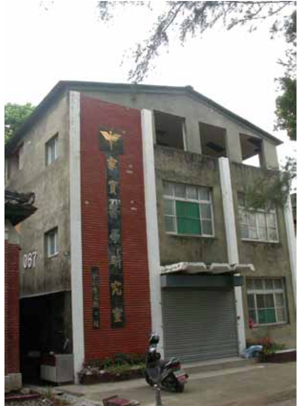
照片 5 2005 年拍攝原 804 醫院家寶醫學研究室照片。

所有的當下均繼承自過去，光復校區何以成為現況是如此，力行校區亦是如此。對於過去的好奇心，是人類與生俱來的天性，總是知道過去，才有可能理解現狀何以成為現狀。這個好奇心，促使文化資產保存產生意義。因為唯有實體的存在，才能自明性的敘述過去發生的種種事情。成大校本部何以可以獲得這麼大的校地面積，乃是國軍一一離開今日成功校區周邊營區後的結果，而國軍營區中的光復營區與804醫院，就是繼承自日軍的臺灣步兵第二聯隊營區與臺南衛戍病院。日軍仍是繼承清代將臺灣府城東北角作為軍事訓練基地的空間紋理。光復校區內的臺灣府城小東段殘蹟，在