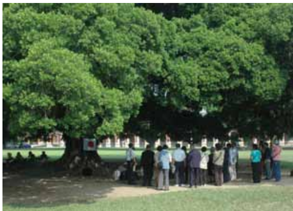
照片 6 2008 年 10 月 30 日，日本戰友會遺族在大榕樹下舉行弔祭儀式。

1937年臺灣步兵第二聯隊曾前往中國參戰，1942年以後臺灣人也開始加入作戰行列。戰後成立的臺灣步兵第二聯隊聯合會（戰友會）的成員乃包括臺籍人士。一段時間，他們會低調的回來過去的營區。如同過去任職於804醫院的人員會想再到院區看看，而成大校友們也會定期回到學校巡禮。2008年10月30日，在榕園的大榕樹樹幹上懸掛著日本國旗，見到戰友會遺族正舉行弔祭儀式（照片6）。在大家的眼中，這些老房子、老樹所構成的場域，都是大家曾經生活過的場所，是值得紀念的場所（照片7）。