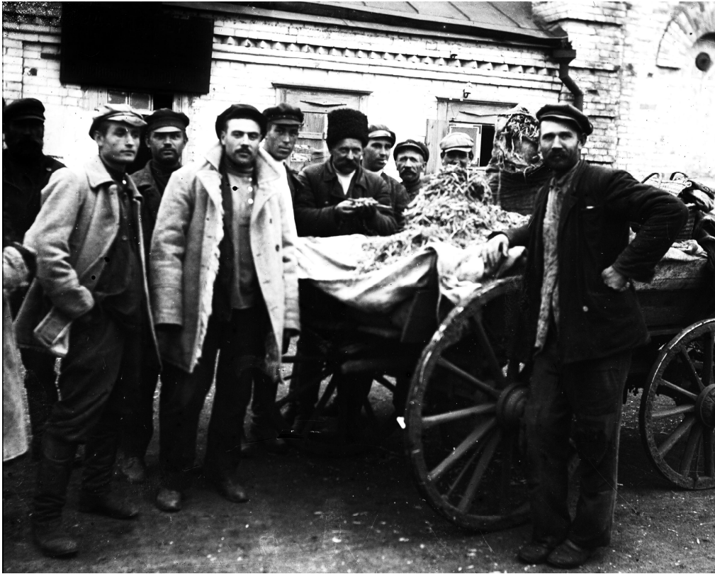
Активісти с. Удачне Донецької області з конфіскованими колосками біля сільради. 1932 р. Од. обл. 4-17922