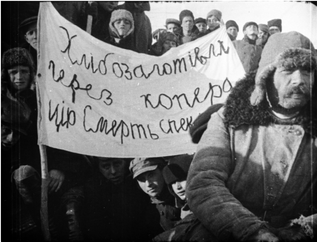
Селяни здають зерно державі в с. Іллінці Вінницької округи. 1929 р. Од. обл. 0-97388