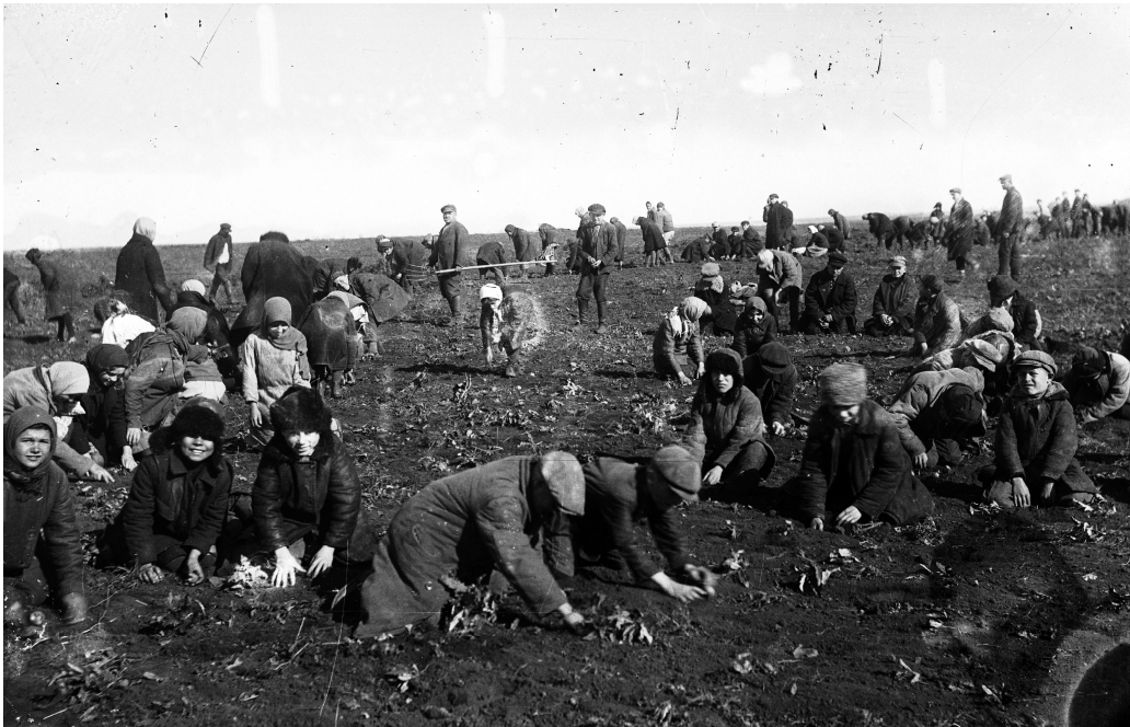
Діти збирають мерзлу картоплю на колгоспному полі с. Удачне Донецької області. 1933 р. Од. обл. 3-1125