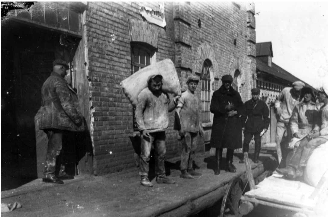
Здавання зерна і сільгосппродуктів. с. Удачне Донецької обл., 1933 р. Од. Обл. 4-17902