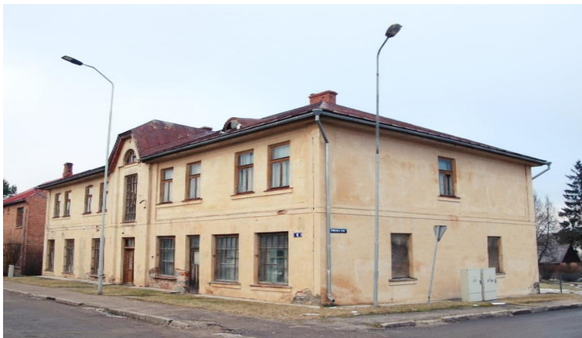
(2017. gada bilde); Kopš 1999. gada privātīpašumā