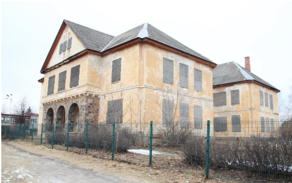
(2017. gada bilde); Valkas novada domes privātīpašums