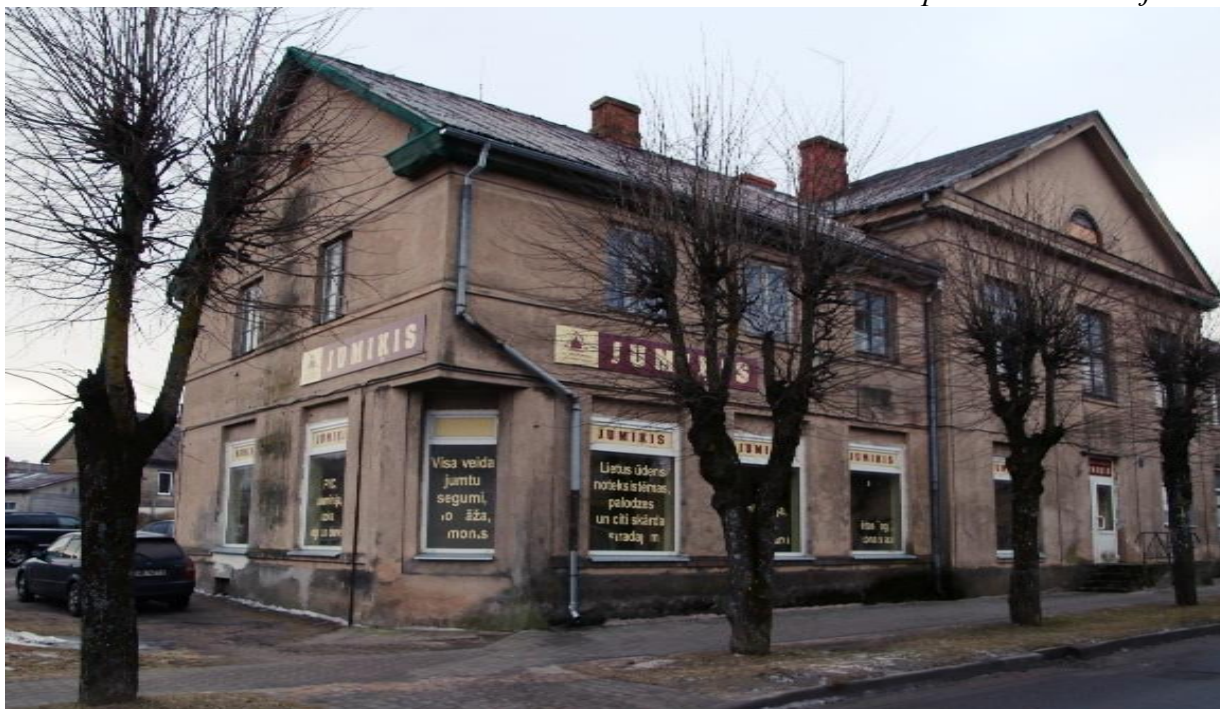
(2017. gada bilde)