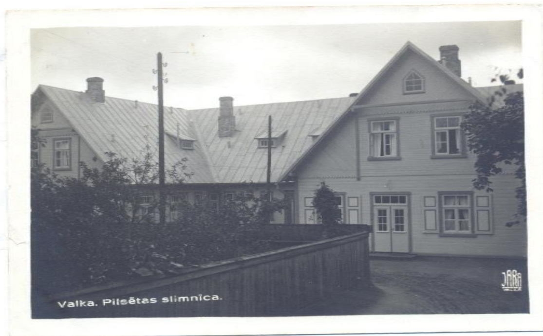
(Bilde no Valkas novadpētniecības muzeja)