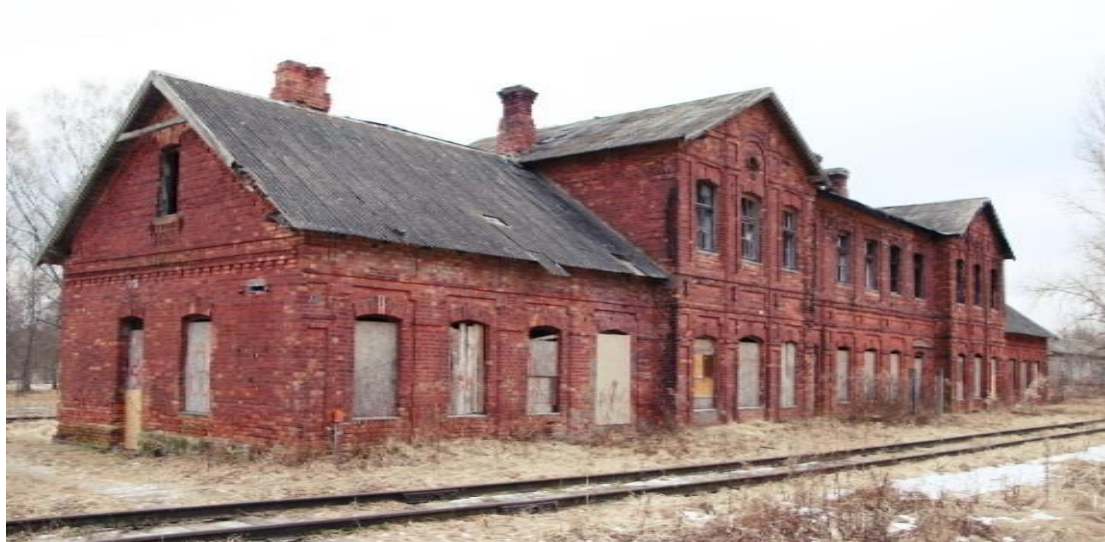
(Valkas novada domes īpašums. 2017. gada bilde.)

Stacijas ēka celta apt. 1896./97.g. Vilcienu kustību šaursliežu (750 mm) dzelzceļa līnijā Valka – Rūjiena – Pērnavā atklāja 1896.gada oktobrī (1.vilciens sācis kursēt 1897.g.).