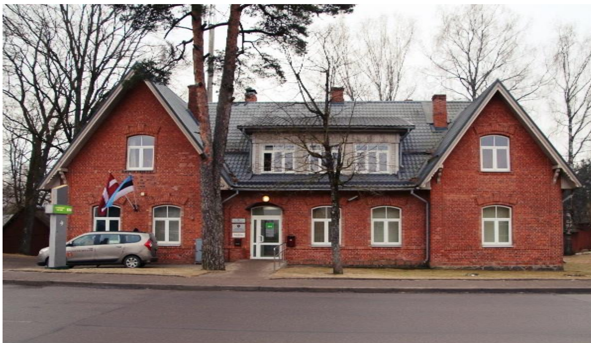
(2017. gada bilde); Valkas novada domes privātīpašums

“Vēsturiskā bankas ēka ir viens no veiksmes stāstiem. Pašvaldība izmantoja pirmpirkuma tiesības un šī ēka atdzīvojās, turklāt drīzumā tur jau sāks darbu notārs, būs klientu apkalpošanas centrs. Tas arī norāda, cik pašvaldībai rūp tas, lai šādas ēkas būtu sabiedrības aprītē.”