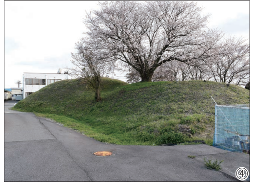
①足羽山継体大王像(福井市足羽上町) ②銅鐸出土地記念碑(春江町井向) ③六呂瀬山古墳葺石と埴輪列(丸岡町上久米田) ④椀貸山古墳(丸岡町坪江)