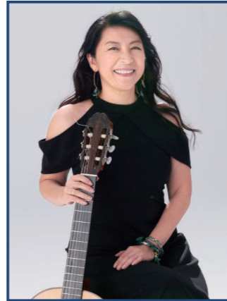
▲ハートピア春江初登場！ぜひ会場にてお聴きください