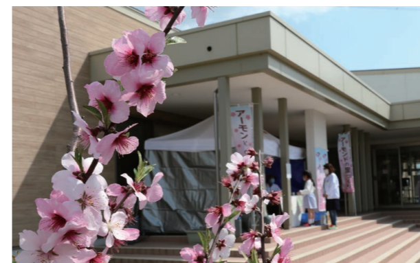
▲受付会場となった春江東コミュニティセンターでも、アーモンドの花が見物客をお出迎え

アーモンドの花を大勢の人たちに楽しんでもらおうと、春江東部地区まちづくり協議会がアーモンドお花見週間を開催しました。このイベントは、アーモンドを地域のシンボルとして広める事業の一環として、平成28年から継続して実施。期間中には市内外から約1,300人の見物客が訪れ、美しく咲き誇る濃いピンク色の花に魅了されていました。