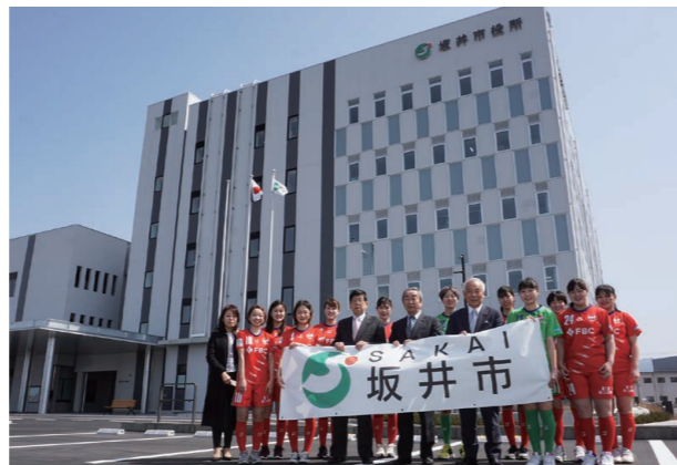
▲新庁舎前でバナー広告看板を初お披露目

まちの話題が満載の「フォーカス」は、市のホームページ ( https://www.city.fukui-sakai.lg.jp/ ) からご覧いただけます。ホームページでは「ホット」な話題を随時公開。また、上記以外の話題も紹介しています。