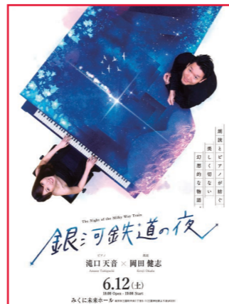
▲宮沢賢治の代表作を、目と耳で楽しむ朗読コンサートです