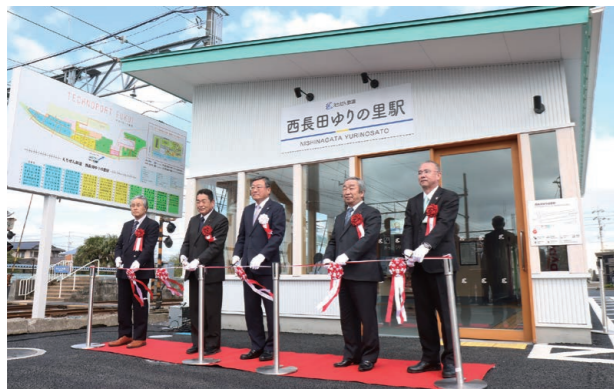
▲新たに生まれ変わった西長田ゆりの里駅の誕生を祝い、テープカットを行う関係者たち

西長田ゆりの里駅が完成し、えちぜん鉄道株式会社が竣工記念式典を開催しました。約72年間地域交通の拠点として親しまれてきた駅舎は、老朽化のため線路東側へ移転新築し、ホームにはスロープなどを新設。福井大学とともに整備計画を進めた同駅は、大学生や地域住民のアイデアが盛り込まれており、交通と交流の地域拠点として生まれ変わりました。