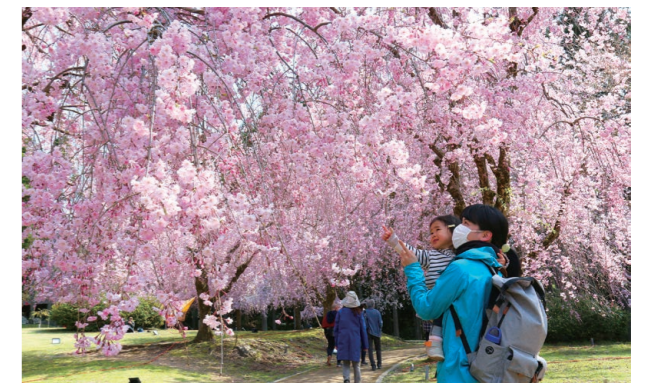
▲花見客を魅了する満開のしだれ桜。夜はライトアップされ、昼とは違う幻想的な姿を見せてくれる

まちの話題が満載の「フォーカス」は、市のホームページ(☎ https://www.city.fukui-sakai.lg.jp/ )からもご覧いただけます。ホームページでは「ホット」な話題を随時公開。また、上記以外の話題も紹介しています。