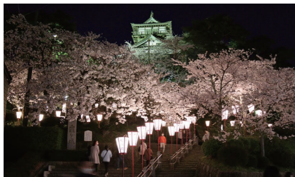
▲ライトアップされた丸岡城と300基のぼんぼりの灯りで淡いピンク色が浮かび上がるソメイヨシノ