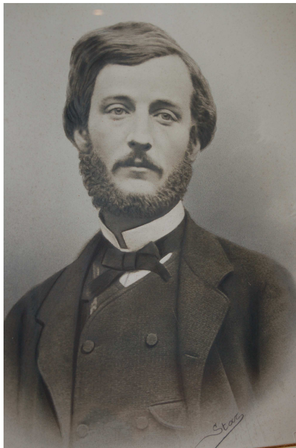
Portrait de Frédéric Bazille. Mairie de Beaune-la-Rolande.

Pour certains d'entre eux, il n'hésitera pas à leur venir en aide financièrement. La gloire n'était pas encore au rendez-vous pour tous ces artistes.