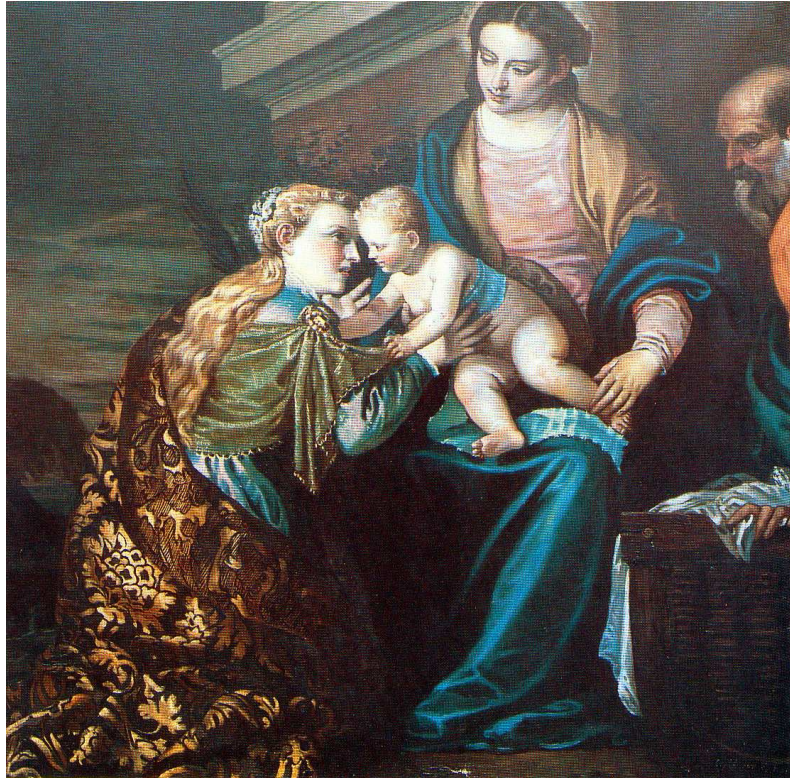
Le Mariage mystique de sainte Catherine (Frédéric Bazille) 1863 Eglise de Beaune-la-Rolande.