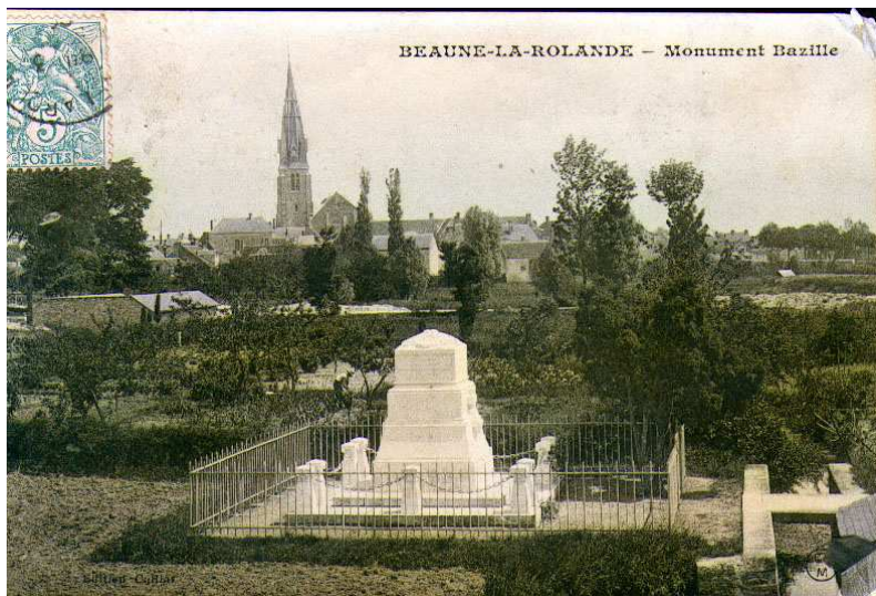
Monument Frédéric Bazille à Beaune-la-Rolande.