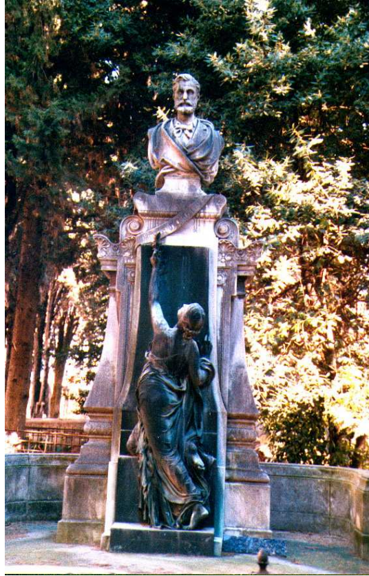
Tombe de Frédéric Bazille. Cimetière protestant de Montpellier.