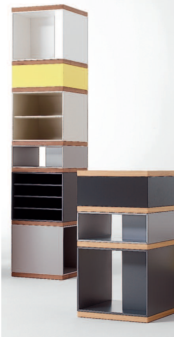
ARCHITECTURALE MEUBELN ▶ De kast Totem, voor het Nederlandse Pastoe, die verandert naargelang het gebruik. De rompen zijn draaibaar. Foto midden: Het kantoor van Concordia in Waregem. Drie lichtdozen verankeren het gebouw in het landschap Foto rechts: Torengedebouw in Djedda.

Wat doet hij eigenlijk het liefst: objecten of huizen ontwerpen? ‘Maakt niet uit. Interieurs, verbouwingen, eengezinswoningen, retailprojecten, bedrijfsgebouwen, boetieks en objecten: op twintig jaar tijd heb ik bewezen dat ik alle schalen van architectuur aankan.’