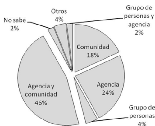
Figura 2. Elaboración propia a partir de datos de la entrevista aplicada 2014. n= 50 familias Elaboración de fertilizantes y control de plagas en traspatio.

Una de las capacidades desarrolladas a través de la colaboración de la agencia dentro del traspatio es la elaboración de caldos nutritivos y extractos orgánicos