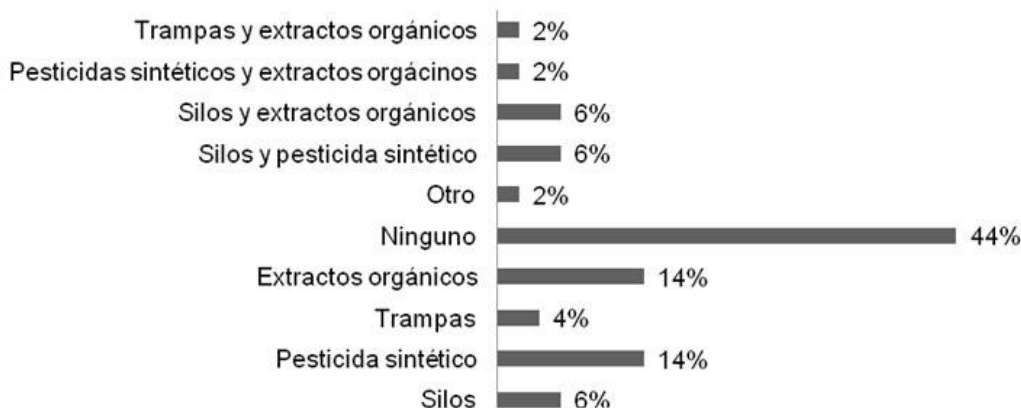
Figura 3. Elaboración propia a partir de datos de la entrevista aplicada 2014. n= 50 familias