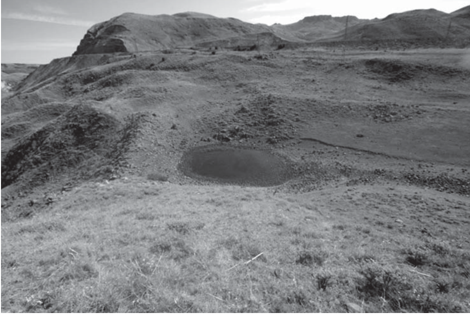
Resim 7: Gaban Urartu sulama göleti