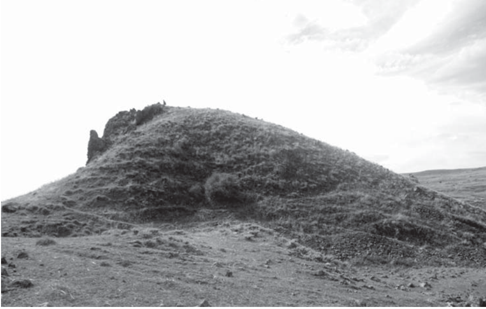
Resim 11: Gaban Kalesi (IV)