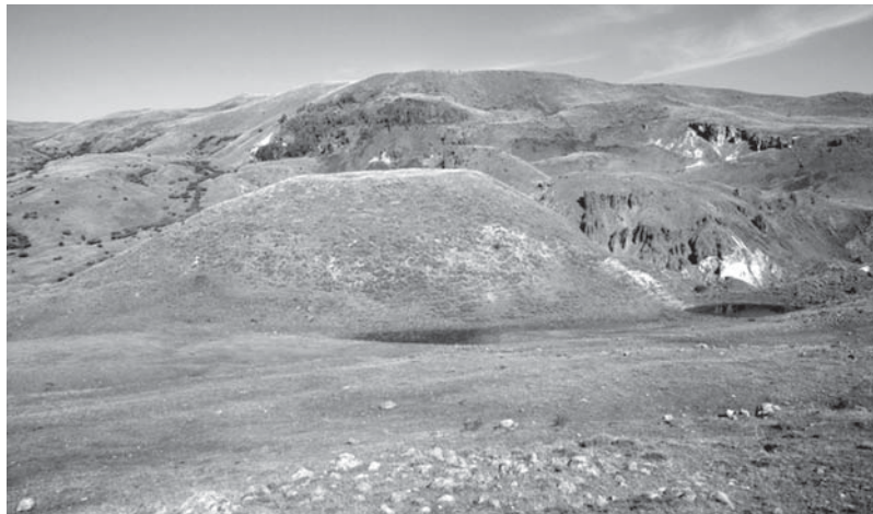
Resim 6: Gaban Kalesi (I)