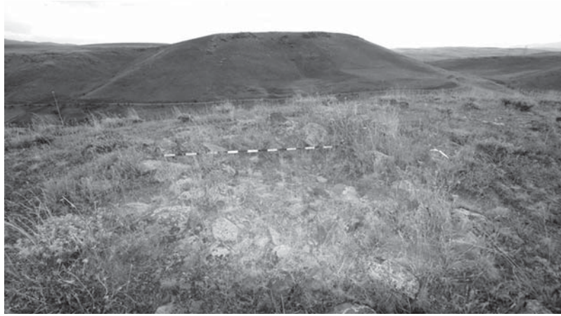
Resim 5: Hubyar nekropol alanı