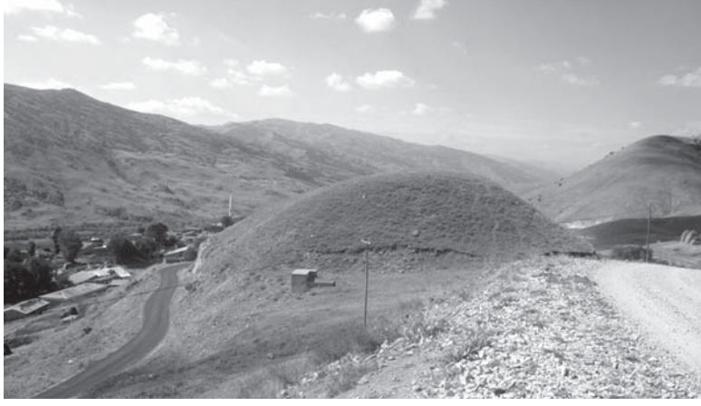
Resim 1: Gökçeşeyh Höyük