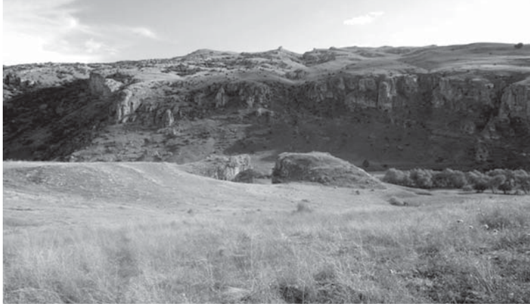
Resim 2: Çilehane Kalesi