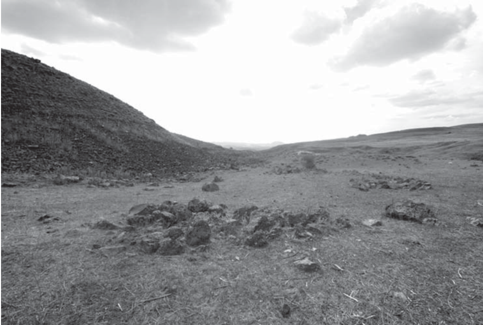
Resim 12: Gaban nekropol alanı