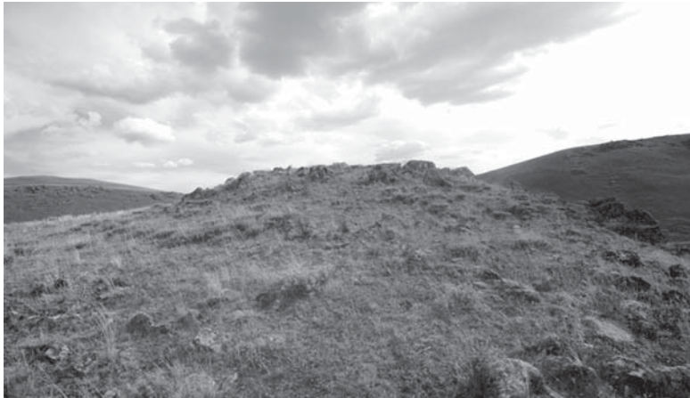
Resim 3: Hubyar Kalesi (I)