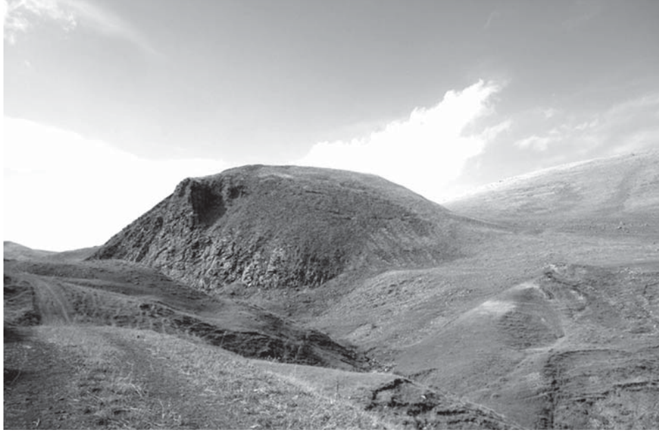
Resim 14: Aşağı Iğırbiğir Kalesi