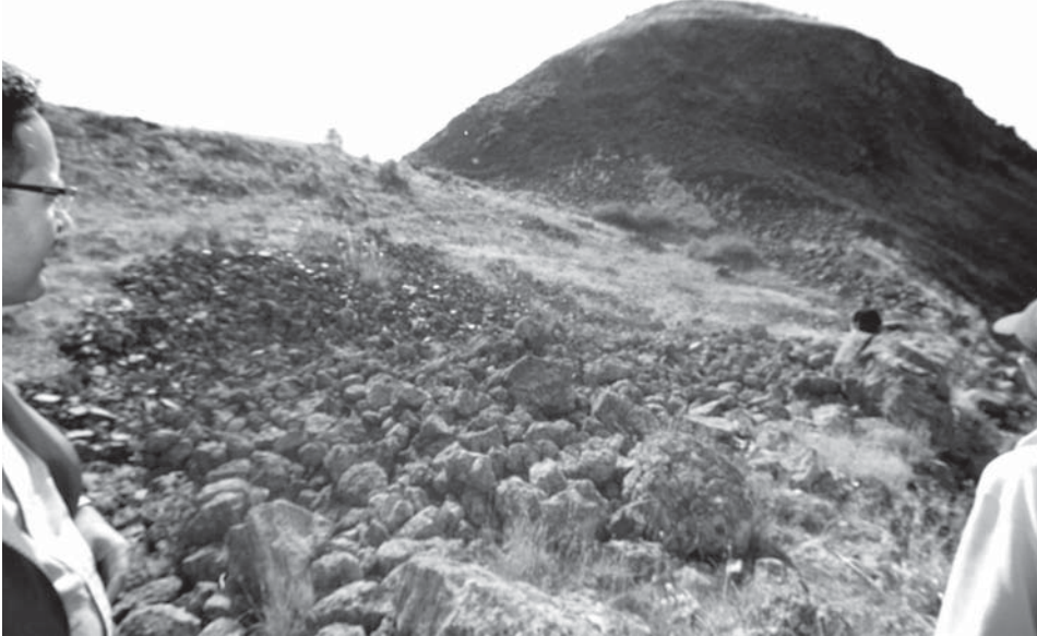
Resim 8: Gaban yerleşmesi