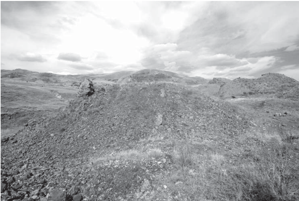
Resim 10: Gaban Kalesi (III)