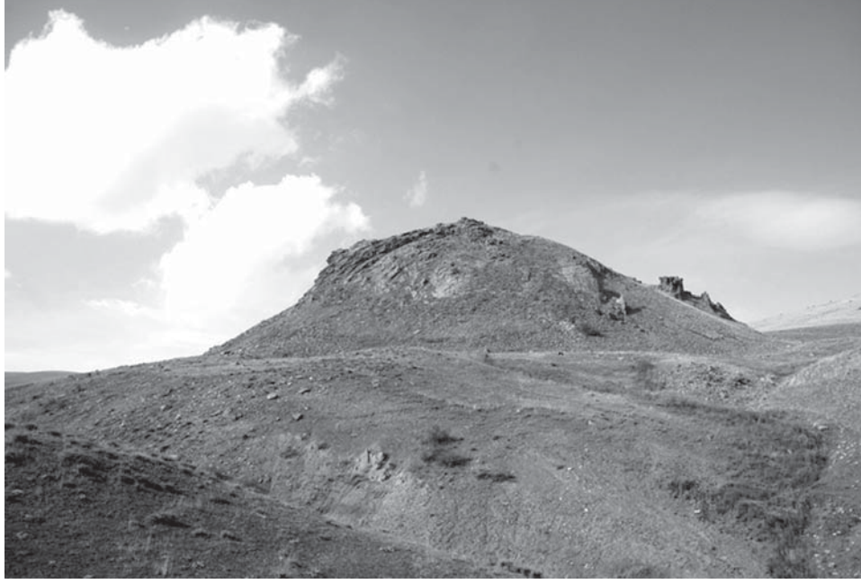
Resim 13: Yukarı Iğırbiğir Kalesi