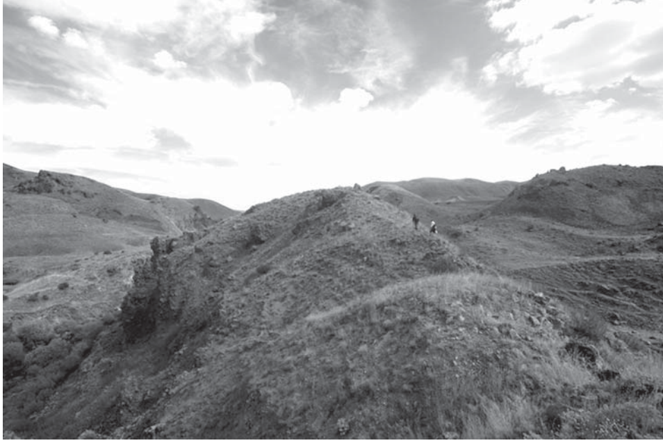
Resim 9: Gaban Kalesi (II)