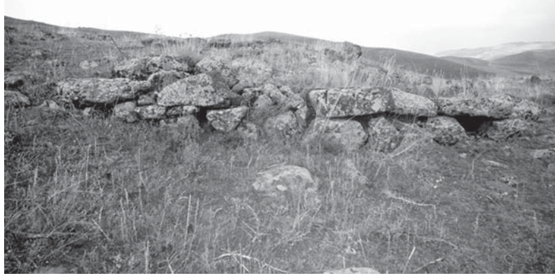
Resim 4: Hubyar Kalesi (II)