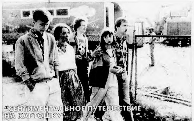
“СЕНТИМЕНТАЛЬНОЕ ПУТЕШЕСТВИЕ НА КАРТОШКУ”