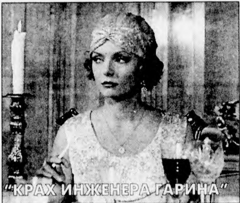
“КРАХ ИНЖЕНЕРА ГАРИНА”

ченко, Е.Голубева. “Ленфильм”, 1987 г. Среда, 20 сентября, 11.32, 2x2. “ВЕЛИКОЛЕПНАЯ АНЖЕЛИКА” . Мстить можно по-разному... Анжелика выбирает самый верный способ — чтобы отомстить королю за арест мужа, она... вновь выходит замуж и на этот раз за маркиза. Путь в Версаль открыт, и зрителям предоставляется возможность увидеть великолепную Анжелику в великолепии королевского дворца. В ролях: М.Мерсье, Ж.-Л.