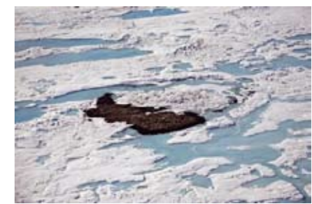
Figur 3. Världens nordligaste nu kända landområde, en ca 40 meter lång grushög strax norr om Grönland vid namn Stray Dog West (N 83°40'30", W 31°11'), som upptäcktes i juli 2007. En närlägen ännu nordligare ö upptäcktes vid Lat N 83° 42' år 2003, men den har senare försvunnit under vattenytan.

Kanada har naturligtvis rätt. Vad skulle Sveriges regering säga, om någon skulle hävda rätt till transitpassage genom Stockholms skärgård från Landsort via Mysingen, Kanholmsfjär-