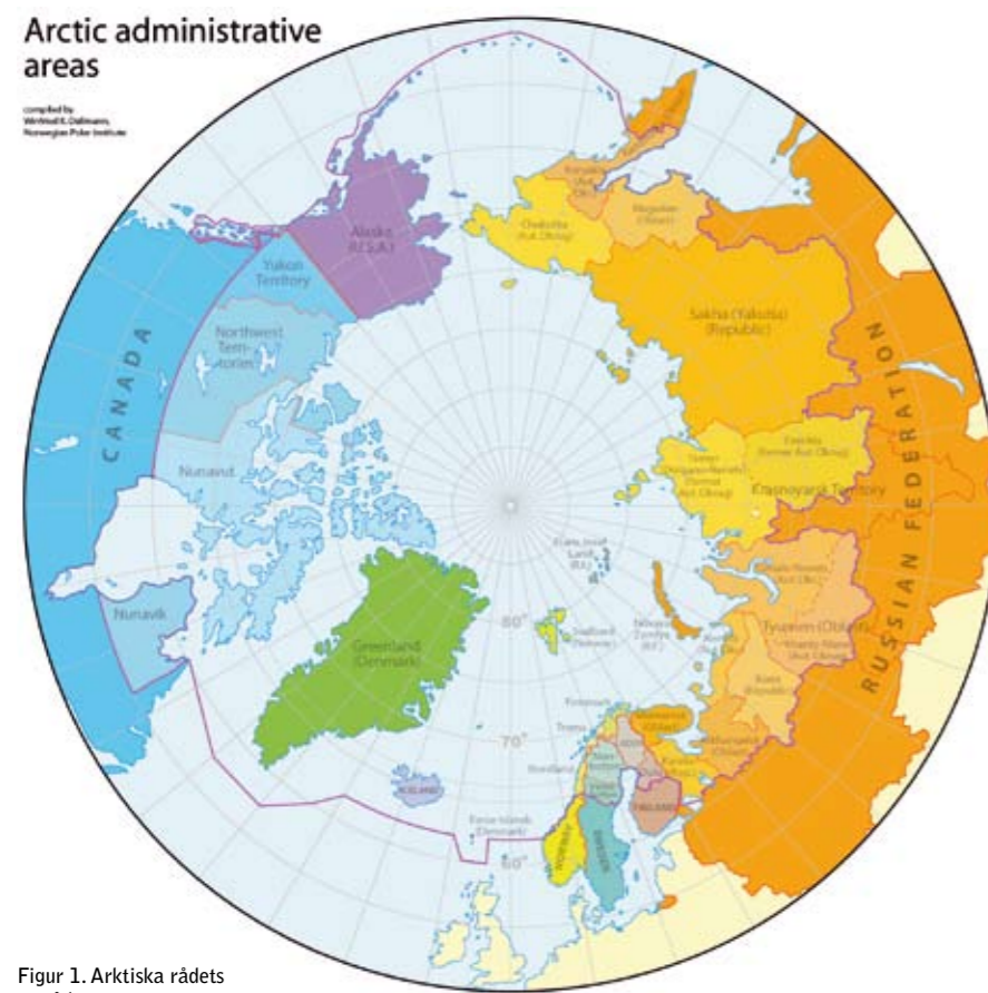
Figur 1. Arktiska rådets område.

Övergången från neutralitet till solidaritet i svensk säkerhetspolitik medför att vår militära närvaro kan komma att utsträckas långt utanför våra egna gränser, bland annat till delar av Arktis. Just nu diskuteras om svenska flygförband skall hjälpa till att övervaka luftrummet över och omkring Island, som inte har något eget försvar.