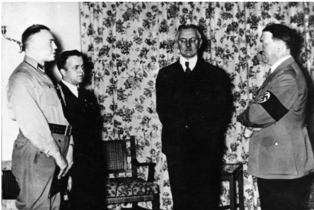
Адольф Гитлер дискутирует с рейхсминистром экономики и президентом Рейхсбанка доктором Ялмаром Шахтом в 1936 году.