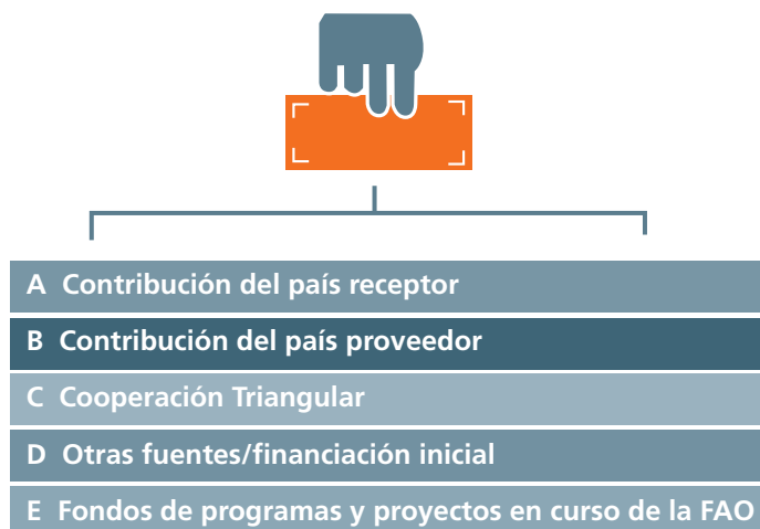
GRÁFICO 4: MÉTODOS PARA FINANCIAR LA CSS

Fondo Fiduciario Unilateral (FFU). Un FFU es una modalidad de financiación sufragada en su totalidad por un gobierno para programas o proyectos que se ejecutarán en el país. Existen tres fuentes de financiación principales para los FFU; recursos