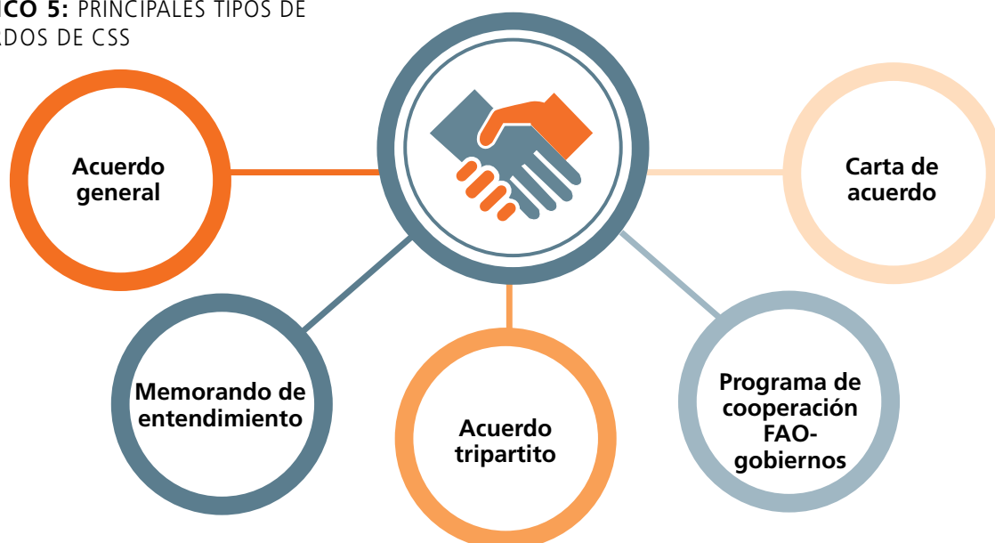
GRÁFICO 5: PRINCIPALES TIPOS DE ACUERDOS DE CSS

Estos acuerdos deben considerarse como una lista de opciones, que se pueden utilizar y modificar según proceda, con el objetivo de mantener el texto legal estándar de la FAO en la medida de lo posible. La TCS otorgará todas las debidas autorizaciones internas de la FAO.