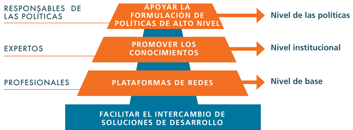
GRÁFICO 1: ESTRATEGIA DE CSS