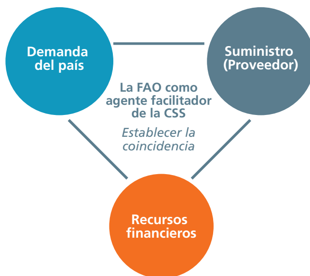
GRÁFICO 2: ESTABLECER LA COINCIDENCIA

Tanto si se comienza desde la perspectiva de un país receptor o de un país proveedor como de un asociado para la Cooperación Triangular, es importante reflexionar sobre lo siguiente: