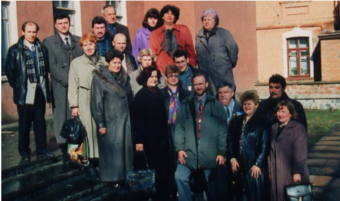
Всеукраїнська олімпіада з біології (журі та організаційний комітет), м. Вінниця, 1998 р.