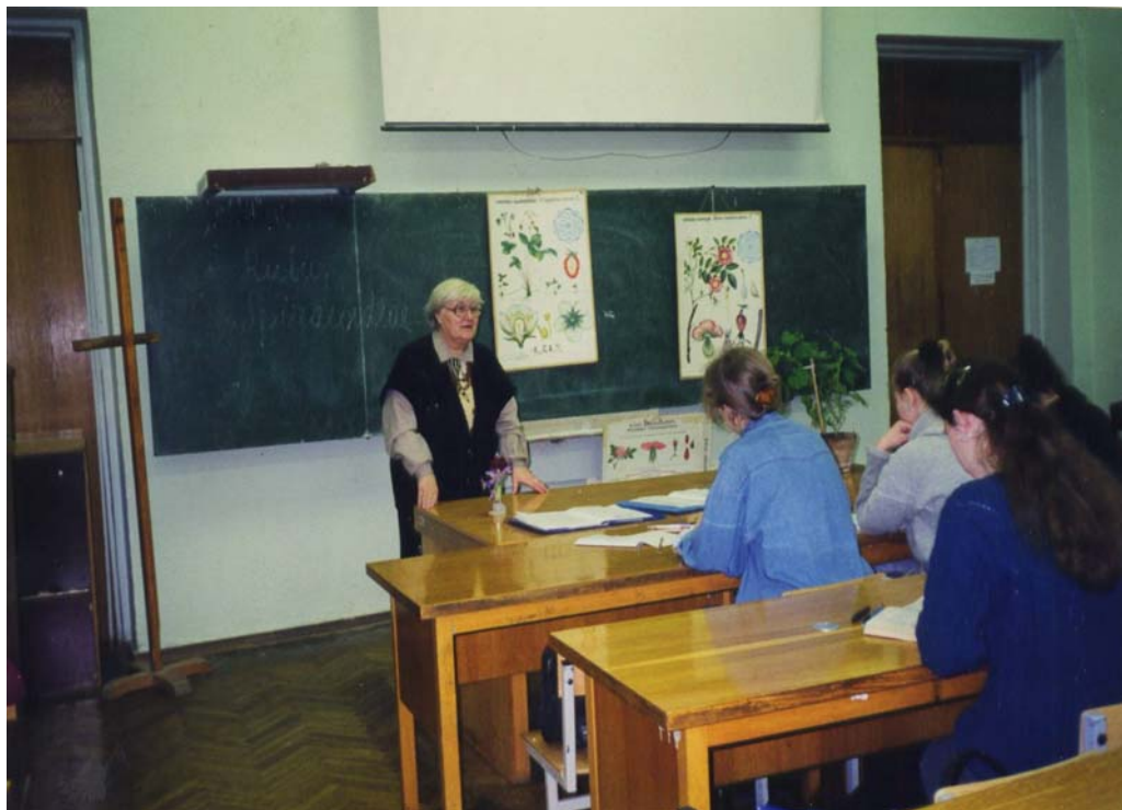
Відкрита лекція з ботаніки (систематики рослин) для студентів II курсу біологічних спеціальностей, кафедра ботаніки, 2006 р.