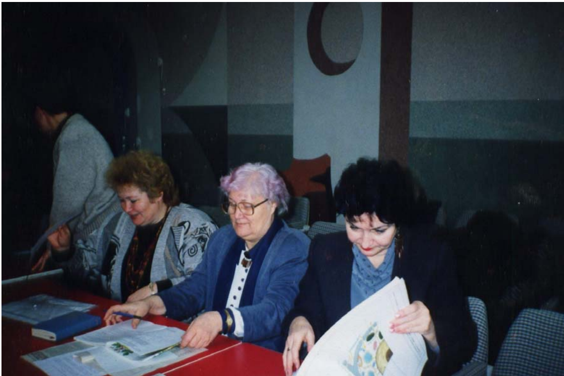
Семінар вчителів біології України, Крим, Ласпі, 1999 р.