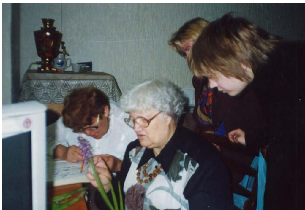
Консультація школярів смт Семиполки Київської обл. з визначення видів родини Орхідеєві при написанні наукової роботи МАН, кафедра ботаніки 2009 р.