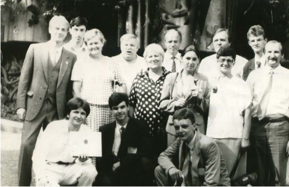
Члени журі і команда України на VI Міжнародній олімпіаді школярів з біології, Крим, Артек, 1996 р.