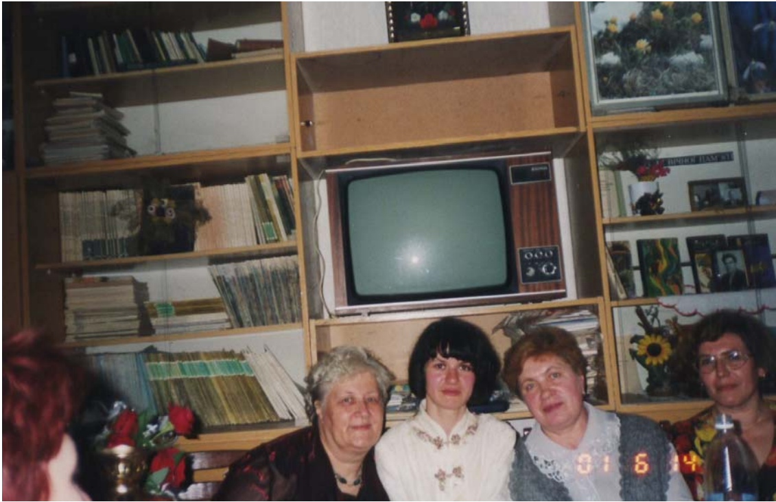
Семінар з біології для вчителів м. Києва (СШ №232), кафедра ботаніки, 2002 р.