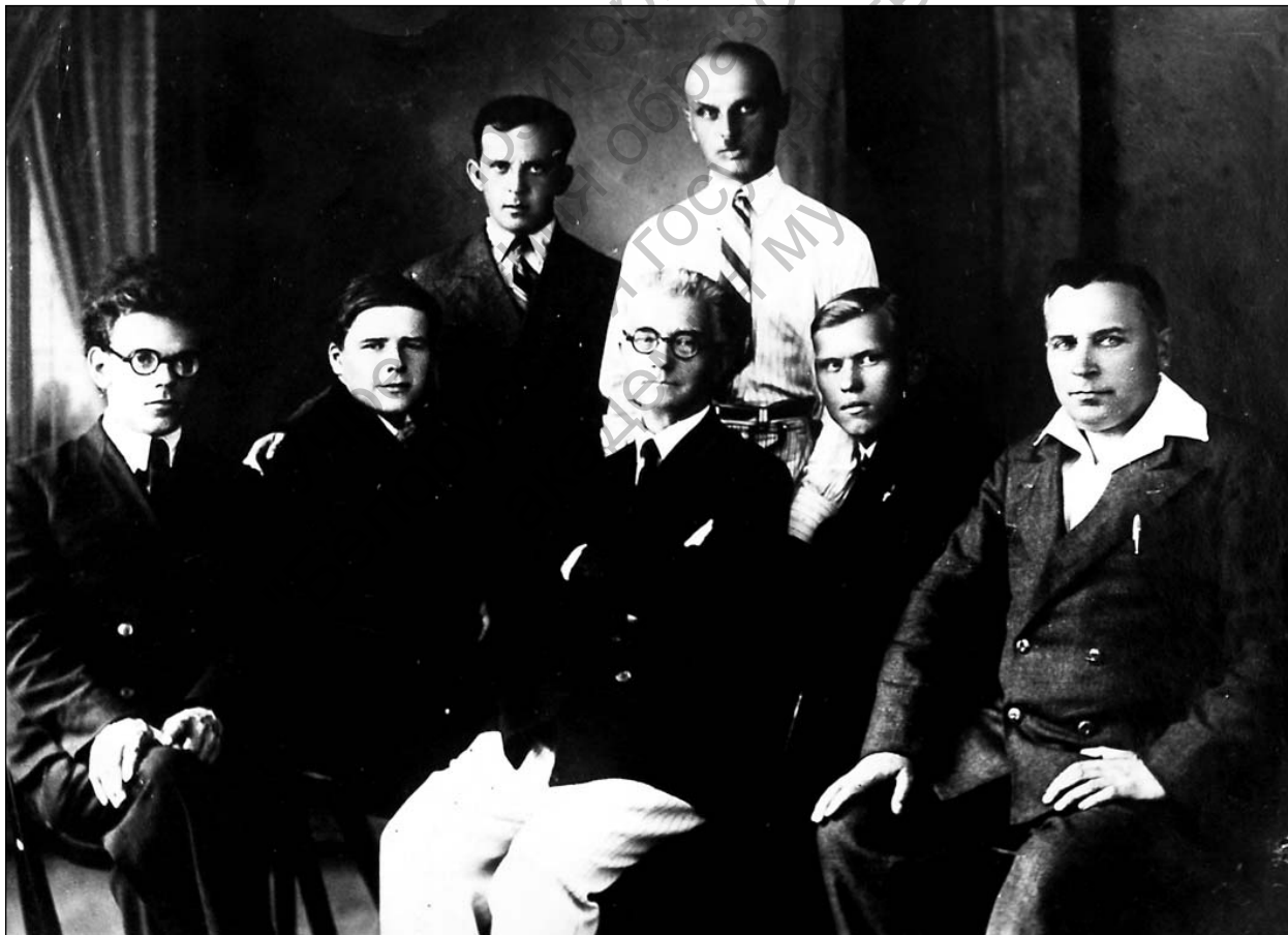
Выпуск Белорусской государственной консерватории 1937 года.