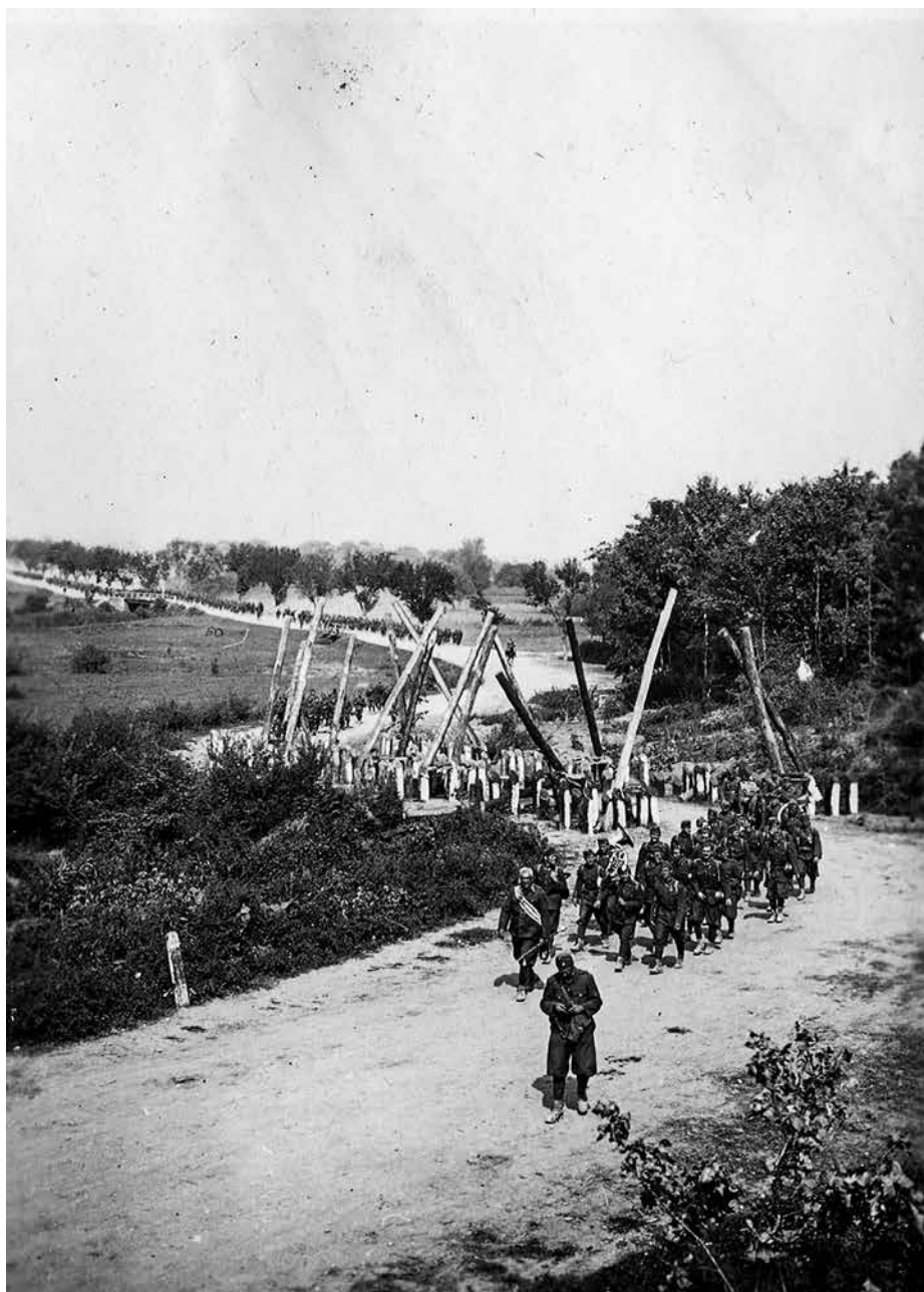
2. kép. A 2. honvéd gyalogezred ezredzenekara a Hadad előtti úttorlaszoknál, 1940. szeptember 7-én