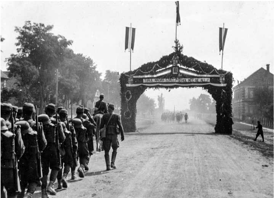
1. kép. A 32. honvéd gyalogezred Vállajnál, 1940. szeptember 5-én