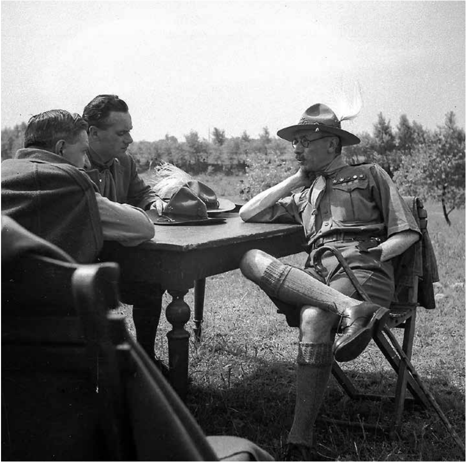
1. kép. Teleki Pál az 1933-as, Gödöllőn megrendezett dzsemborin.