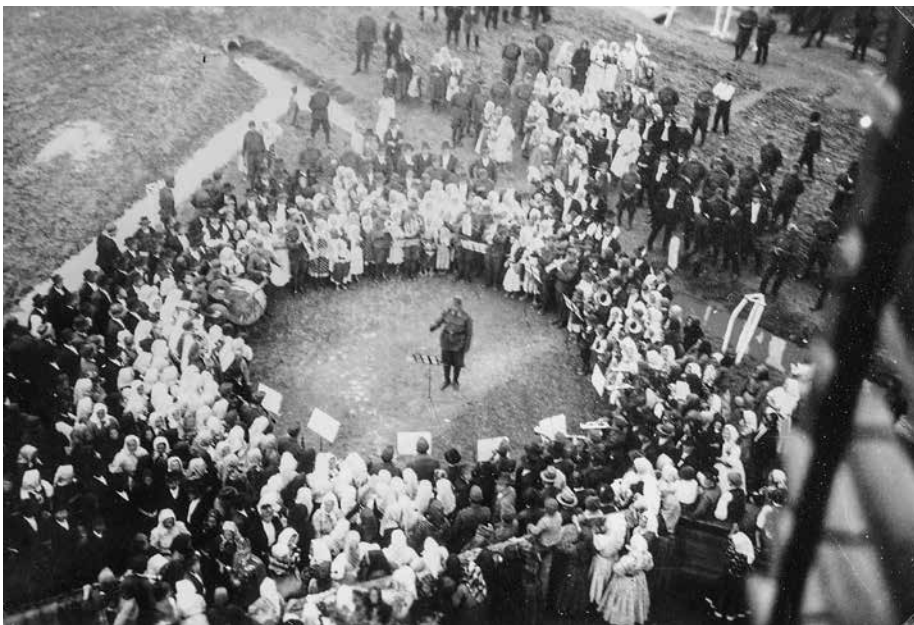
3. kép. Honvéd térzene Szilágypercesen főterén