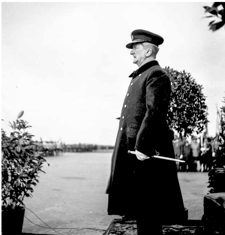
2. kép. Horthy Miklós 1938 áprilisában a budaörsi repülőtéren, amikor a magyar cserkészlet fennállásának 25. évfordulóját ünnepelték.