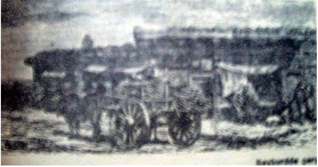
Resim: 1- Bayburd (1869) (Th.Deyrolle'den)