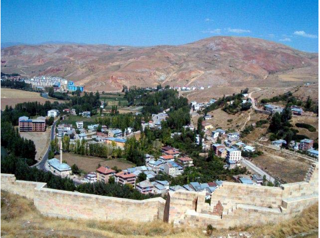
Resim: 8- Kaleden Süleymaniye Camii ve Kaleardı Mahallesi'nin Görünüşü