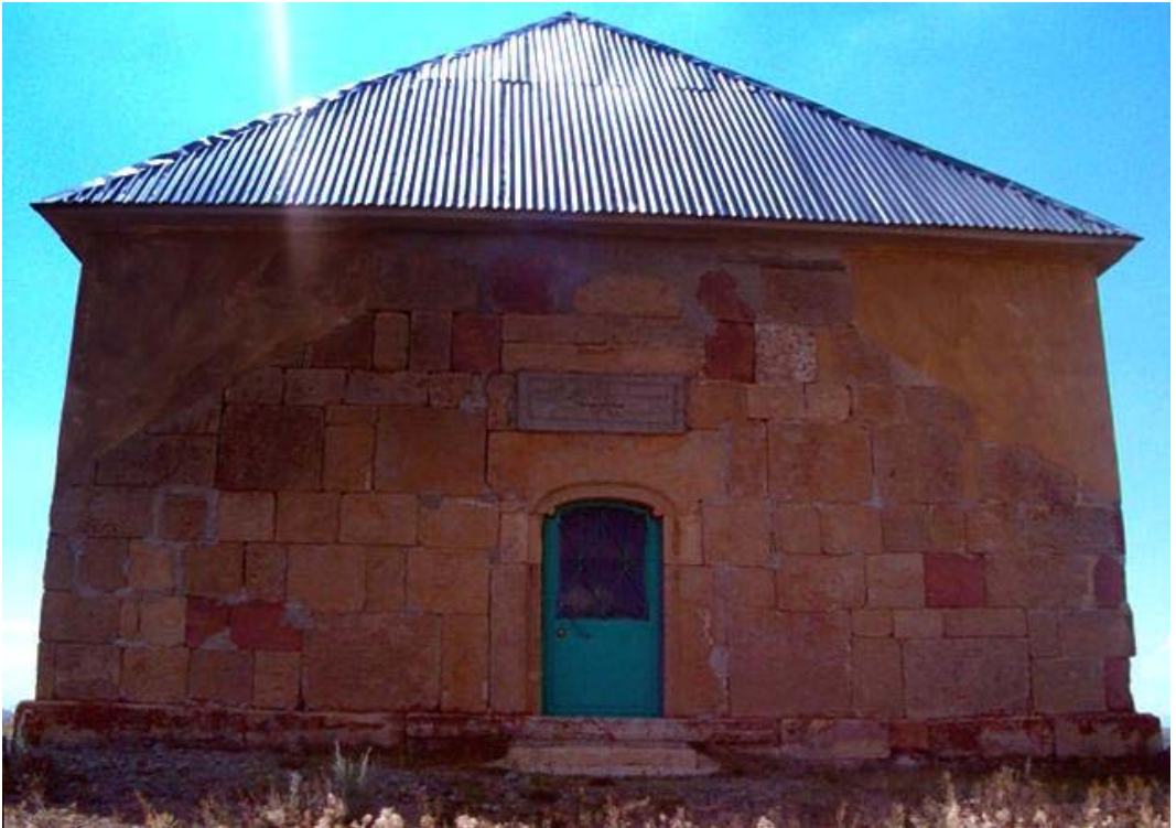
Resim: 14- Yakup Abdal Türbesi