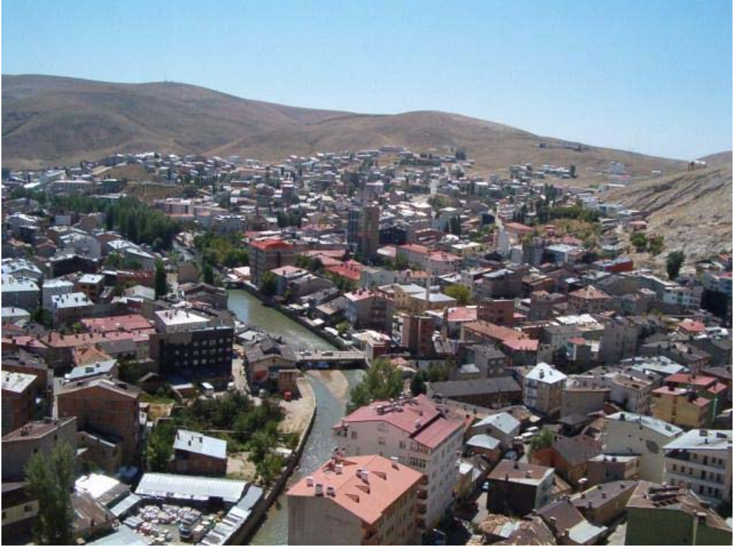
Resim: 7- Kaleden Çoruh Nehri ve Şehrin Görünüşü