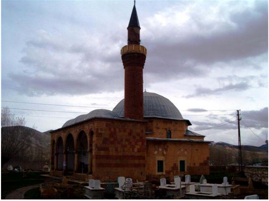
Resim: 9- Pulur Köyü Ferruḥşad Bey Camii