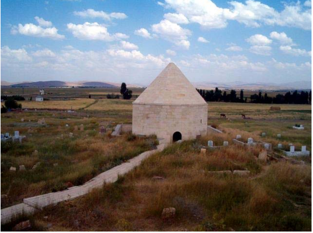
Resim: 15- Sinür Köyü Kutlu Bey Türbesi