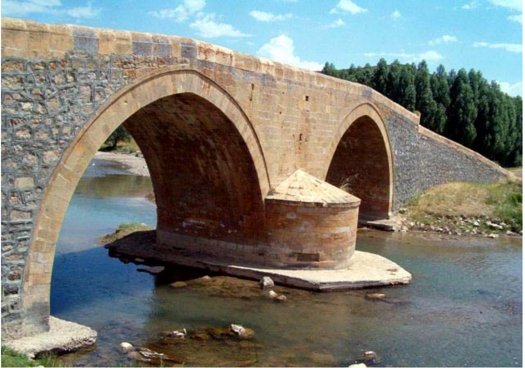
Resim: 16- Akşar Köyü ( Balahor) Korgan Köprüsü