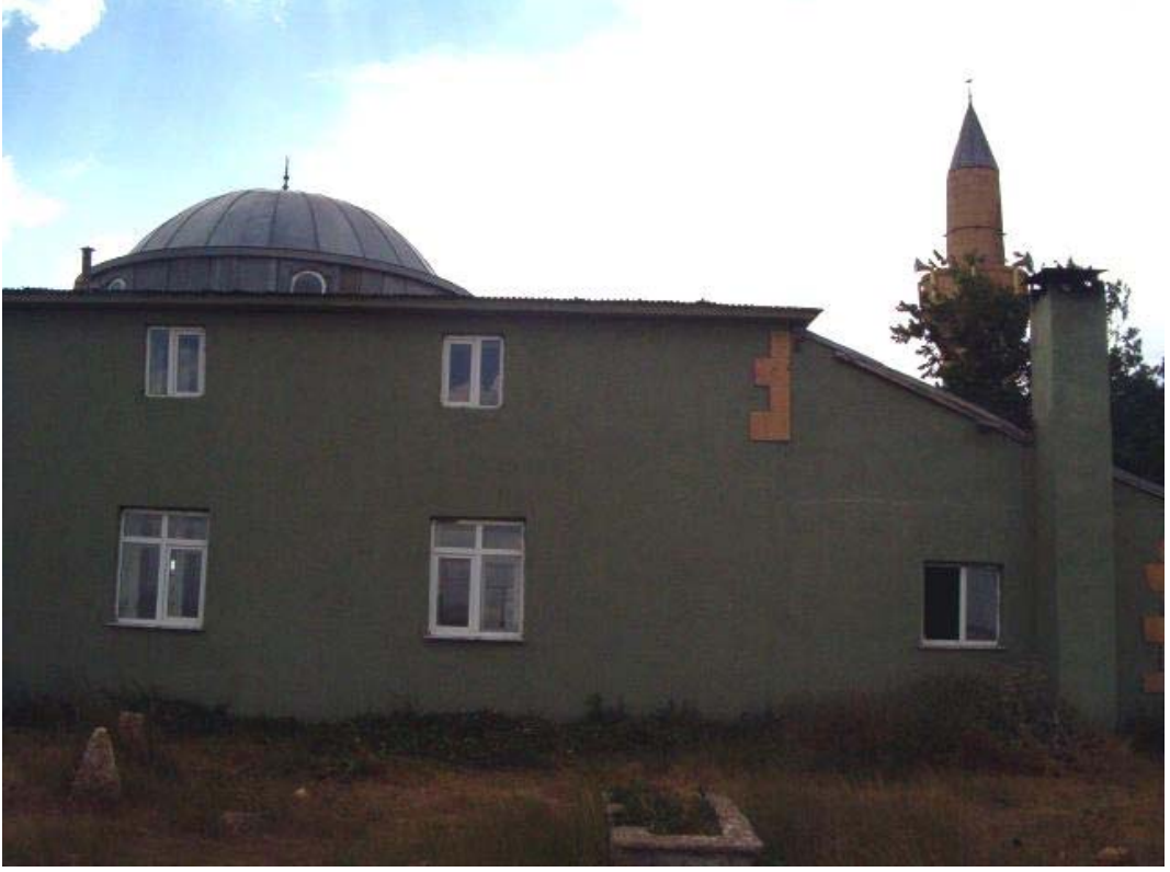
Resim: 11- Sinür Köyü ( Çayırlyolu ) Kufly Bey Camii