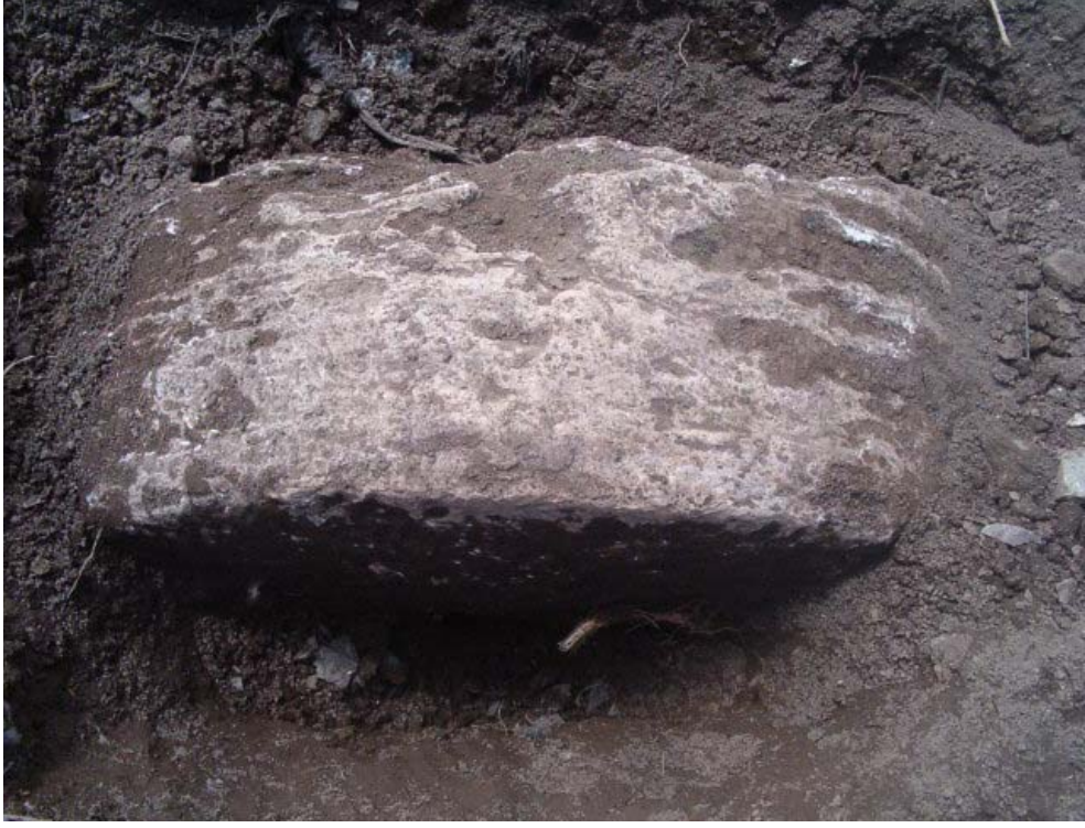
Resim: 17- Işıkova Köyündeki ( Cenci) Bezirhanenin Bezirtaşı Kalıntısı