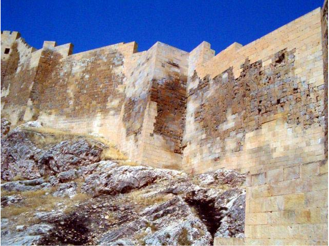
Resim: 6- Kale Surlarından Bir Görünüş