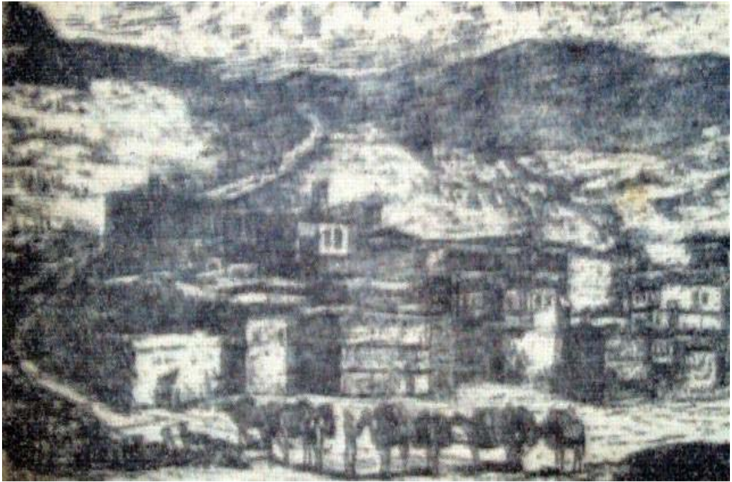
Resim: 2- Bayburd Çarşısı (Th.Deyrolle'den)