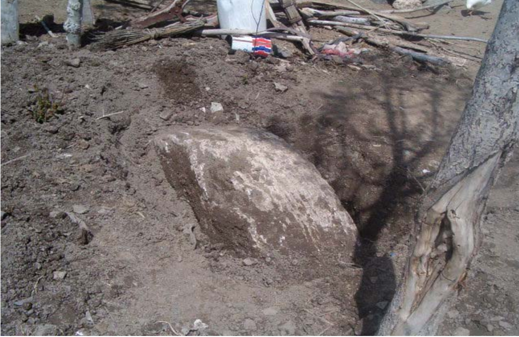
Resim: 18- Işıkova Köyündeki ( Cenci) Bezirhanenin Bezirtaşı Kalıntısı