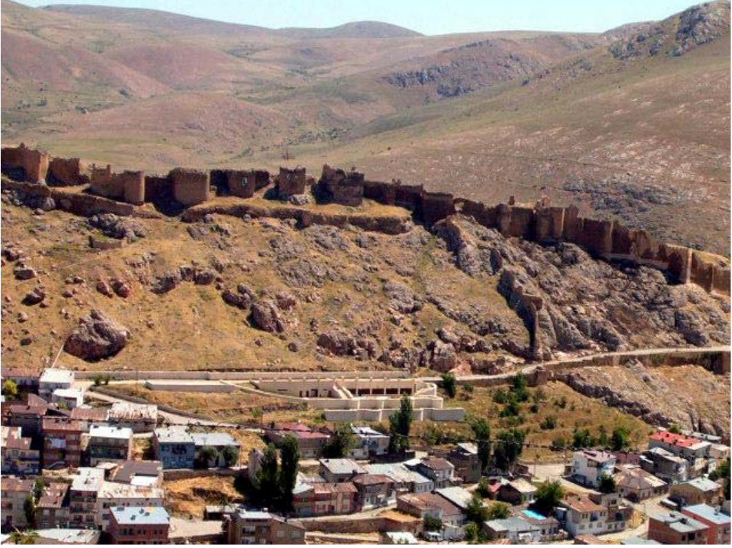
Resim: 5- Bayburd Kalesi'nden Bir Görünüş