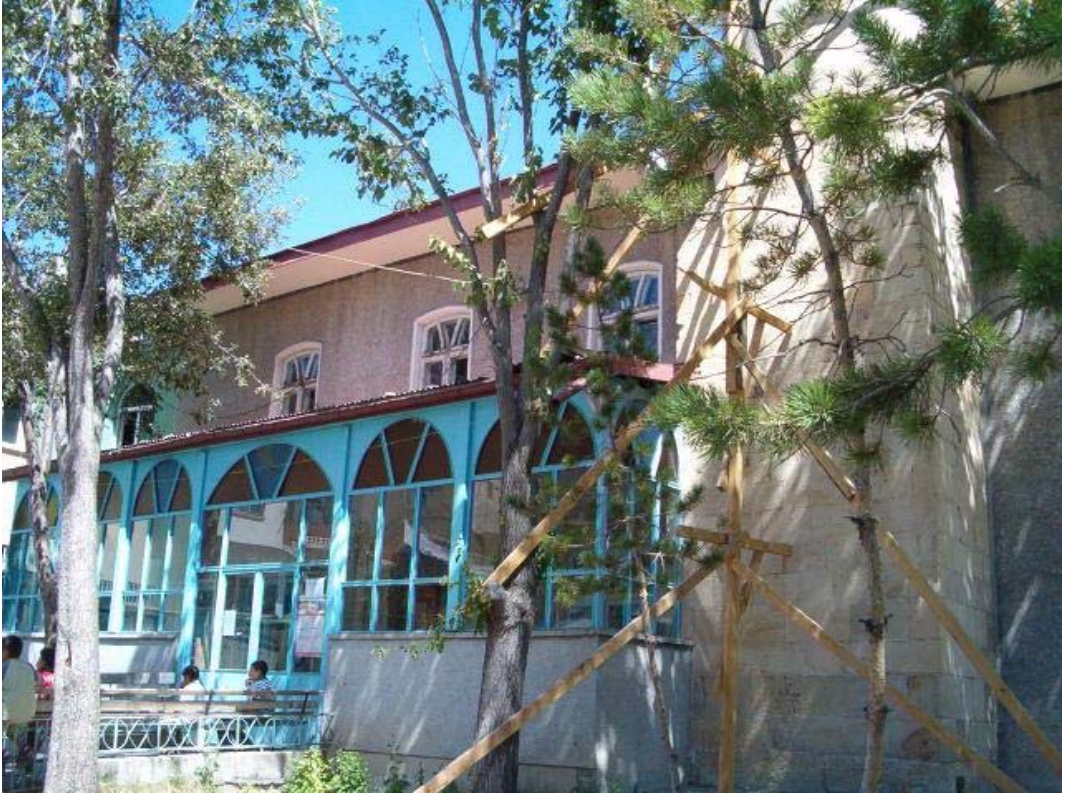
Resim- 13- Şingâh Mahallesiinde Ketenci Camii