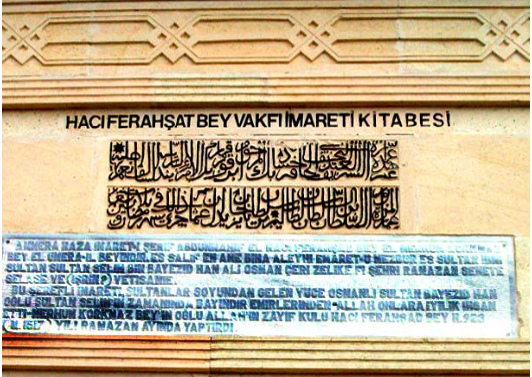
Resim: 10- Pulur Ferruḥşad Bey Vakfı İmaret-i Kitabesi