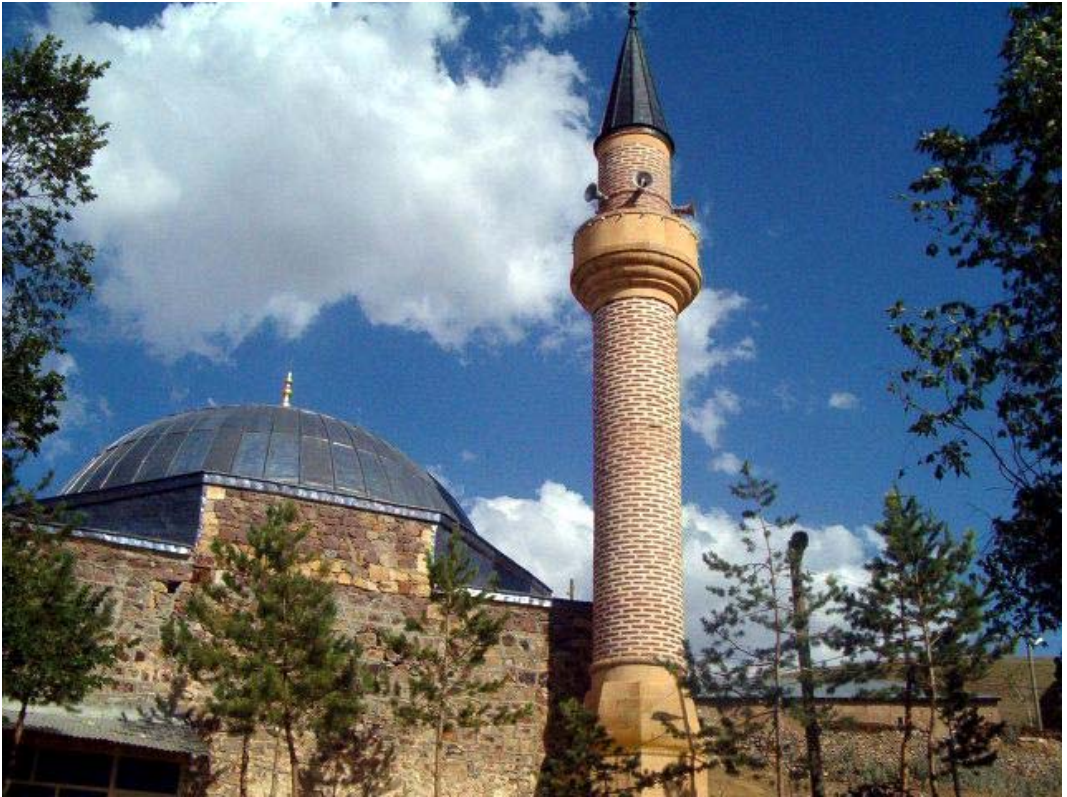
Resim: 12- Hınzeverek Köyü ( Çatalçeşme) Camii