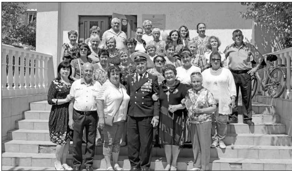
Гости мероприятия Гвардейской ЦБ

был проведен час мужества «Не гаснут память и свеча, поклон вам, дорогие ветераны». Также для детей была подготовлена книжная выставка, посвященная этой знаменательной дате. Низкий поклон вам и признательность. Для взрослых пользователей подготовлена книжная выставка-обзор «В книжной памяти мгновения войны».