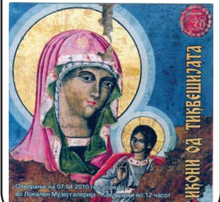
Отворање на 07.04.2010 год. (среда) во Локален Музеј галерија „Кавадарци“ во 12 часот

Изложбата задолжително треба да се погледне.