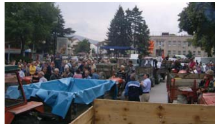
Од ланските протести на лозарите - блокиран центарот

Советот и Градоначалникот на Општина Кавадарци даваат целосна поддршка на Амандманите на Законот за вино и Законот за земјоделие и предлагаат под итно да се свика заедничка седница на Советите од Тиквешкиот регион – Кавадарци, Неготино, Росоман, Демир Капија, со присуство на пратениците од регионот и претставници од Министерството за земјоделство, шумарство и водостопанство, со цел заеднички преку Амандмани да се дејствува на Законот за вино;