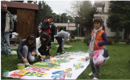
Ликовната секција од гимназијата црташе на лице место