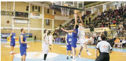
По купот пораснаа амбициите за БИБЛ титула

Салата „Универзијада“ во Софија од 13 до 15 април ќе биде домаќин на фајнал фор турнирот од балканската лига. Ова е одлука на раководството на БИБЛ лигата кое како опции за град домаќин ги разгледуваше Софија и Варна, двата бугарски града кои имаат и свои претставници во завршницата и тоа екипите на Левски и Черно Море Првиот полуфинален натпревар на 13 април во 18 часот ќе го одиграат Фени Индустри и екипата на Ловќен од Црна Гора. Според правилникот во финалето не можат да се сретнат екипи од иста држава па така во второто полуфинале истиот ден но од 20.00 часот ќе се сретнат Левски и Черно Море. 14 април е