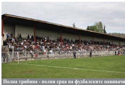
Полна трибина - полни срца на фудбалските навивачи

На крајот официјално остана забележано дека се одигра средба од четвртото пролетно коло на третата фудбалска лига југ. Она што е вистинската победа на студеникавото попладне во средата на Благовец 7 април 2010 година е фактот дека градскиот парк во Кавадарци ечеше од фудбалска песна, задоволни навивачи и победа на фудбалот. Се радуваме многу поради полните трибини и прекрасната фудбалска глетка, која кај многумина повозрасни ги врати сликите од