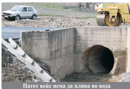
Патот веќе нема да плива во вода