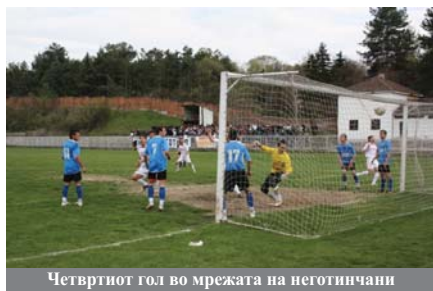
Четвртиот гол во мрежата на неготиначани

Освен официјалниот зписник за натпревар од третата фудбалска лига, се друго што се случуваше на трибините и на теренот на градскиот фудбалски стадион во Кавадарци личеше на средба од многу повисок ранг. Над две илјади гледачи, две пребучни навивачки групи „Лозарите“ од Кавадарци и „Винарите“ од Неготино. Громогласно навивање, бенгалски огнови, озарени лица и борбени фудбалери со мотив да се совлада противникот. Победи домашниот Тиквеш со резултат 4:0 (2:0). Интересен натпревар во кој домаќините беа