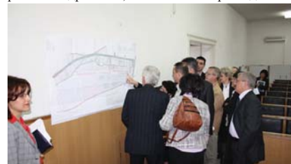
Голем интерес на советниците да видат што изгласаа

седница на која би се расправало по амандманите во врска со законите за земјоделство и вино кои треба да произлезат од најголемиот лозарски регион во државата, Тиквешкиот. Претседателот