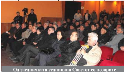
Од заедничката седницана Советот со лозарите

Со цел изнаоѓање на решенија за надминување на проблемите со откупот и откупната цена на грозјето и во таа насока поиздржан настап пред државните органи и