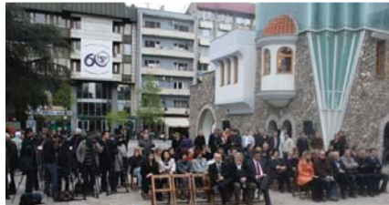
Медиумите масовно ја проследија прес конференцијата