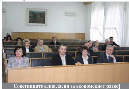
Советниците едногласни за економскиот развој