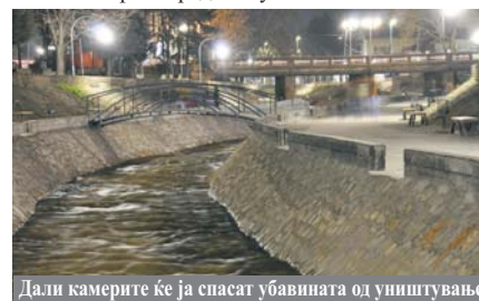
Дали камерите ќе ја спасат убавината од уништување

Кејот на реката Луда Мара стана главно собиралиште за сите генерации. Локалната власт направи вистински потег со изградбата на градското шеталиште. Место каде децата, младите, постарите можат да се рекреираат. Да пешачат, да се дружат и целосно рекреираат. Но урбаната опрема поставена на кејот стана мета на девијантни појави. Несовесни младинци сакаат да го уништуваат сето она што е наше заедничко, што ни го прави градот поубав.