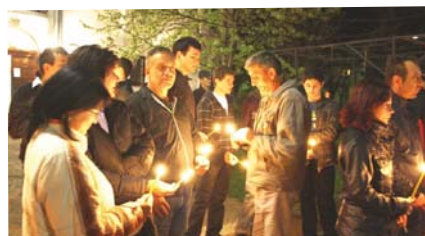
Со свеќи в рака го чекаа Воскресението Христово

Со овој ритуал и во нашиот град голем број верници го дочекаа велигденското утро. Воскресението според Библијата се случило на третиот ден по неговата смрт, сметајќи го и денот на смртта т.е. првиот ден недела после Велики петок. Православните христијани на тој ден се поздравуваат со поздравот „Христос воскрес“ на што се одговара „Навистина воскрес“. Велигден и празниците кои се поврзани со него се подвижни празници, тие не паѓаат на ист датум секоја година според грегоријанскиот календар или јулијански календар кои го следат движењето на Земјата околу сонцето и годишните времиња. Тие се фиксни според