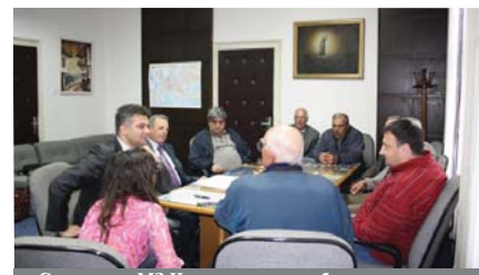
Советот на МЗ Чемерско на средба во општината