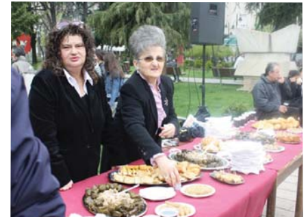
Не остана ни трошка од храната на вештите жени