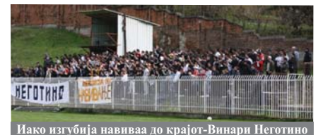
Иако изгубија навиваа до крајот-Винари Неготино

Дали во средата на Благовец се случи сон или јаве ќе видиме многу бргу. Но едно е сигурно победи фудбалот се случи прекрасен настан, среќна публика задоволни фудбалери и ден