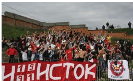
Громогласно навиваа и се радуваа на победата-Лозари