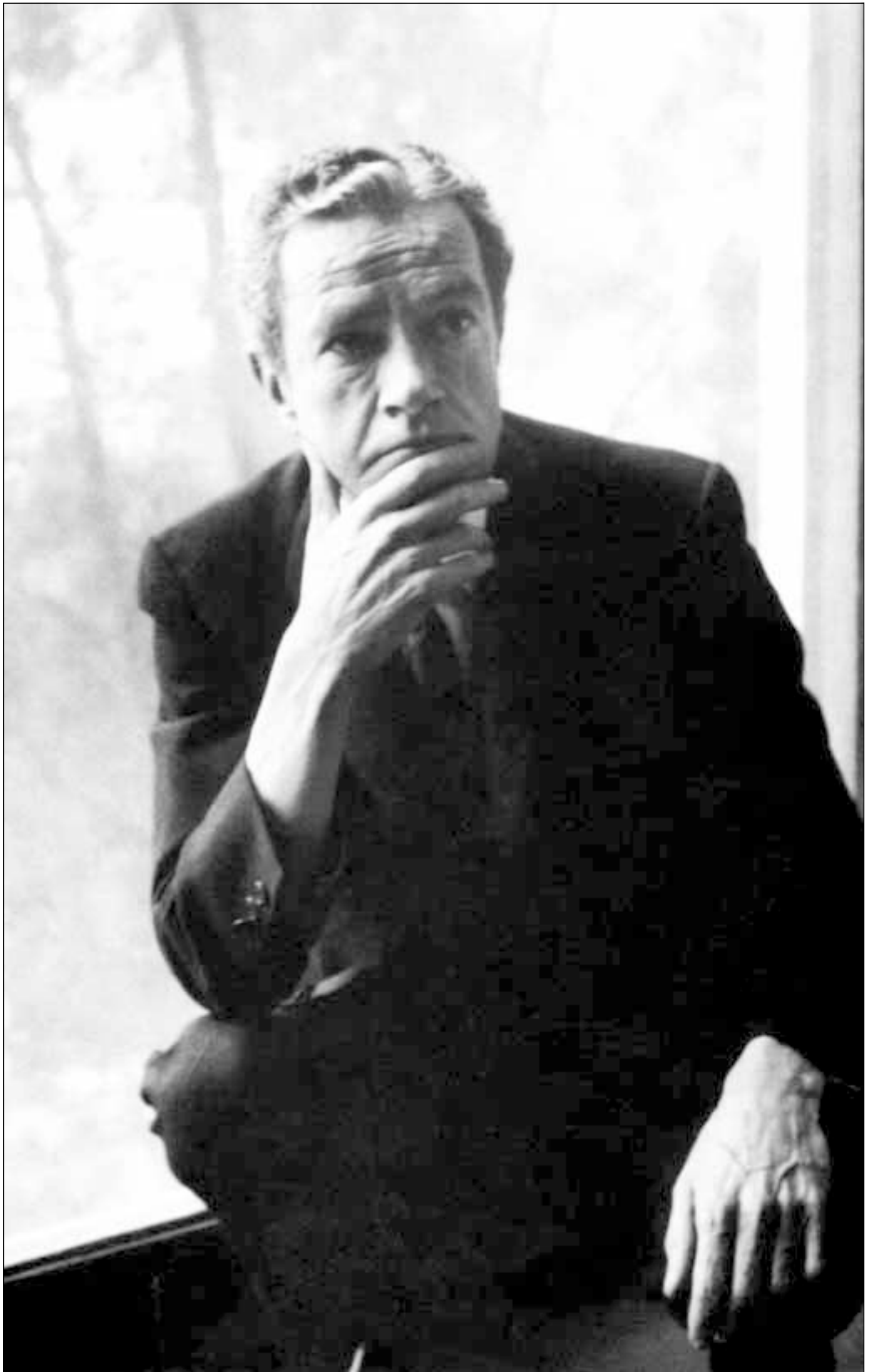
Lola Álvarez Bravo