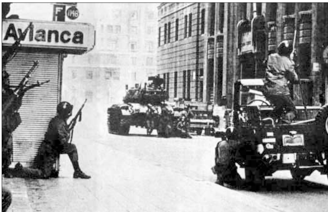
Santiago de Chile, 11 de septiembre de 1973 [fotografía de Armindo Cardoso, Chile o muerte, Diógenes, México, 1974]