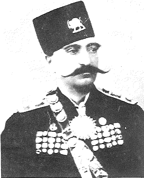
נאצר אל־דין שאה (מלך בשנים 1848–1896)

לטובה אם תתנו 25 מיליון מזה לאיזו מדינה גדולה או קטנה ותקנו לכם מדינה ותקבצו את כל יהודי העולם במדינה הזאת, ואתה תהיו להם לראש, ותנהגו את כולם בשקט ובמנוחה, שלא יהיו מפורזים ומפוצלים. צחקתי מאוד. הוא בכלל לא השיב לי. נתתי לו להבין שאני מגן על העמים הזרים באיראן.” 7