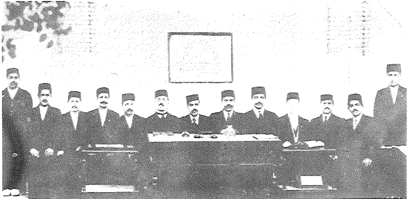
מנהיגי ההסתדרות הציונית בפרס, בתקופת ייסודה

שנשלח מפטרוגראד לוועד קהילת טהראן (חברה קדישה) 18 , מיד עם פירסום ההצהרה ברבים. כפי שמעידים המקורות והמסמכים, שמחתם של יהודי איראן לא ידעה גבול; הם החלו להתארגן מיד, כדי להכין את היהדות המקומית לימי הגאולה. חברי האירגון "חברה קדישה" דנו בישיבותיהם בהיבטים ובהשלכות של ההצהרה והחליטו לייסד בראשית שנת 1918 אירגון בשם "אגודה תרבותית לצעירים יהודיים בטהראן" (= אַנג'וּמְנֵי פְּרֶהֶנְגֵי גִ'נְאָנְאֵי יְהוּדֵי טְהֶרָאן) 19 . ראשית הפעילות הציונית התרכזה בלימוד השפה העברית, גם משום, שכאמור לעיל, זו הוזנחה וכמעט נשכחה, עקב מדיניות־החינוך של בתי־ספר כ"ח ברחבי איראן.