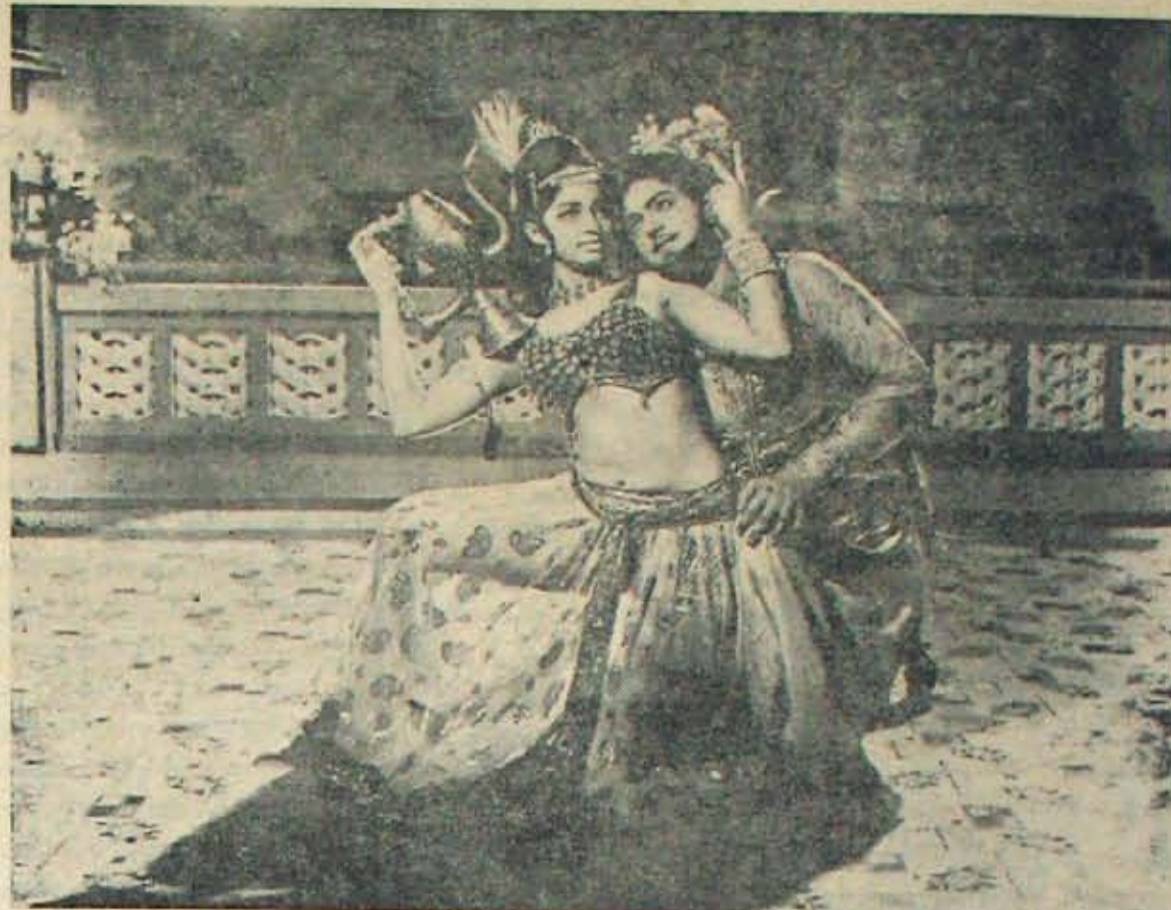
అపర! ఉమర్ ఖయాంగా హరనాథ్, ప్రణయసాఖిగా శోక్తిలక్ష్మి- 'పెద్దకక్కయ్య' లో ఒక ఖుష్టు దృశ్యం

రామా రావు నటన ఉ దా త్తం గా వున్నది. చంద్రకళ, కొత్తకారలలో మేటికయి, మొవటినుండి, దివలవరకు దాలచక్కగా నటించింది. వాణిశ్రీ, సావిత్రి క్రమంగా సినిమాలనుండి తప్పకుంటుంది అని లెంగ వడేవారి, లెంగతిర్చింది. ముప్పాతిక డాగం వాణిశ్రీ అద్భు సావిత్రిలావుంది. అరవడం, గొంతుడం, చటన, నడక, అన్ని సాద్రితినుండి తన్నరించుకున్నది. గెస్తు పాత్రలే అయినా కృష్ణకుమారి, హరనాథ్ దా ల నిం దు గా హందాగా వున్నారు. పెళ్లిమావులు అయినాక, నంబరంలో చంద్రకళ పాడుకున్నపాట (అడ-కథకు మలుపు) నతీవంగా, సాహితీస్పారకంగా, ఉన్నది బృందస్వత్యంకూడా నహణంగా, అంద్యత్యాన్ని ప్రతిబింబించేదిగా వున్నది. అన్నిపాటల్లో ఇదొక్కటే బాగున్నది. శ్రీ ఎల్. వి వ్యపాద్గారి స్క్రీన్ ప్లే సువర్ణ. ప్రత్యగాత్మగారి సంభాషణలు చాలా బాగున్నాయి. పా తు కు ఖా యి, మమ్మల్ని మీ. దిన వా రె వ రూ అను - కొరవ ప 10 పేజీలో