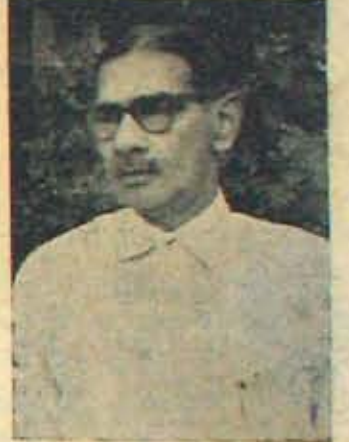
అమోదయోగ్యుడైన అభ్యర్థిగా అభ్యుక్తులు ఆర్. డి. ఆర్.?

అసలు సింగతికొస్తాం: నెల్లూరు జిల్లా కాంగ్రెస్ సంఘం కూడా హైదరాబాదు లోనే నిర్మాణ మయ్యేట్లుంది. మామూలు కార్యకమం ప్రకారమైతే ఈపాటికి నిర్మా ణం కావలసింది కాని వాయిదాపడేట్లుంది. ఏసినీ అధ్యక్ష ఎన్నిక ఎప్పుడు జర్యు మవుతుందో, దానికిముందు డిసినీ అధ్యక్ష 'ఎన్నికలు' జరగవోతాయి. అధికార యుతంగా ఎప్పుడు జరిగినా, నిర్ణయాలు మాత్రం దాదాపు ఇప్పుడే జరుగతాయని