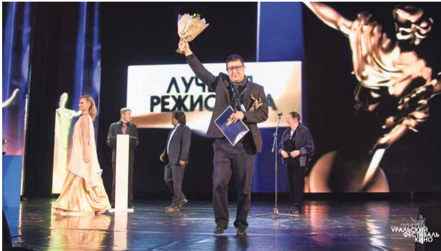
Режиссер Юсуп Разыков («Турецкое седло»)