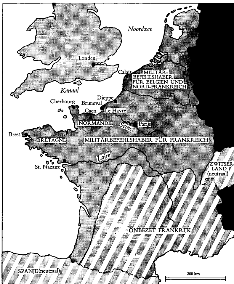
I. West-Europa, zomer 1942