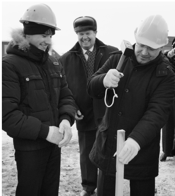
В.Якушев устанавливает первую отметку в фундамент здания школы с омутинецом В.Колтышевым

В ноябре 2011 года Губернатор Тюменской области дал старт строительству нового здания Омутинской средней школы № 2. На торжественной церемонии открытия строительной площадки Владимир Якушев вместе с учеником Виктором Колтышевым установили первую отметку в фундамент. Обращаясь к жителям села, глава региона сказал, что школа будет построена в кратчайшие сроки, что и было сделано. В 2014 году школьники и педагоги уже отмечали новоселье. На сегодняшний день в современном здании обучаются 711 учеников. Здесь есть все необходимое для учебы: 25 учебных кабинетов, актовый зал, библиотека, мастерские, спортзал, компьютерные классы. Для проведения практических занятий предусмотрены лаборатории по химии, физике и биологии. За два года стараниями коллектива преобразились интерьеры образовательного учреждения, на пришколь-