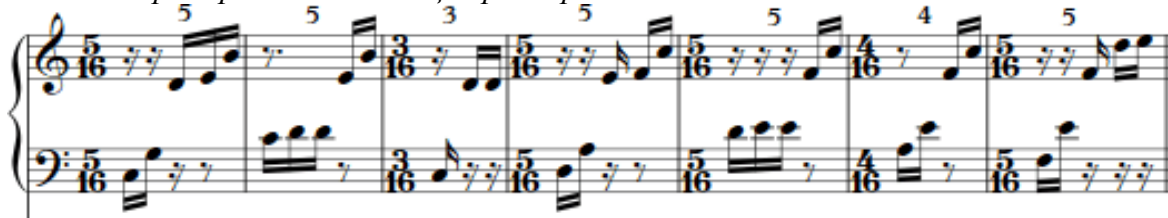
Пример №2. Комбинация размеров в « Vardavar » из альбома EP №1

В данном отрезке мелодии, размер меняется следующим образом: 5/16, 5/16, 3/16, 5/16, 5/16, 4/16, 5/16. Одно такое проведение мелодии содержит 32 шестнадцатые, что в совокупности равно двум тактам на 4/4. После этого, мелодия начинает новый «ритмический круг», с таким же чередованием переменных размеров.