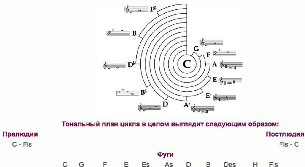
Пример № 2 Схема тонального развертывания в « Ludus tonalis » П. Хиндемита

В этой схеме мы видим, что, исходя из центра, которым композитор выбрал звук «до», разворачивается логическая последовательность интервалов от больших к меньшим (см. обертоновый ряд), делая исключение лишь с большой и малой терцией, по-видимому, исходя из представлений о ладовом родстве: ля ближе к до, чем ля бемоль. Таким образом, сначала возникли квинты-кварты в обе стороны – G, F, затем малые и большие терции по