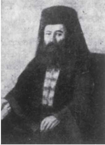
Ο Μητροπολίτης Χρυσάνθος

ράγοντες της πόλεως και από κοινού αποφάσισαν την επιβολή μικρού φόρου σε όλους τους εμπόρους και τα καταστήματα της πόλης, στο δε εξαγωγικό εμπόριο του βάμβακος επέβαλαν δύο παράδες σε κάθε φορτίο για τα κοινά της ορθόδοξης κοινότητας των Σερρών.