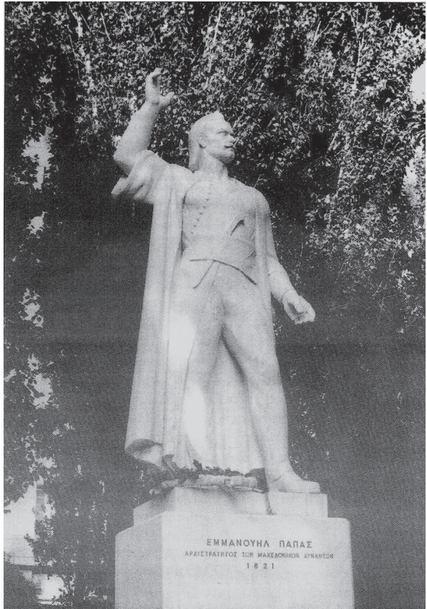
Ο ανδριάντας του Εμμανουήλ Παπά στην πλατεία Ελευθερίας των Σερρών

ζ) Ο Κωνσταντίνος έμεινε φυλακισμένος στις Σέρρες για πολλά χρόνια. Όταν απολύθηκε παντρεύτηκε την Ελένη και απέκτησε δύο κόρες, τη Ζωή και τη Χαρίκλεια. Στις 28-6-1913, την ώρα της πυρπολήσεως της πόλεως των Σερ-