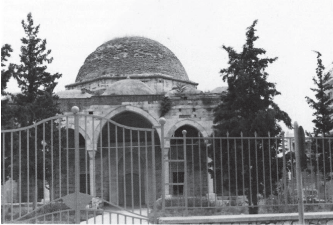
Το Σιντζιρλί τζαμί

Βρίσκεται στην οδό Ανατολικής Θράκης των Σερρών, είναι αξιόλογο οικοδόμημα με βυζαντινή τεχνοτροπία. Δίνει την εντύπωση χριστιανικού ναού με τα τρία κλίτη του και με άμβωνα παρόμοιο με αυτόν που υπήρχε άλλοτε στην Παλαιά Μητρόπολη Σερρών. Το μνημείο αυτό, αν συντηρηθεί, μπορεί να χρησιμοποιηθεί