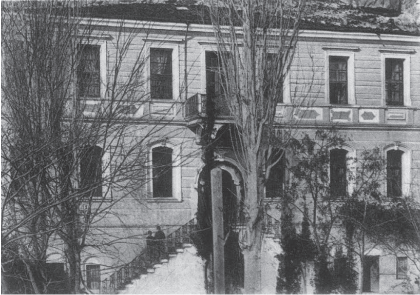
Το Παρθεναναγωγείο (Γρηγοριάς) Σερρών

Τα επιτεύγματα της παιδείας του νομού Σερρών οφείλονται στον Μακεδονικό Φιλεκπαιδευτικό Σύλλογο που ιδρύθηκε το 1870 στις Σέρρες. Ο σύλλογος αυτός συγκέντρωσε και συσπείρωσε ό,τι εκλεκτό είχε η πόλη των Σερρών