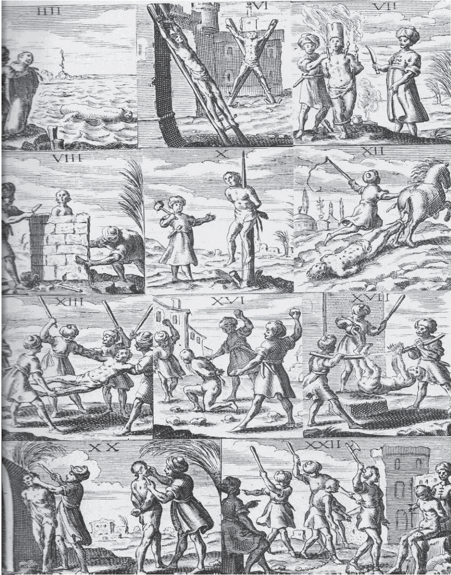
Τα βασανιστήρια που χρησιμοποιούσαν οι Τούρκοι εναντίον των χριστιανών. Εικονογραφία από τη Γεννάδιο Βιβλιοθήκη ( Ιστορία του Ελληνικού Έθνους , τ. 10, σ. 45)

Τους βασάνιζαν απάνθρωπα για να υποκύψουν. Τους χτυπούσαν άγρια, τους έκοβαν ζωντανούς τα αυτιά, τους έβγαζαν τα νύχια και τα δόντια, τους διαπόμπευαν και τους υπέβαλλαν στο βασανιστήριο της φάλαγγας. Τους έβγαζαν δεμένους σε σακιά μέχρι το λαιμό και τους έριχναν στη θάλασσα, στη λίμνη ή το ποτάμι για να πνιγούν. Τους έκαιγαν ζωντανούς μέσα σε πυρακτωμένους φούρνους. Τους σταύρωναν σε χιαστί σταυρό. Τους παλούκωναν, περώντας έναν πάσαλο μέσα από τα εντόσθια και βγάζοντάς τον από το στόμα