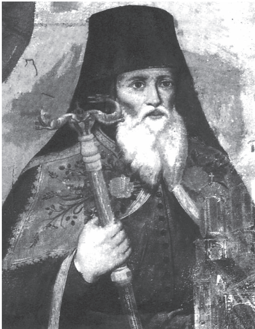
Ο Οικουμενικός Πατριάρχης Γεννάδιος Σχολάριος Β΄

χών της με τα γράμματα και τη φιλοσοφία, καθώς και την καταλληλότητα για ανάταση της ψυχής και συγγραφή έργων χάρη στην πλούσια σε χειρόγραφους κώδικες βιβλιοθήκη της. Στην ξακουστή και θαυμαστή βασιλική αυτή μονή συνέχισε τη μελέτη και τη συγγραφή πολλών έργων.