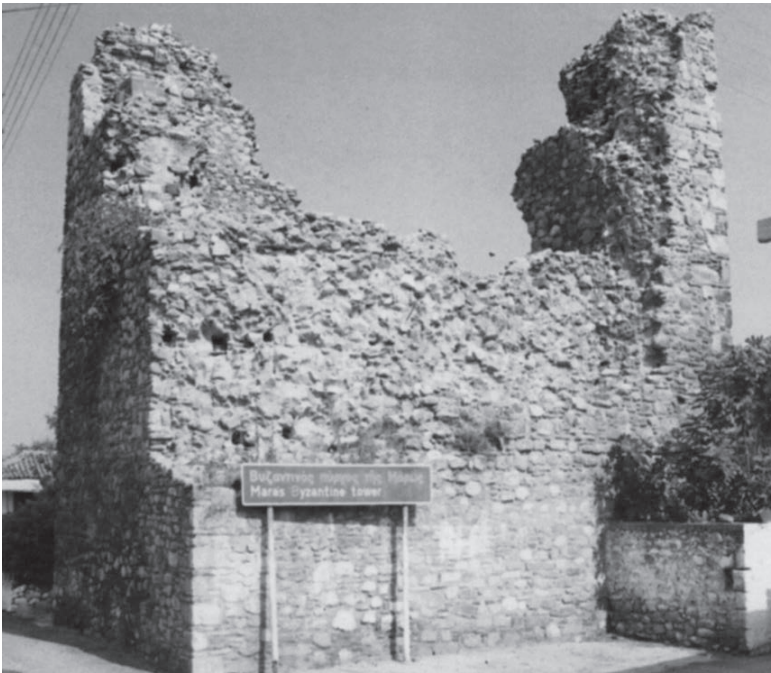
Ο πύργος της Μάρως στη Δάφνη της Βισαλτίας

Στο μέρος αυτό και σε απόσταση δύο περίπου χιλιομέτρων υπήρχε αρχαία πόλη που άλλοι θεωρούν ότι ήταν η αρχαία Ορέσκεια και άλλοι η Όσσα. Σώζονται πάρα πολλά ερείπια στο μέρος αυτό και βρέθηκαν νομίσματα με την επιγραφή «ΟΡΕΣΚΙΩΝ». Στα βυζαντινά χρόνια η κωμόπολη αυτή ήταν έδρα επισκοπής. Σ' αυτήν έγινε επίσκοπος, στο τελευταίο τέταρτο του 13 ου αιώνα, ο πρώτος κτήτορας της Ιεράς Μονής του Τιμίου Προδρόμου Μενοικέως Ιωαννίκιος. Εποίμανε για λίγα χρόνια και λόγω της μεγάλης ηλικίας του παραιτήθηκε 15 .