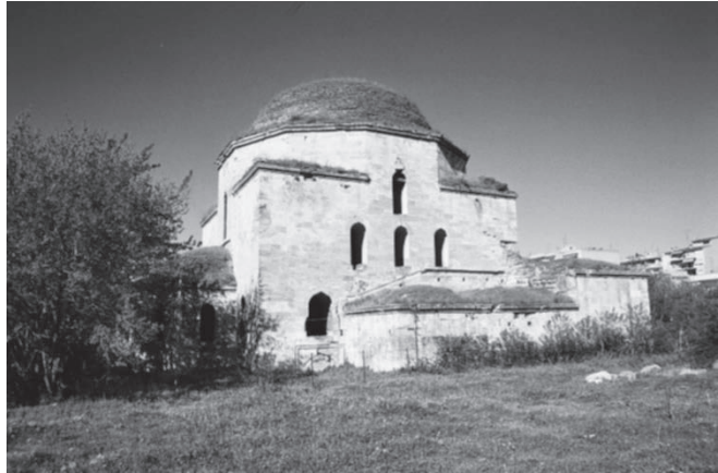
Το τέμενος του Αχμέτ πασά

Οι πληροφορίες των περιηγητών περί διαμονής πολλών κατοίκων ξένων εθνικοτήτων στο σαντζάκι των Σερρών δεν ευσταθούν. Ο αριθμός των αναφερομένων ξένων εθνικοτήτων ως κατοίκων στις Σέρρες προέρχεται από τους προσωρινούς ξένους επισκέπτες που έμεναν στην πόλη των Σερρών για εποχικές εργασίες.