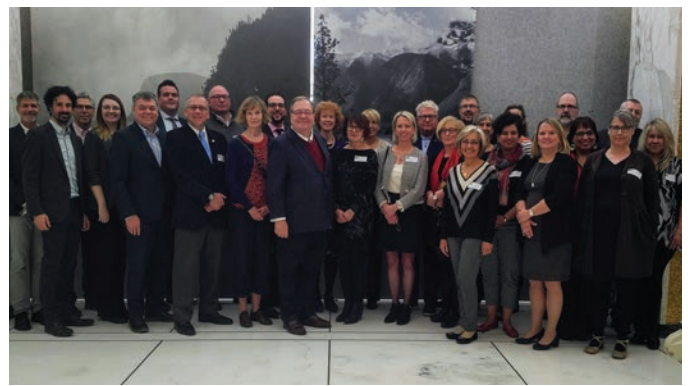
Library and Archives Canada Stakeholders forum