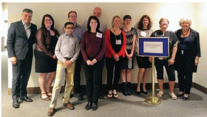
IFLA Global Vision