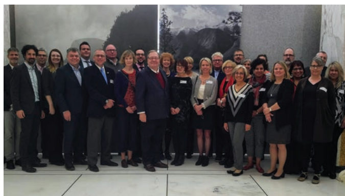
Forum des partenaires de Bibliothèques et Archives Canada